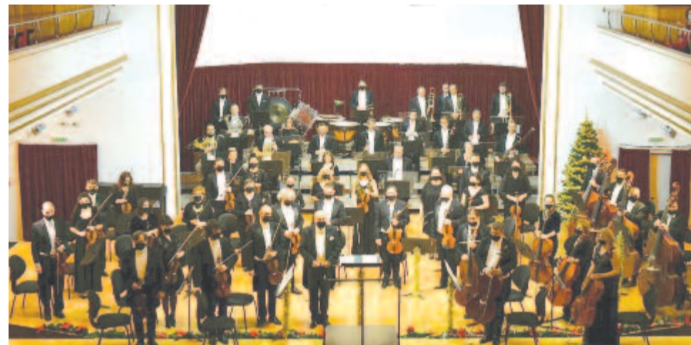
A Nagyváradi Állami Filharmónia

Döbbenetem illanásával próbáltam ugyan érvelni, megpróbáltam elmagyarázni, hogy mennyire überbrutál nehéz szakma klasszikus zenészeknek lenni, hogy amit ő csak cincogásnak hall, ahhoz mennyi munka, iskola, egyetem és nem kevés tehetség szükséges, hogy ezek az emberek a gyerekkorukat áldozzák fel a későbbi sikerekért (vagy kudarcokért) – tudom, mert a művészetben én