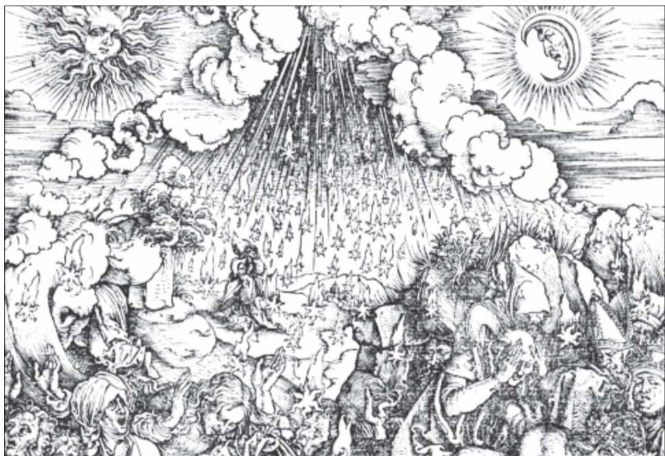
Albrecht Dürer: Az ötödik és hatodik pecsét felnyitása, 1511, részlet

Ők, a kísértetek voltak a félelem napszámosai. Mert elfogta őket a páni félelem. Ugyan mitől? Az ember ősidőktől fogva félelmeiktől rettegve élte életét. Folyton veszélyekkel nézett szembe, veszéllyé változtatta képzeletében az ismeretlen jelenségeket, melyeket képtelen volt felfogni. Így járt a kultúrával, a művészetekkel is. Nem értette, tehát félelmében pusztítani kezdte. Mivel a tanulás a világ feltáráshoz vezető titkokat fedezi fel, és az ismeretlenség rejtelmébe vezet, a műveletlen ember számára terhes, így ez az ismeretlen reflexből mindig pusztításra ingerelte. Például a talibok modern