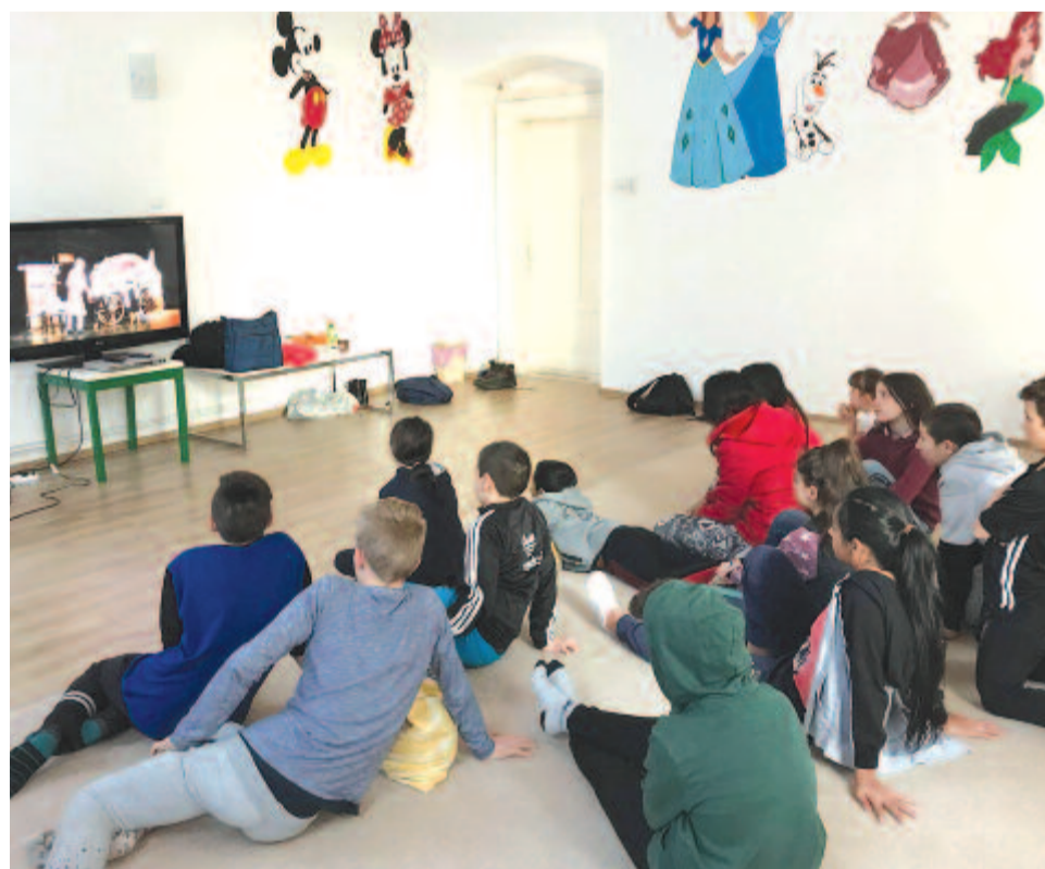
Online előadások szórványvidéken