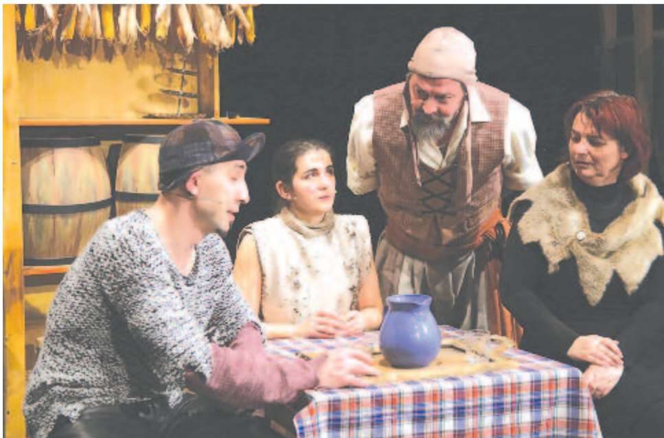
Fogadó a kíváncsi hörcsöghöz

Nem ez az első alkalom, hogy az Ariel színház gyerekelőadásokat ajándékozott a rászorulóknak – ha a járványhelyzet megszűnik, a színház tervei között szerepel, hogy újabb produkciókkal látogasson el a szórványvidékre.