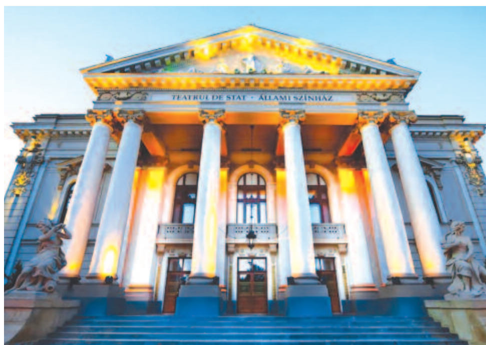
Szigligeti Színház, Nagyvárad

Kelt 2021. május 11-én, remélhetőleg a még Európához tartozó Nagyváradon és Marosvásárhelyen