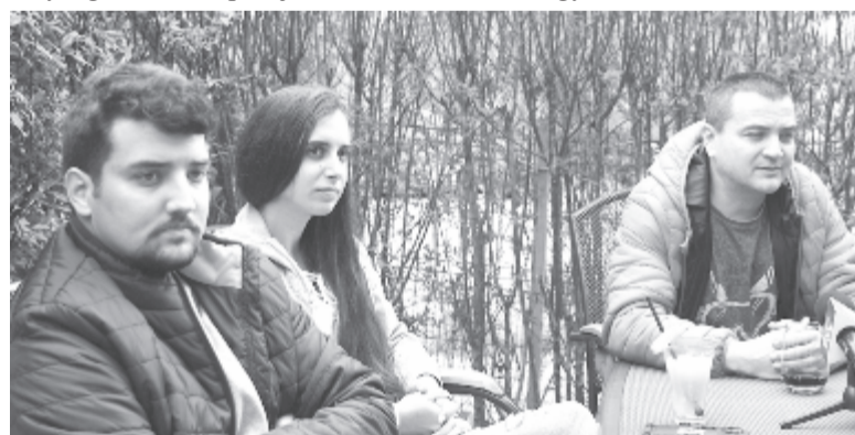
A három edző

ún. erőnléti szárazedzések, áttérnek a görkorcsolyára. Remélik, hogy szeptembertől az akadémia más helységekbeli központjaiban edző