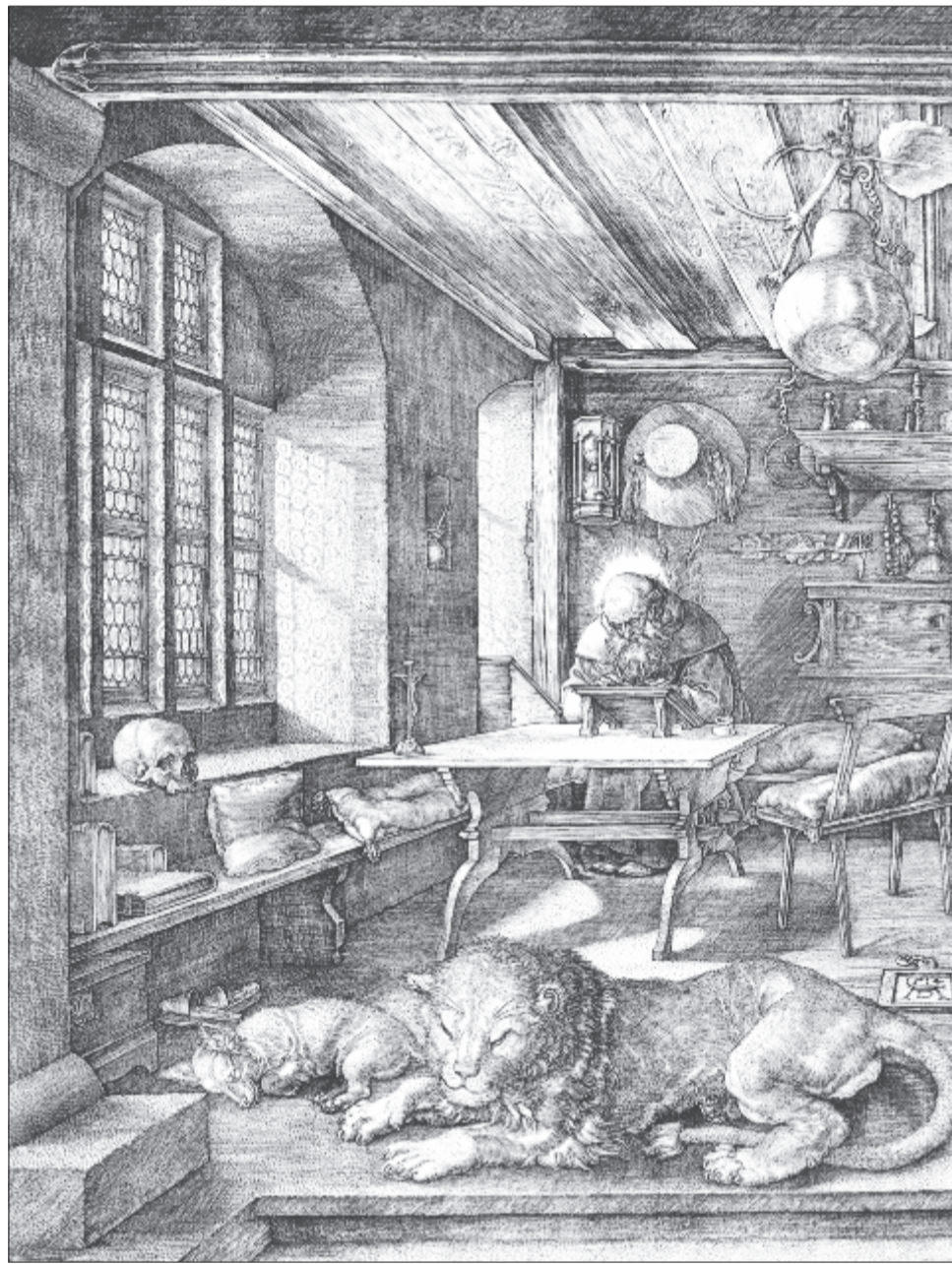
Albrecht Dürer: Szent Jeromos a dolgozószobájában, 1514

Ki kellett mennie a mosdóba. A tükör elé állt, az arcát vizsgálta, de semmit sem látott, ami a belső változás viharáról árulkodna. Sima volt, a szemlélőnek úgy tűnhetett, csú-szósan egykedvű, lesiklanak arcáról az ábrán-