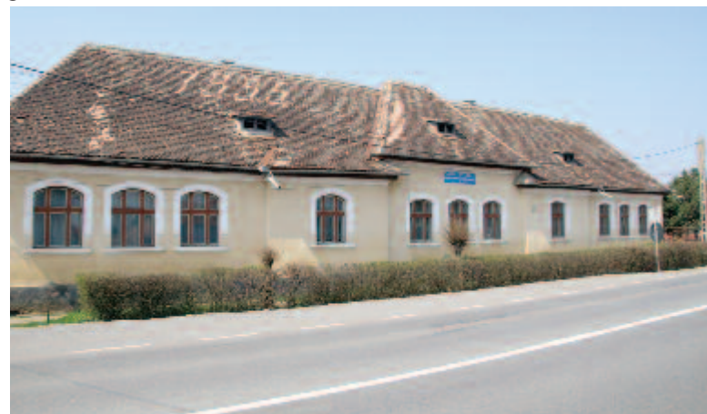
A felújításra váró vajai iskola

Az ideai tervek között szerepel az elhanyagolt épületek felújítása saját költségvetésből. Nyárádszentbenedeken az iskola tetőszerkezetét, a szövérdi kultúrotthon tetőzetét, a cserefalvi kultúrotthon és iskola tetőszerkezetét, a harasztkeréki kultúrotthon tetőszerkezetének egy részét, az ákosfalvi régi óvoda tetőszerkezetét újítják fel. A székelyvajai iskola épületének felújítása 21 millió lejtbe kerül, és a környezetvédelmi alaphoz benyújtott pályázattal nyertek rá finanszírozást. Ugyanakkor az autópark bővítését tervezik, egy nagy teljesítményű buldozert és két szolgálati autót vásárolnak.