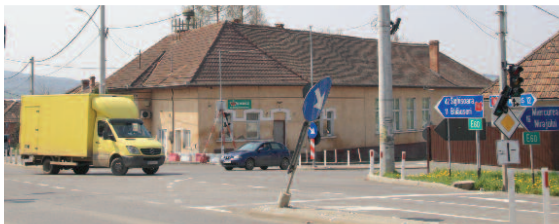
A művelődési otthon bővítésével szakorvosi rendelőket létesítenek

karításának ügyintézése folyamatban van, helyére parkolót és zöldövezetet létesítenek. A jelenlegi orvosi rendelőnek helyet adó épület általános rendbetételére pedig 365 ezer lejt különítettek el. Az üresen álló helyiségeket felújítják – a családorvosi rendelő kivételével, mivel a bérleti szerződés értelmében az a bérlők feladata –, és különböző tevékenységekre bérbé adják.