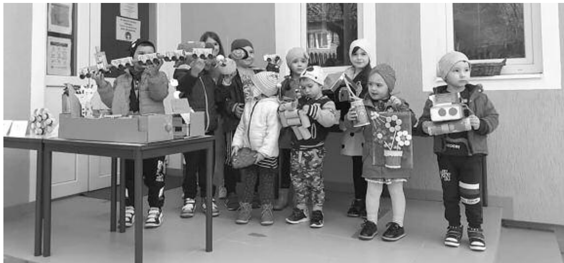
A havadtői kisgyerekek újrahasznosítható anyagokból alkottak érdekes tárgyakat