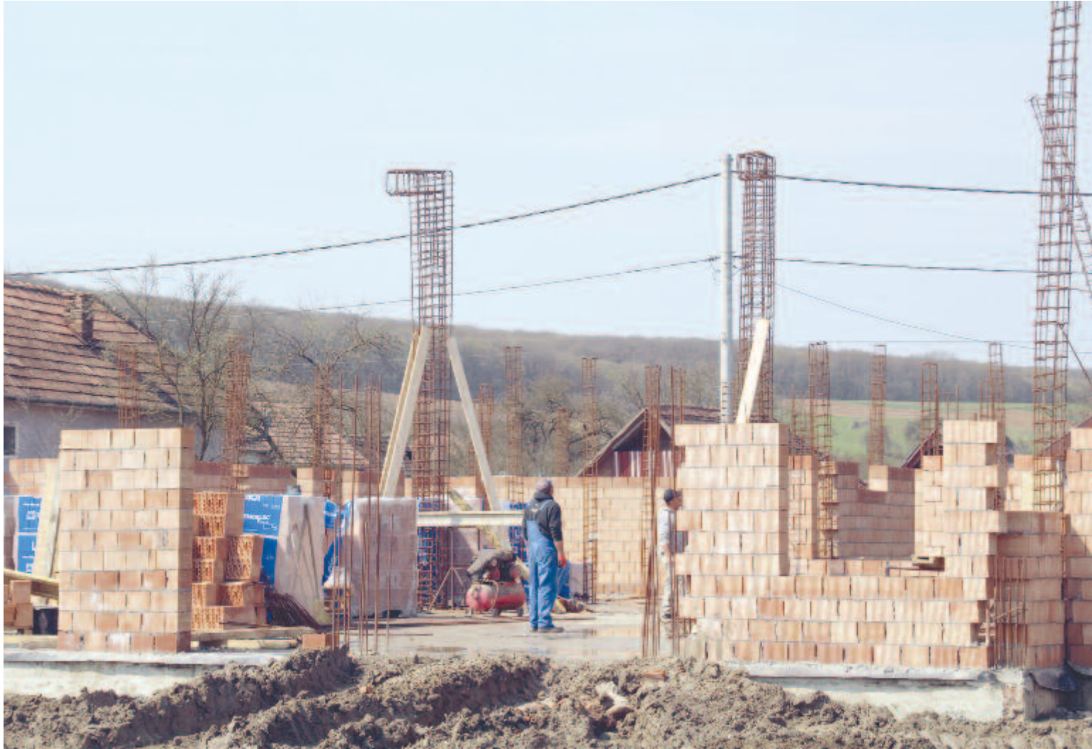
Új iskolát, óvodát és művelődési otthont építenek Göcsön