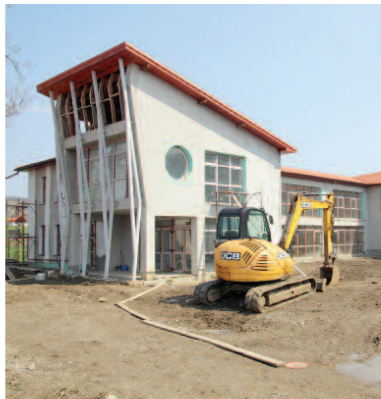
A községközpontban is új iskola, óvoda és napközi otthon készül

A községközpontban korszerű kétszintes épület készül, melyben I-IV. osztálynak helyet adó iskola, óvoda és napközi otthon kap helyet. Göcsön pedig folytatódik az új iskola, óvoda és művelődési otthon építése, ugyanakkor önkormányzati költségvetésből. Amint a polgármester kifejtette, gazdaságosabb egyazon épületben kialakítani több intézményt, mint külön épületekben működtetni őket. Amint befejezik a tanintézményt, egy műgyepes foci pályát is építenek, így a községben a göcsi lesz a negyedik, műgyeppel ellátott foci pályája. A gyereklétszámról kérdezve az előljáró hangsúlyozta, hogy az óvodás és iskoláskorú gyerekek száma növekvő tendenciát mutat, mivel egyre több fiatal költözik a község településeire.