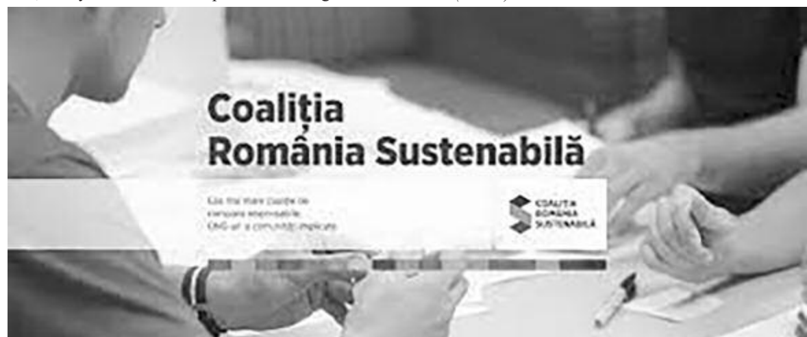
Koalíció a fenntartható fejlődésért