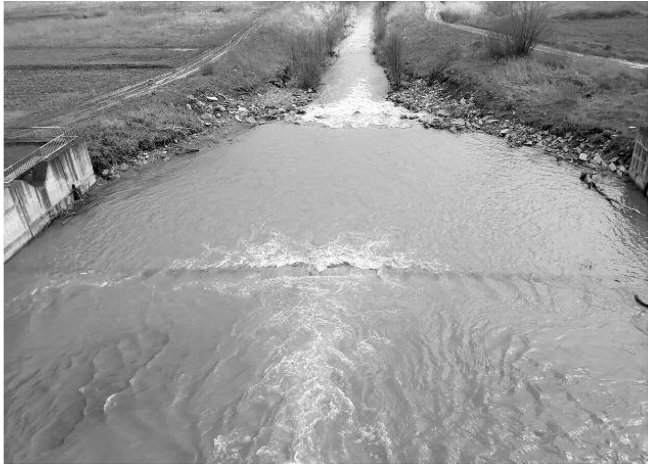
Nics árvízveszély a folyókon, a Nyárad nyugodtan és akadálymentesen folyik át a szeredai gáton