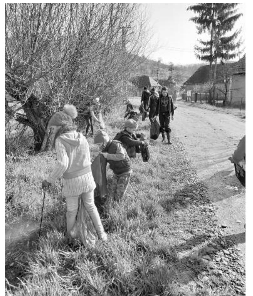
Vadadban is lelkesen takarítottak a gyerekek

Hasonló hulladékgyűjtési akcióra több helyen is sor került, a nap-sütéses hétfvégén családok, baráti társaságok is felkerekedtek, hogy megtisztítsanak egy-egy patakat, út menti sáncot vagy településrészt.