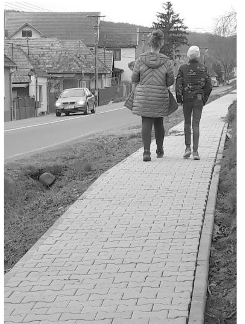
A városhoz tartozó falvakban is járda épül – tavaly jól haladtak Tompán

Mivel Szereda és Tompa között idén le kell fektetni a vízvezetékét, ebben az évben nem fognak dolgozni ezen a szakaszon, mert meg fog süppedni a föld, és az új járda tönkremenne. Ehelyett az az észszerű, ha elsőként a lakott területeken végzik a járdásítást, majd a végén egy nagyobb, látványos szakasz megépítésével összekapcsolják a kisvárost és a hozzá tartozó falvakat.