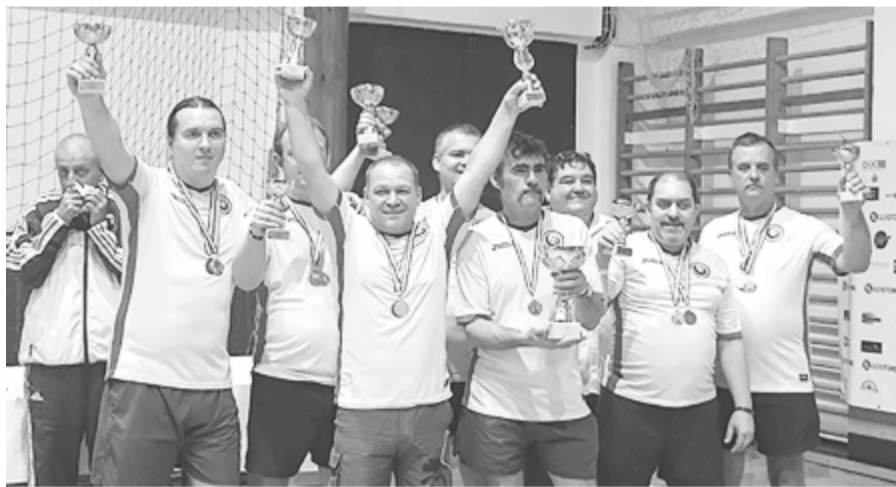
A csupa marosvásárhelyiekből álló világbajnok román válogatott