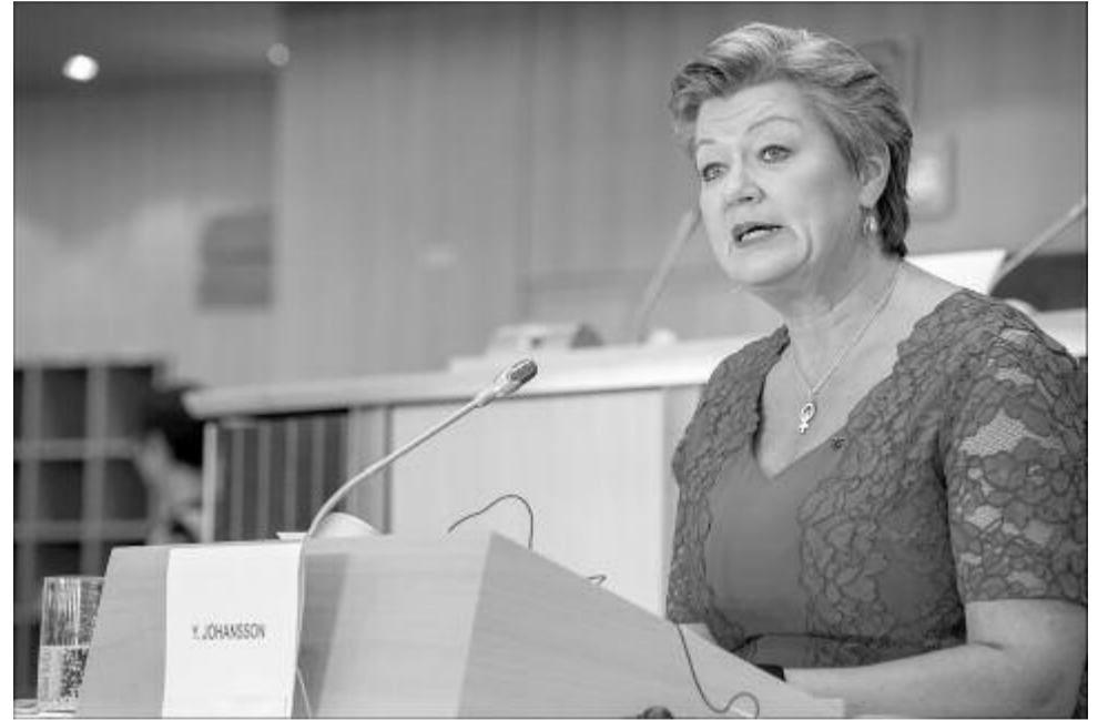
Ylva Johansson, az Európai Bizottság belügyekért felelős tagja