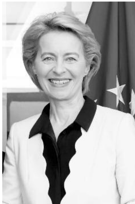
Ursula von der Leyen, az Európai Bizottság elnöke „Közös jövőnk záloga a részvételen alapuló európai demokrácia”

David Sassoli, az Európai Parlament elnöke szerint „a platform kulcsfontosságú eszköz ahhoz, hogy az európaiak részvételükkel és véleményükkel alakíthassák Európa jövőjét. Biztosítanunk kell, hogy az itt élők a koronavírus-világjárvány ellenére hangot adhassanak véleményüknek, és beleszólhassanak a döntéshozatalba. Mindenképp fenn kell tartani a képviselőt és részvételen alapuló európai demokrácia működését, hiszen ez közös jövőnk záloga.”