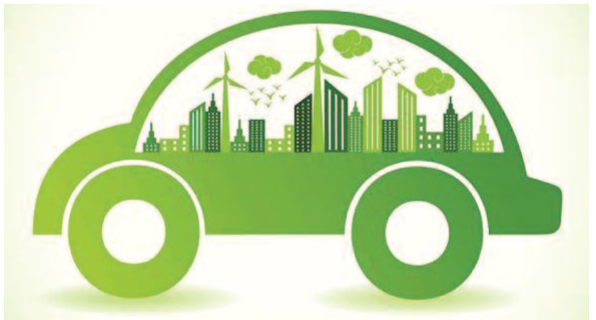
Elektromos autó – illusztráció

– A következő autója szintén elektromos lesz, esetleg visszatér a