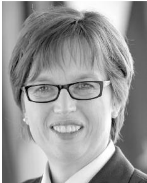
Catherine De Bolle, az Europol ügyvezető igazgatója – Europol

„A bűnözők gyorsan alkalmazkodtak az illegális termékekhez, az új működési módokhoz a Covid-19-járvány alatt. Kihasználják az európaiak félelmét és szorongását, és profitáltak abból, hogy a világjárvány során néhány létfontosságú termék hiánycikk volt” – mondta Catherine De Bolle, az Europol ügyvezető igazgatója.