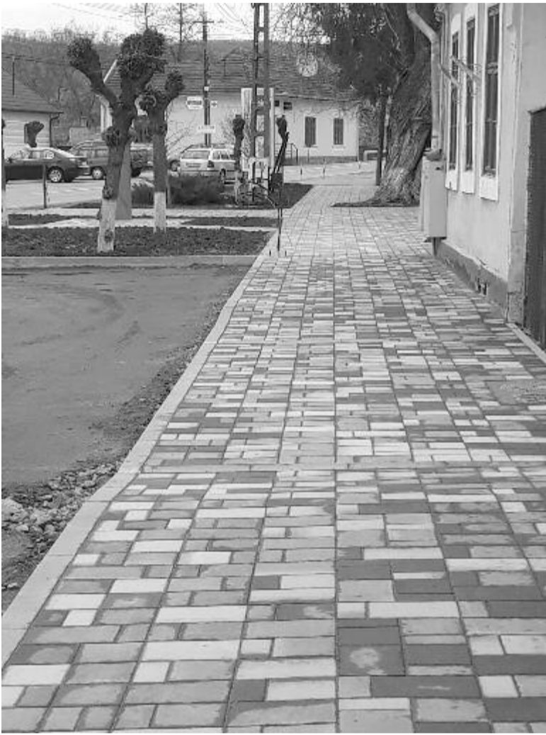
A főtér felső része megújul, és méltó környezete lesz Deák Farkas szobrának is

Amint itt minden elkészül, a munkacsoport visszaköltözik a Tűzoltó utcába, és folytatja az ősszel elkezdett munkát. Nem gondolták volna, hogy így elhúzódik itt az építés, de ez még a javukra is válhat, ugyanis így kellő idő adódott ahhoz, hogy a vezetékek elhelyezése után a föld visszatömítődjön.