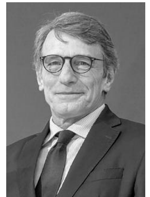
David Sassoli, az Európai Parlament elnöke

Ezek mellett szerepel még egy nyitott kategória („egyéb elképzelések”) előre meg nem határozott, több területet érintő, további