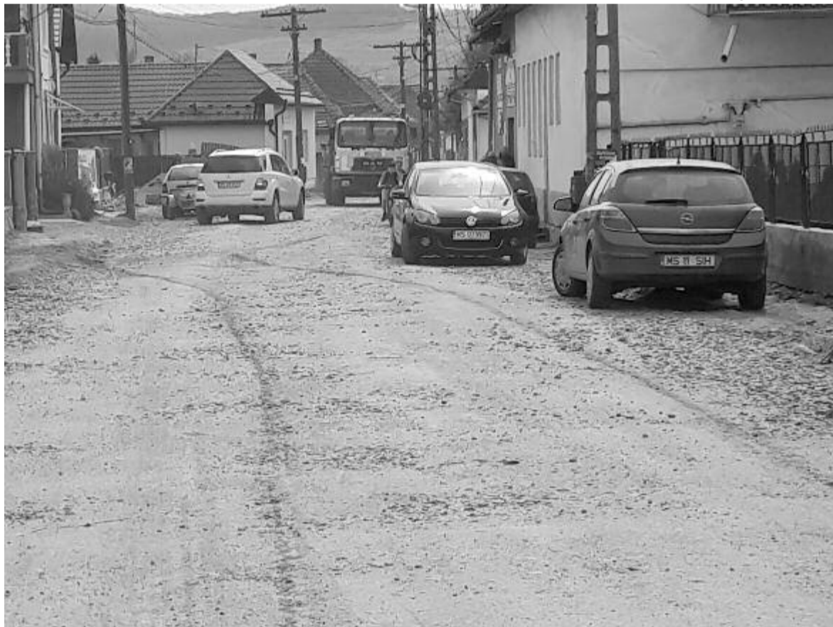
Hamarosan a Tűzoltó utcában is megépül a járda és az úttest

Ha elhamarkodták volna a munkát, egy hétig biztosan szépen mutatott volna a frissen aszfaltozott utca, de utána minőségi problémák adódtak volna, így azt lehet mondani: megérte ennyit várni – részletezte az előljáró.