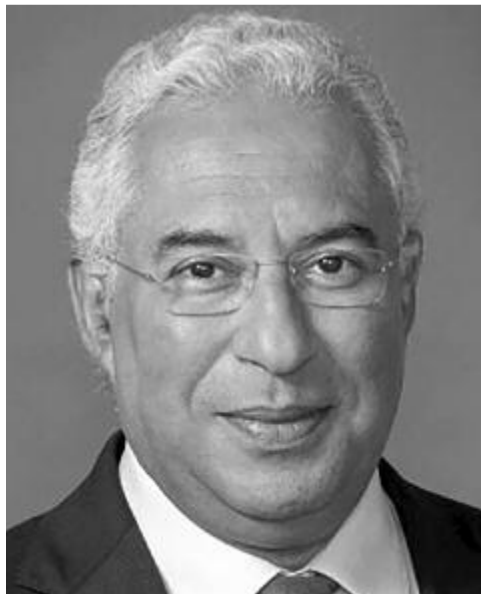
António Costa portugál miniszterelnök

A platformot az Európai Parlament, az Európai Unió Tanácsa és az Európai Bizottság képviselőiből álló végrehajtó testülete hétfőn nyitotta meg. A testület Európa minden lakóját felkérte: vegyenek részt a saját jövőjük és egész Európa sorsának alakításában. A platform 24 nyelven működik, és segítségével az európaiak uniószerre megoszthatják egymással elképzeléseiket és nézeteiket. A konferencia együttes elnöksége üdvözölte a platform elindítását.