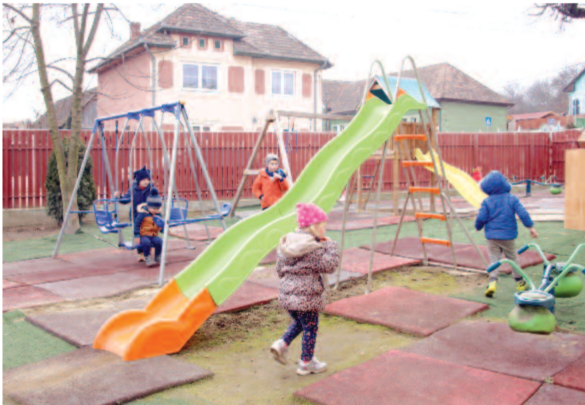
Játék a szabadban

Boldog iskolai élet, összetartás, kimagasló eredmények és pozitív fejlődés – erről szól Magyarország első tudományosan megalapozott oktatási programja az óvodás, alsós, felsős és középiskolás korosztályok számára. Az egyre népszerűbb Pozitív Pedagógia és Nevelés Program azért jött létre, hogy a pozitív pszichológia alapjaira építve segítse a gyermekeket boldog, kiegyensúlyozott és sikeres jövőjük kialakításában. A program során a gyermekek és pedagógusai együtt fedezhetik fel saját erősségeiket, társaik és a csoport erősségeit, és hozhatják ki magukból a lehető legtöbbet – fogalmaznak a szervezők. A program vezetője Bagdi Bella, a Jobb Veled a Világ Alapítvány elnöke. A boldogságórák fővédnöke: prof. dr. Bagdy Emőke, a program tudományos szaktanácsadója: prof. Oláh Attila.