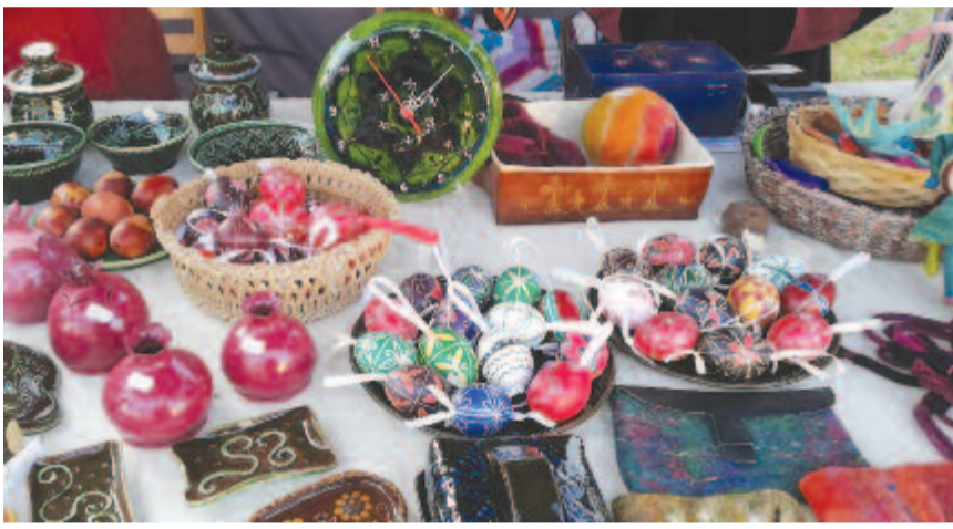
Ezeket a pompás tojásokat az illatokban, ízekben és színekben gazdag húsvéti vásáron fényképeztem a marosvásárhelyi vár udvarán.

festeni, amikor már régen leszoktak a férfiak az öntözésről, amire a „pandémia” tette fel a pontot. A gyermekei, unokái külföldön vannak, a volt gavallérok már a temetőben, őt már nincs amiért érdeklik az ünnep „pepecsmunkát” igénylő kellékei. Legszívesebben elutazna egy kis jó levegőre, de már az sem biztonságos, panaszkolta, és választ sem várva faképnél hagyott. Nem tudtam elmondani, hogy személy szerint sem a citromkrémes, sem a csokikrémes süteményről nem fogok lemondani, és jólesik minden húsvétra készülve azt a néhány tojást megfesteni, mintákkal „teleíteni”, és odatenni a tulipánokkal teli váza mellé. Ünnep elmúltával pedig izletes töltött tojással lehet változtatni, de addig is gyermekkoromtól ismert kelléke marad a húsvét, amiről nem tudok és nem is akarok lemondani. És ezt kívánom azoknak is, akik e sorokat olvassák, hogy az ünnepi istentisztelet, mise mellett, ahol a húsvét lelkeségével találkozhatunk, a családjunk, a magunk kedvéért ne hagyjuk, hogy ez a fránya vírus az ünnep régen megszokott, otthonos kellékeitől is megfossszon bennünket. (bodolai)