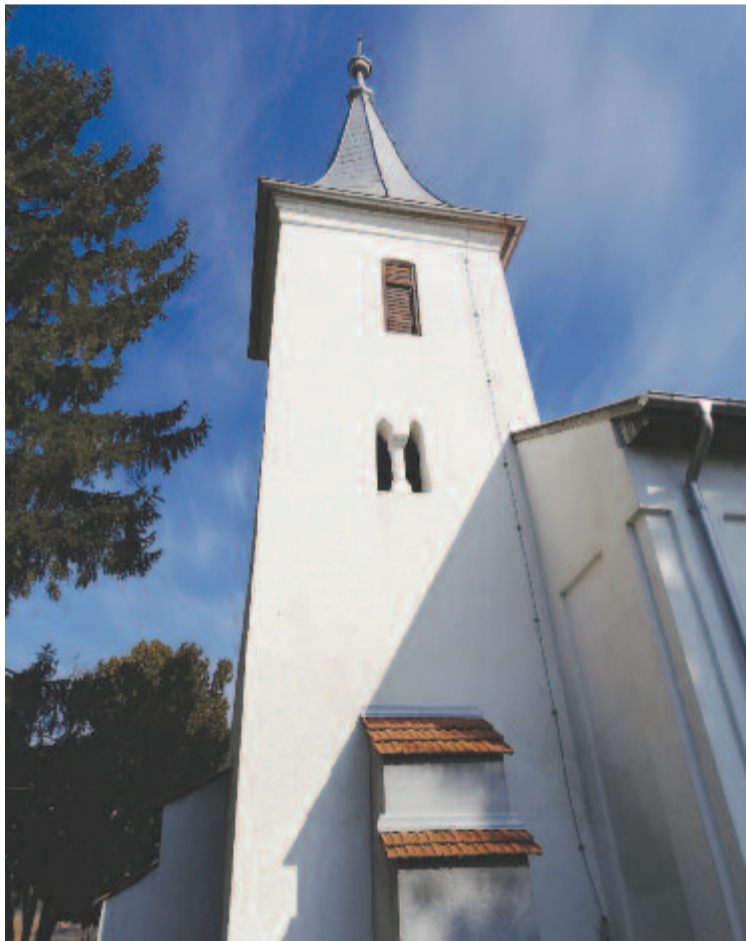
A szentkirályi templom

A sokféle népszokásról kiderül, hogy ki tudnak fejezni vallásos jelképeket, mint például a tojás, amely eltörik, és kibújik belőle az élet. Ahogy a kicsiből nem tudja fogva tartani a tojáshej, úgy Jézust sem a sír. Ahogy a gyermeket tanítjuk, hogy megértse az egyre nehezebb dolgokat, Isten a pogány világnak a szívébe úgy ültette el azokat a jeleket, amelyek az ő Fiáról szólnak. Sokszor azonban a népszokások úgy telepedtek rá a karácsonyi, húsvéti örömhíre, hogy elnyomhatták azt, most pedig amiatt siránkozhatunk, hogy kezdenek kimaradni a karácsonyi kántálások és a húsvéti locsolás is. Holott amikor már egyik sem él tovább, és a húsvétből nem marad egyéb, csak egy otthoni lakoma, akkor nagyon szegények leszünk.