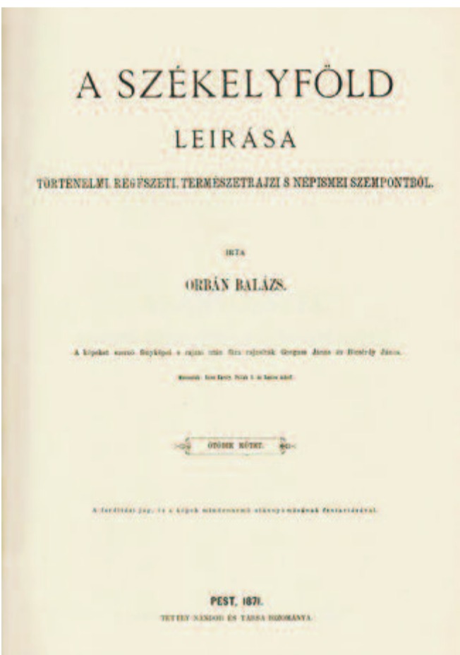
Az 1868-1873 között hat kötetben megjelentetett munka ötödik kötetének címlapja 1871-ből