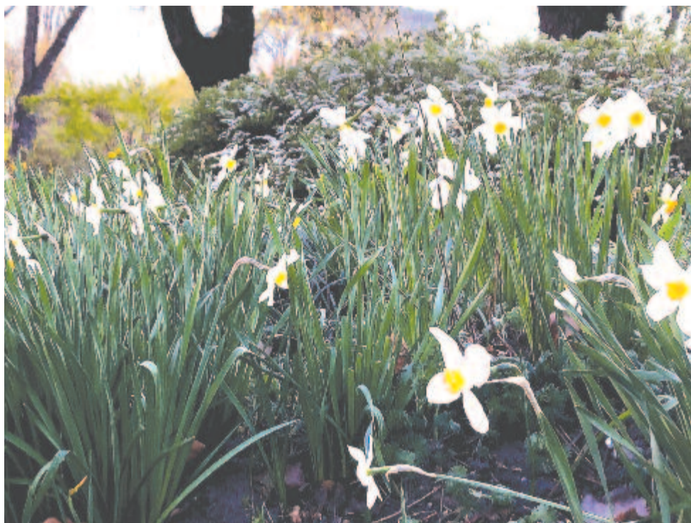
Fehér nárcisz ( Narcissus poeticus )

S e nap lép a Nap a Bikába. A Bika (Taurus) a zodiákus talán legszebb csillagképe. A Kost követi, és az Ikréket előzi meg az állatövi sorban. A Bika jegy az április 21/22. és május 21. közötti időszak védjegye. Az ókori magas kultúrák felvirágzása kezdetén az évkezdő tavaszpont még a Bikába esett (kb. i.e.