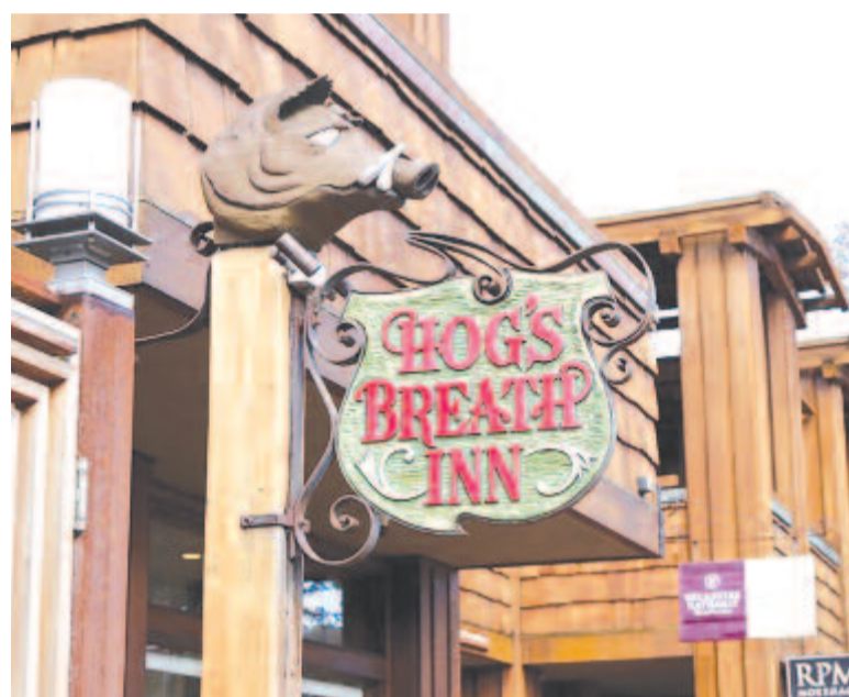
Clint Eastwood vendéglője

Utolsó állomásunk a carmeli misszionáriusok temploma, éppen a város túlsó felén van, de a település olyan kicsi, hogy 10 perc alatt ott is vagyunk. Sajnos fényképezés szempontjából rosszkor érkezünk, a nap éppen szemben van, nehéz lesz jó képet készíteni. A Carmel misszionárius templomot (teljes nevén Mission San Carlos Borromeo de Carmelo) 1771-ben alapította Junipero Serra szerzetes, akit János Pál pápa 2015-ben szentté avatott.