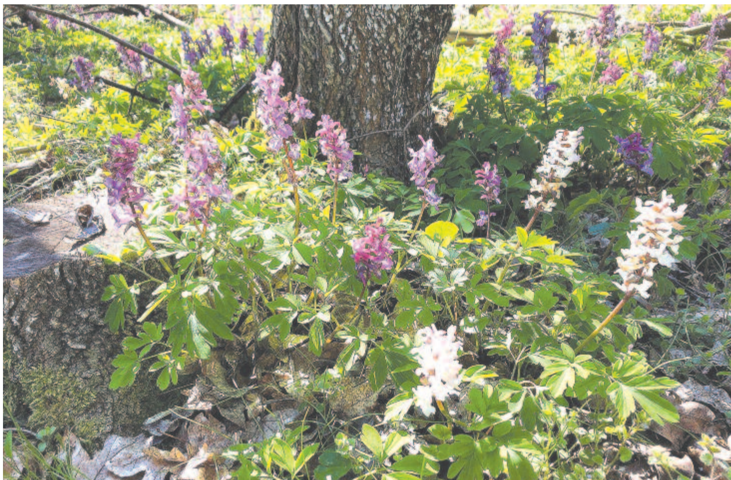
Odvas keltike ( Corydalis cava )