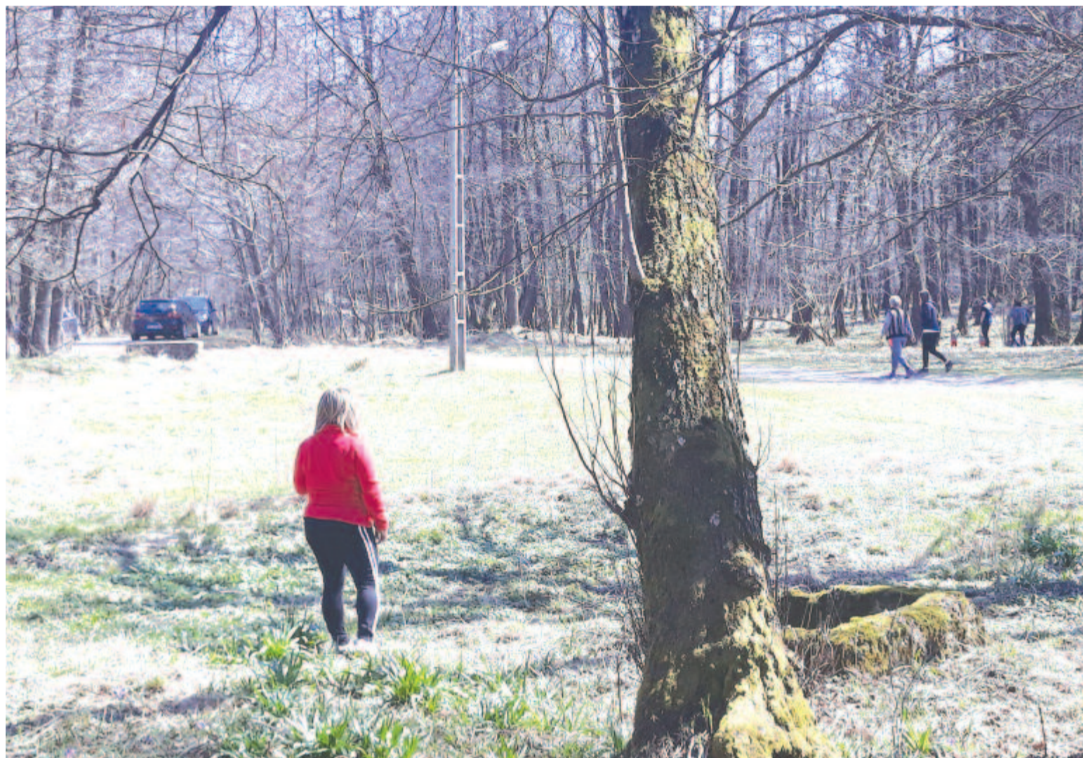
Alig ment el a hó, Vármezőt ellepték a természetre, csendre vágyó látogatók