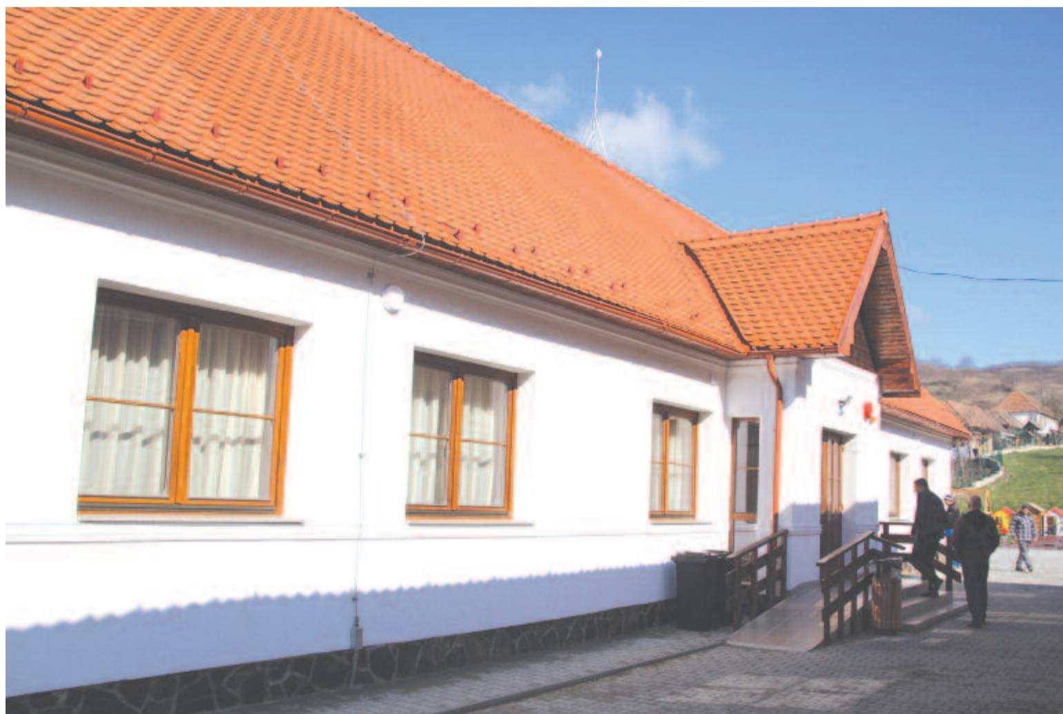
Az új óvoda épülete