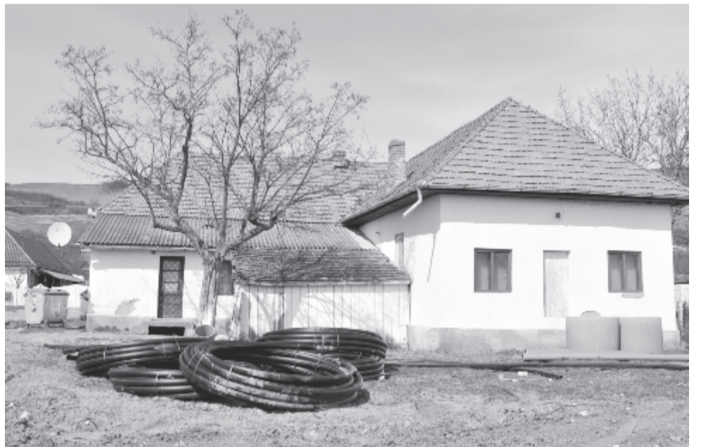
Közművesítési munkálatok Szentmargitán

A községközpontban és Búzásbesenyőben kiépült az ivóvíz- és csatornahálózat, és ahol elhelyezték a közműveket, ott aszfaltoztak is. Jól haladnak a csatornázással Szentmargitán, majd következik Magyardeáll. Ugyanakkor a főút (E 60) mentén is sikerült – a különleges kábelhálózatot áthidalva – folytatni a munkát. Az idén a költségvetésből támogatják a par-