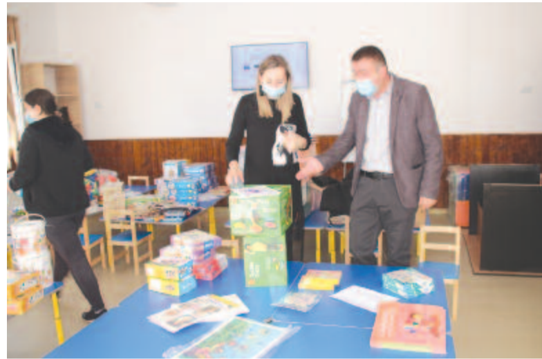
Készülődés az óvodában

Küküllőszéplakon felújítottunk egy sportbázist, az iskola udvarán lévő létesítménybe műgyepet helyeztünk el, Héderfája faluban saját költségvetésből kiépítettünk másfél kilométernyi járdát – volt munka és megvalósítás egyaránt, és mindez