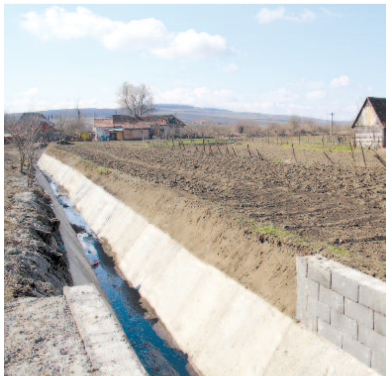
Betonsánc a Küküllőig

1400 parcelláról állítottunk ki ingyenesen telekkönyvet a tavaly – ezt pályázat nyomán, teljes mértékben a kataszteri hivatal finanszírozza. Ahogy a hivatal idei költségvetése meglesz, ezt folytatni fogjuk, értesítést kaptunk, hogy részesei vagyunk a programnak. Megyei szinten 80 település vesz részt benne, a szerződés értéke 50.000 euró körül van. A dokumentációt elkészítettük, és miután a szerződést aláírtuk, le is tudunk tenni körülbelül 1600 parcellára telekelségi igénylést. Ezek magánterületek, nagy hangsúlyt fektetünk erre. Idáig több mint 3500 parcellát telekeltünk, ez körülbelül a földek 55 százalékát teszi ki. Számunkra nagyon fontos, hogy tisztán lássuk, mi az, ami a miénk.