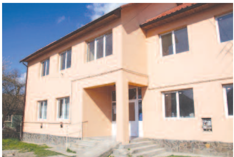
Felújítják az orvosi rendelőt

A tavalyi év folyamán árvízvédelemre is kaptunk pénzt a kormánytól, ebből sikerült az árvízvédelmi munkálatok kilencven százalékát elvégezni, a maradék tízszázaléknyit hamarosan befejezzük. Ezen munkálatok keretében egy-egy gyaloghídat építettünk Nagyszentlászlón és Kisszentlászlón, egy autóforgalomnak is megfelelő hidat