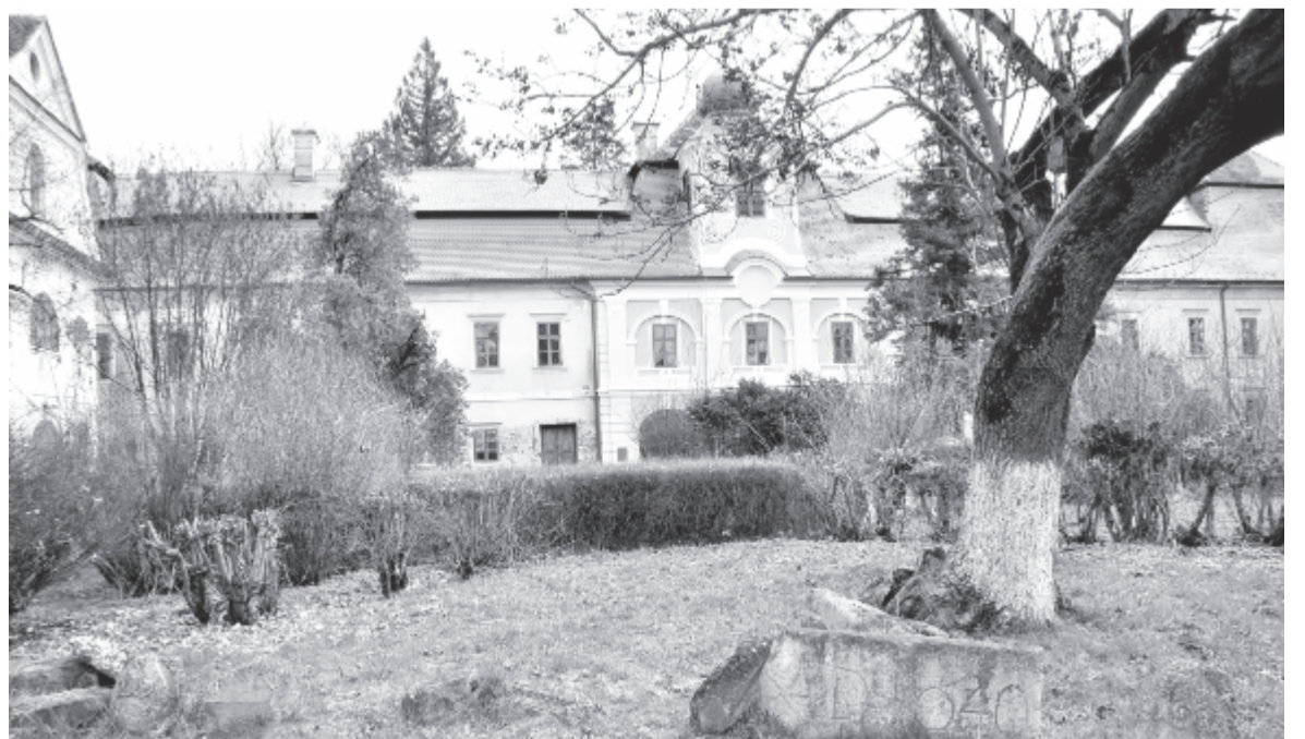
A görögényszentimrei Rákóczi-Bornemissza-kastély

Amint korábban említettük, az új igazgató elsősorban a múzeum pedagógiai tevékenységeket erősítően. Azt szeretné, hogy a látogatóknak különprogramokat ajánljanak, amelyek kapcsán a kicsiktől a nagyokig mindenki valami érdekeset, különlegeset tudjon meg múltunkról, ugyanakkor tanuljanak, életre szóló információkat szerezzenek. Különösen fontos, hogy a szociális média rengetegében szörföző gyerekek, fiatalok a szakemberektől tájékozódjanak, mert ez a későbbiekben is eligazítást nyújthat számukra a különböző helyekről kapott információk halmazában. A szakszerű tájékoztatás, oktatás is az egyik fontos múzeumi küldetés – hangsúlyozta a nemrég kinevezett múzeumigazgató.