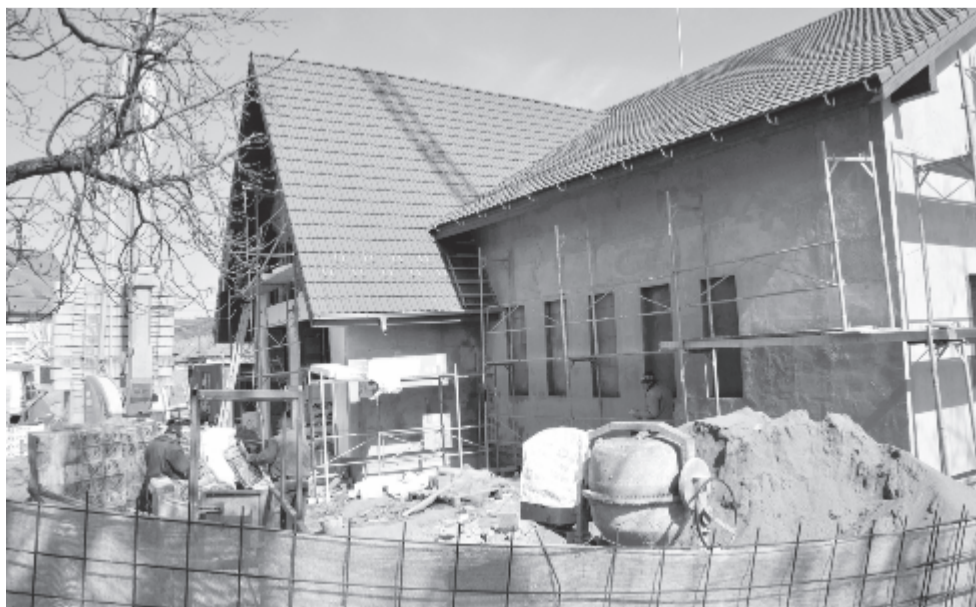
Épül a kerelőszentpáli kultúrotthon

Még nem hirdették meg az uniós pályázatokat, de készülnek arra, hogy a regionális operatív programon keresztül vagy a vidékfejlesztési kiírásokra jelentkezzenek óvoda és kultúrotthonok javítására. Az utóbbiban elsősorban a művelődési házakat tennék rendbe. Van már sikeres pályázat, az Országos Beruházási Alap (CNI) támogatásával folyamatban van a kerelőszentpáli kultúrotthon felújítása (fotón). Tavaly fogtak hozzá az építkezéshez, és a CNI beruházásaként az idén novemberben kell befejezni. A beruházás értéke 2,7 millió lej, amivel a berendezést is finanszírozzák. Az önkormányzat hozzájárulása 415.000 lej, amiből finanszírozták az épület közművesítését és manzárdosítják az eredetit. Az új művelődési otthonban könyvtár, ifjúsági klub és egy nagy, 260 férőhelyes előadóterem kap helyet. Az épületet decemberben vehetik majd igénybe a lakosok, abban a reményben, hogy akkor már a járványügyi megszorítások nélkül használhatják.