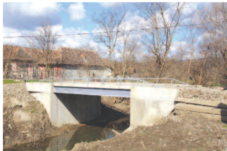
Új híd az autóforgalomnak

Új terveink is vannak, készítünk egy új, a környezetvédelmi alaphoz benyújtandó pályázatot a küküllőszéplaki általános iskola felújítására, Küküllőszéplak faluban pedig