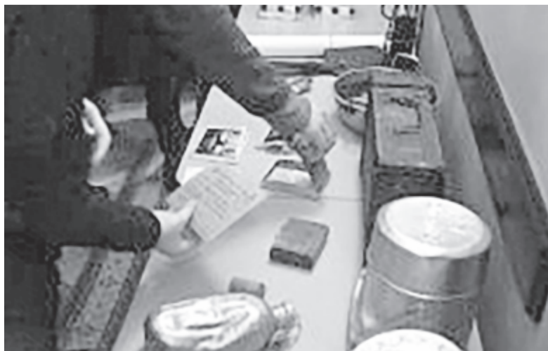
A kolozsvári Sapientia egyetemen nyílt emlékkiállítás