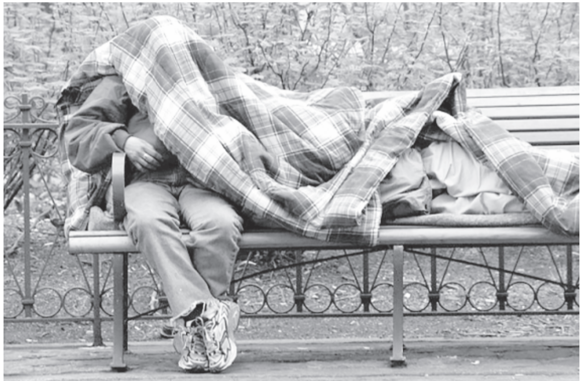
Hajléktalanok – illusztráció