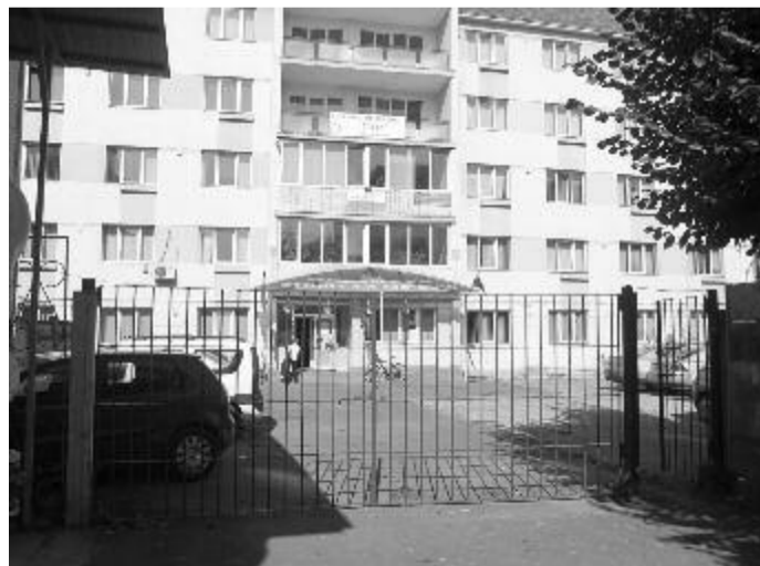
A Maros Megyei Tanfelügyelőség

forgatókönyv értelmében megkezdődik a tantermi oktatás. Ide tartoznak: Segesvár municípium, Radnót, Nyárádszereda, Erdőszentgyörgy, Szováta városok, valamint az Ákosfalva, Adámos, Fehéregyháza, Magyaró, Apold, Cintos, Bogács, Bonyha, Balavásár, Mezőbánd, Alsóbölkény, Székelybere, Magyarbükös, Marosvécs, Mezőcsávás, Maroskece, Kibéd, Alsókőhér, Kozma, Karácsonyfalva, Kutyfalva, Dános, Nagyernye, Gyulakuta, Faragó, Vámosgálfalva, Nyárádgálfalva, Dózsa György, Makfalva, Sárpatok, Gernyeszeg, Mezőgerebenes, Görgényszentimre, Hodák, Székelyhodos, Libánfalva, Iklánd, Alsóidecs, Tekeújfalu, Nyárádmagyarós, Nádas, Havad, Marosugra, Backamadaras, Petele, Mezőrűcs, Marosoroszi, Marosszentkirály, Marosszentgyörgy, Kerelőszentpál, Marosszentanna, Sóvár, Szászkezd, Mezősályi, Mezőbodon, Gödemesterháza, Küküllőszéplak, Marosfalu, Mezőtőhát, Mezőceked, Héjjasfalva, Csíkfalu, Székelyvécske, Csatófalva, Vajdaszenivány, Zágór, Mezőzáh községekhez tartozó települések.