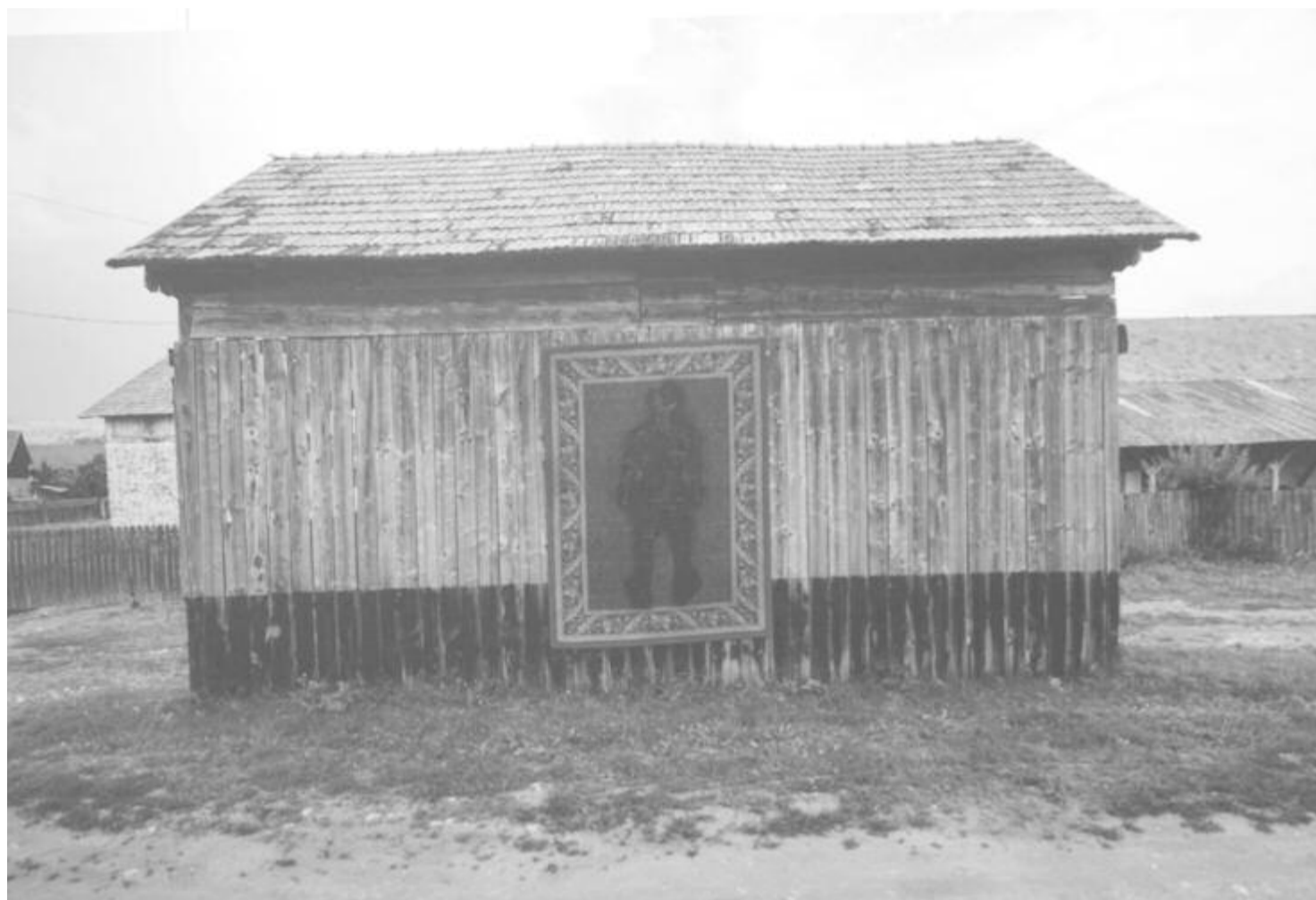
Mellékletünket a 2020-as gyergyószerhegyi alkotótáborok marosvásárhelyi, Bernády Házban bemutatott anyagából illusztráltuk.

1930. február 3-án, 91 éve született Zámolyon a kétszeres Kossuth- és kétszeres József Attila-díjas költő, esszéíró, prózaíró és politikus, a Digitális Irodalmi Akadémia alapító tagja, a nemzet művésze (elhunyt 2016-ban Budapesten).