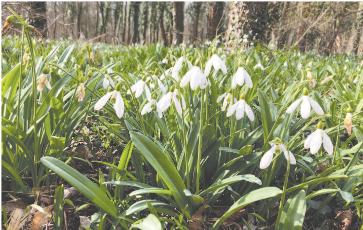
Üde hóvirág-katonák, mint csillagfolyó, győzedelmes ár, dalolva jönnek a hegyoldalra

Kelt 2021-ben, március előtt három nappal