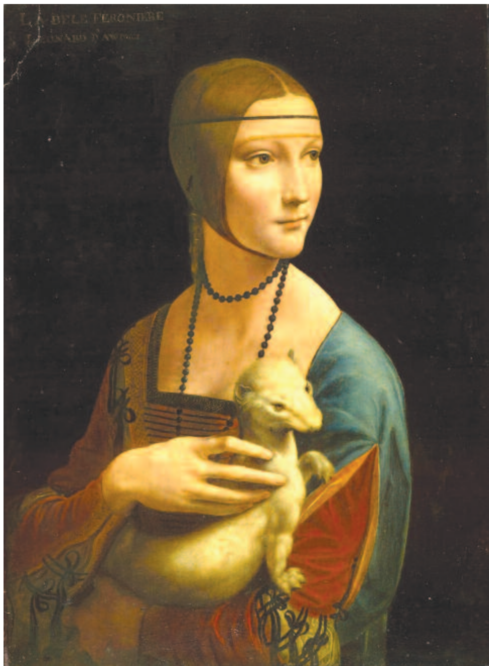
Leonardo da Vinci – Hölgy hermelinnel

Ennek a hermelinkultuszhoz hódolt Leonardo da Vinci is: 1489/1490-ben festette volt a Hölgy hermelinnel művét, a Krakkói Nemzeti Múzeum kincsét. Egyes vélemények szerint, bár a kép címe szerint a hölgy hermelint tart a kezében, az állat valójában vadászgörény, más vélemények azonban tagadják ezt. A festményt a XVIII. században vásárolta meg a lengyel Czartoryski hercegi család, majd háborús események miatt Pá-