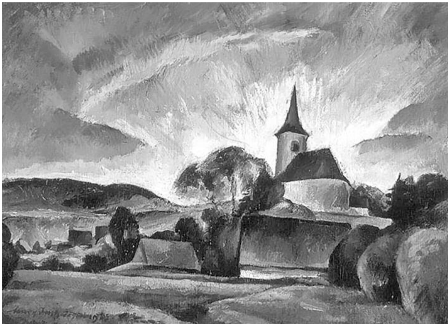
Mellékletünk Zsögödi Nagy Imre (1893–1976) képeivel illusztráltuk. A Kulturpalotában január 31-ig látogatható a Maros Megyei Múzeum – Művészeti Múzeum által szervezett kiállítás, ahol megtekinthető Zsögödi Nagy Imre képei. A Kulturpalotában keddtől péntekig 9–16 óra között, szombaton és vasárnap 9 órától 14.30-ig fogadják az érdeklődőket

Maradj velem, óév-madár! Még el ne hagyj, ezüstrigó! Az ég közel, s míg átölel, tolladból hull a tiszta hó.