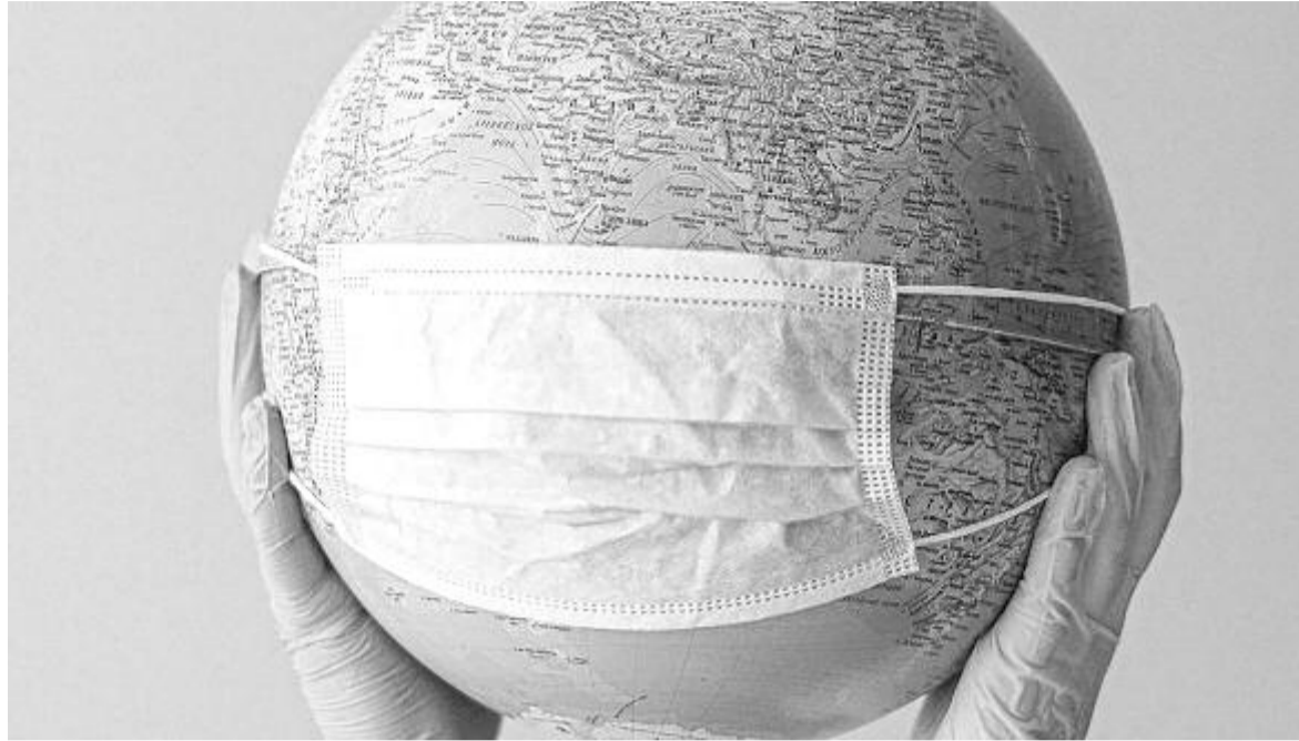
Egyfajta digitális vakcinaútlevél van tervben