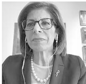
Stella Kyriakides egészségügyi biztos

„Ennek a központnak a kapacitása lehetővé tenné heti 2300 ember