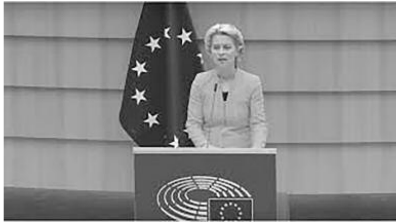
Ursula von der Leyen, az EB elnöke

„Itt nem arról van szó, hogy első az EU, hanem hogy az unió meg-