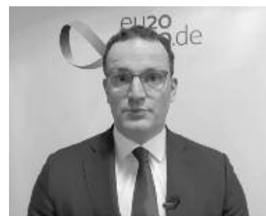
Jens Spahn német egészségügyi miniszter

beoltását, de lehetőségünk csak kb. 1500-ra van, az érkező adagok függvényében. Azt is folyamatosan módosítják, így nekünk is állandóan újra kell szerveznünk az emberek mozgósítását. Jelentős igény lenne az oltásra, ezért családostan vagyunk, hogy ilyen megbízhatatlan a szállítás, és nem tudjuk a helyi lehetőségeinket maximálisan kihasználni kellő mennyiségű vakcina híján.”