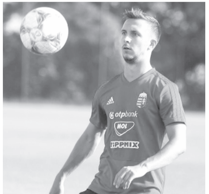
A Honvéd újdonsült játékosa tízszerez lehetőséget kapott a válogatottban is.