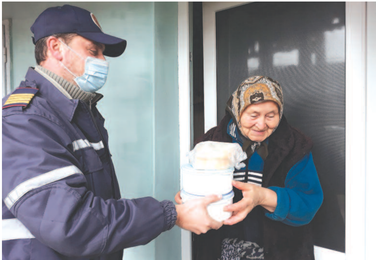
Elkel a segítség – egy szeredai vállalkozó öt rászorulóknak juttat ingyen meleg ebédet, amit az önkormányzat szállít ki