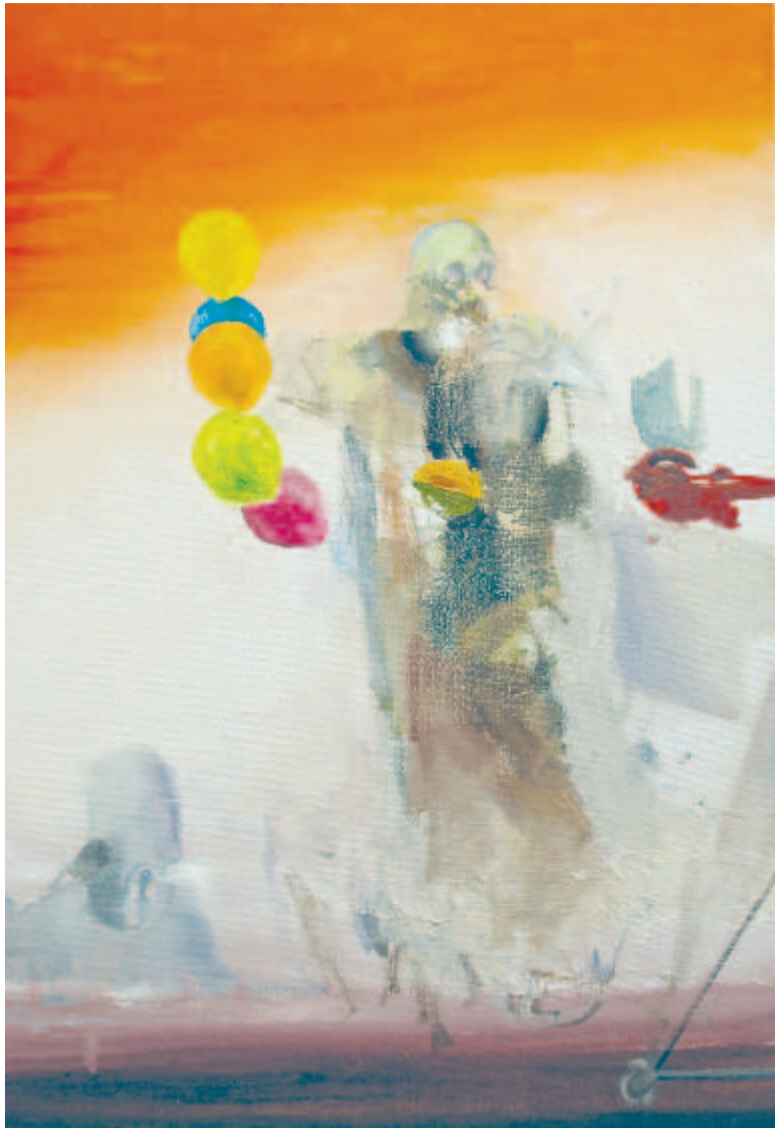
Gagyi Botond: Lufisbácsi