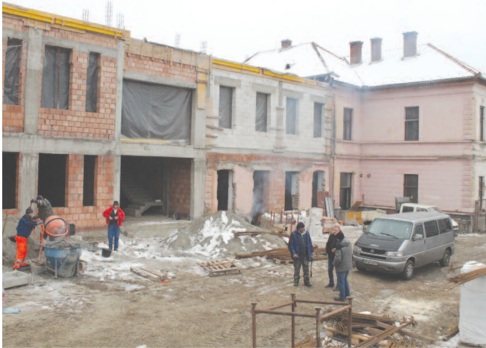
Az erdőszentgyörgyi iskola épülő új szárnya 2020 januárjában