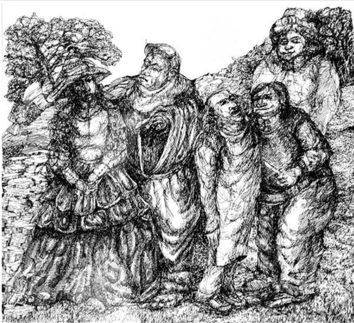
Szentiványi álom... Szepessy Béla grafikája