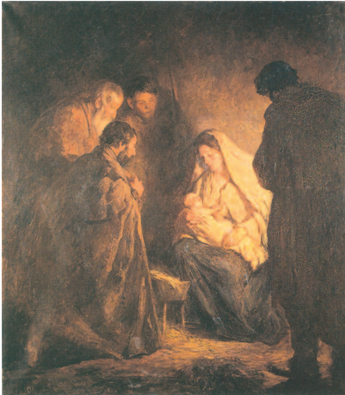
Boruth Andor: Jézus születése –1905

A toronyban ekkor hetet ütött az óra. S e földi hangtól megmerevedtek újra a szobrok, de a mosolygás mintha ott maradt volna az arcukon. (1949)