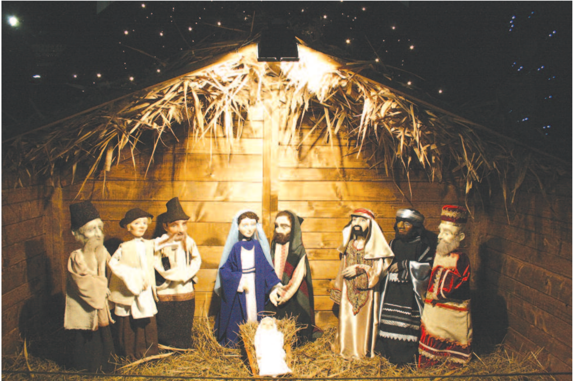
Betlehemes a nagygyermei polgármesteri hivatal épülete előtt. Készítette a Nagygyermei Alkotói Ifjúsági Egyesület