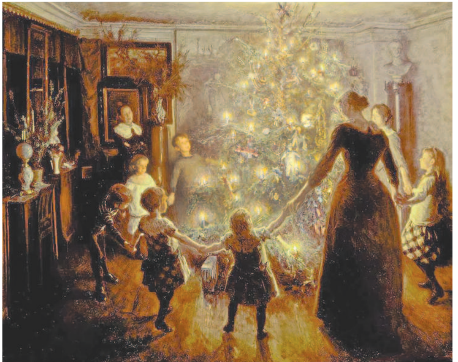
Viggo Johansen: Csendes éj –1891