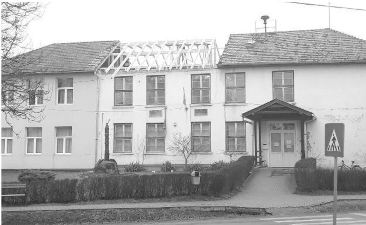
Csíkfalván újjáépítik a tetőzetet, Búzaházán ennél is előbbre vannak