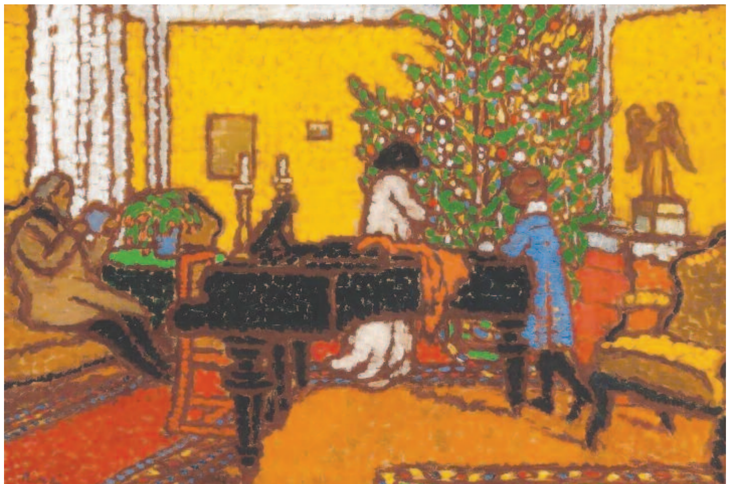
Rippl Rónai József, 1910