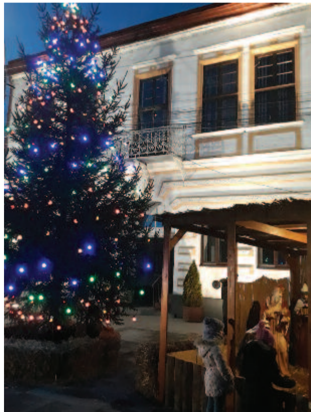
Karácsonyfa és betlehemes a városháza előtt Nyárádszeredában

Az önkormányzatok jóvoltából idén is jut helyenként ajándécsomag ünnep előtt a gyerekeknek, időseknek, rászorulóknak. Székelyhodos község iskoláival mellett 220 idős is részesül belőle, az önkormányzat 6 ezer lejt fordított erre, míg Karácsonfalván ennél több is jutott az iskolásoknak szánt csomagokra, 20 ezer lejt. Nyárádgálfalva vezetői 10 ezer lejt (ebből háromezer a Surtec áruház felajánlásából) szántak 240 gyerek és 75 idős megajándékozására, ugyanennyit fordít Backamadaras 197 gyerek ajándékára, míg Nyárádszeredában ezúttal az időseknél lakóinak kedveznek. Székelybere 175 gyereknek és 75 idősnek juttat egyenként 15 lejes ajándécsomagot, míg Csikfalva 94 idős, illetve fogyatékkal élő személynek ad át 20 lejes élelmiszer-csomagot. Koronka községben 350 gyerek vehet át ajándékot a napokban, Gyulakuta községben mintegy 550 diákot és 280 idős megajándékoznak meg. Nyárádmagyarós 8 ezer lejt fordított 200 gyerek és 150 idős megajándékozására, Makfalva községben pedig 425 gyerek jutott ajándékhoz.