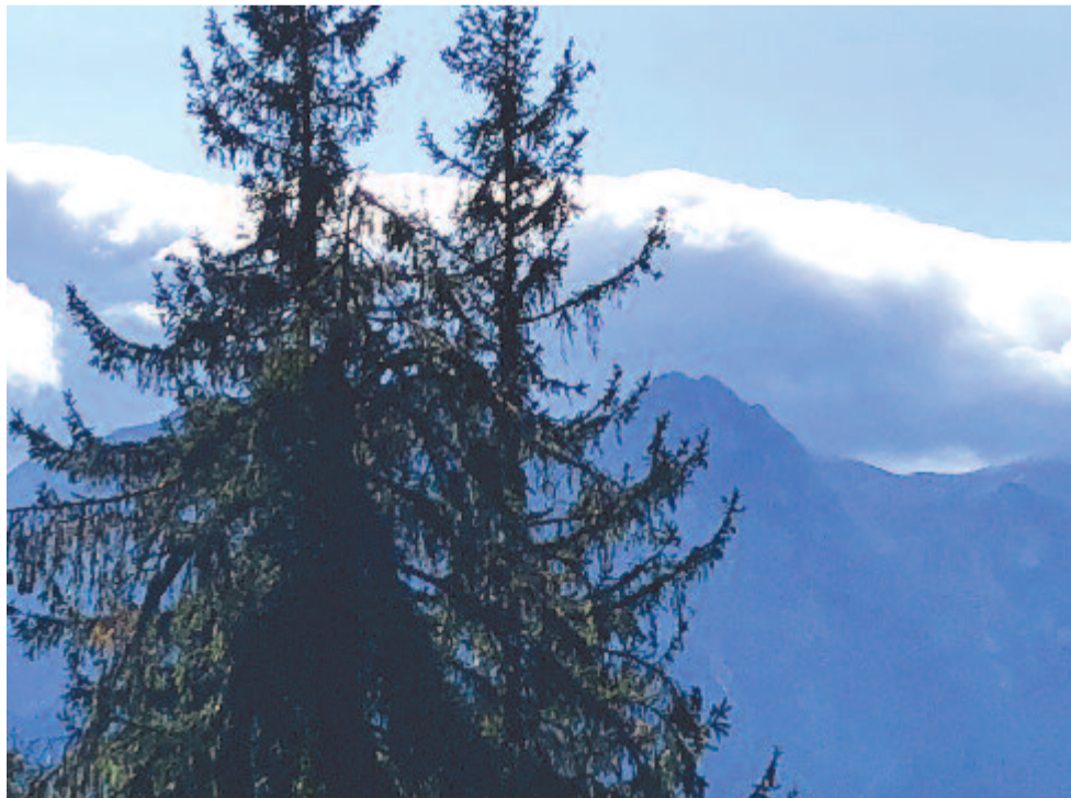
Fenyőszagú a lég, december dunnájából hó pilinkál