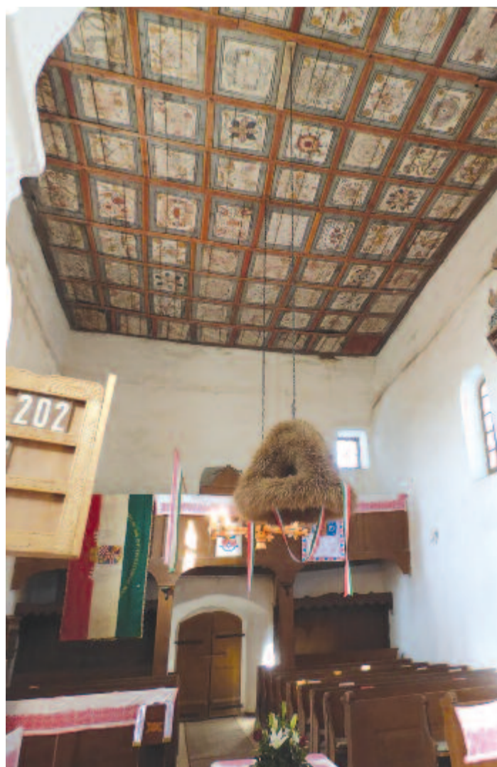
A templom festett mennyezetét 1670-ben készítették nyárádmesti mesterek