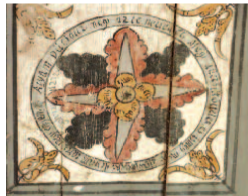
A mennyezet egy kazettája

Így három különböző mintát tártak fel, ebből kettő olyan állapotban