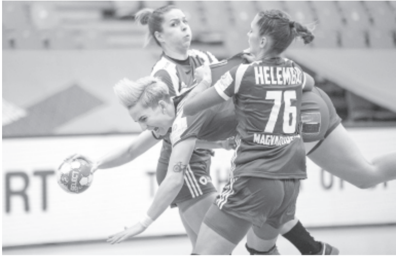
Nagy csatát hozott a magyar-román mérkőzés