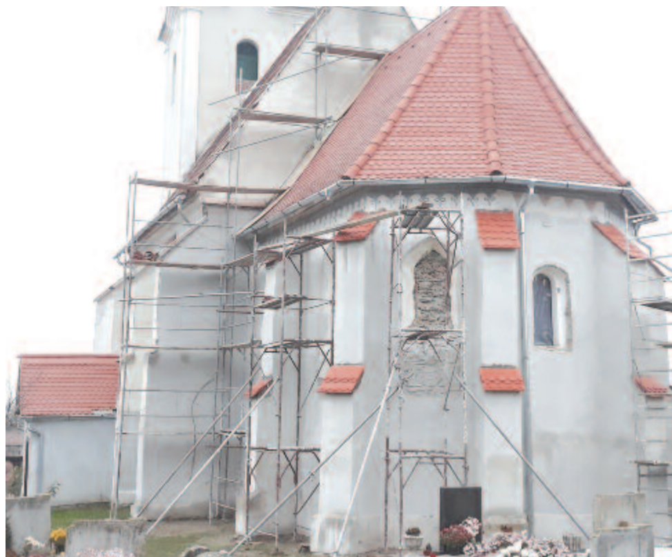
Nem remélt falminták és építészeti beavatkozások kerültek elő a vakolat vagy a mészrétegek alól