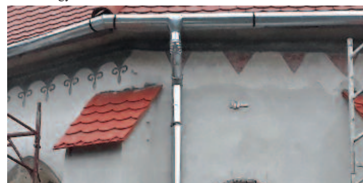
Liliomos és farkasfogas minta