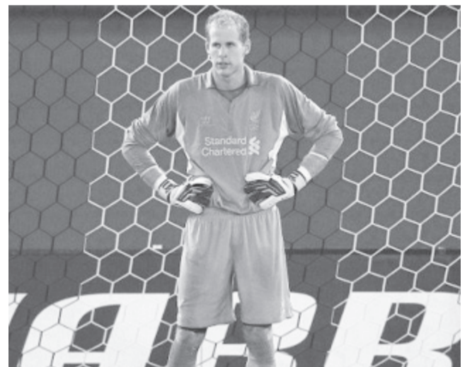
A magyar kapus az angol klub mezében: tétmeccsen egyszer sem kapott lehetőséget

A sorsolás slágerpárosítása az FC Barcelona és a Paris Saint-Germain összecsapása lett: a két csapat legemlékezetesebb párharcra a 2017-es negyedöntő, amelynek első felvonását 4-0-ra nyerték otthon a párizsiak, de a visszavágón a Barca 6-1-re diadalmaskodott. „Ennél jóval kedvezőbb sorsolást is kaphattunk volna. A katalán gárda az idei szezonban nem futballozik csúcsformában, ettől függetlenül elképesztően erős játékoskerettel rendelkezik, így bármikor képes meglepetést okozni” – fogalmazott az M1 aktuális csatornán Lőw Zsolt. Az idén döntős PSG másodedzője elismerte, még mindig beszédtema az öltözőben a 2017-es kiesés, úgyhogy a játékosokat biztosan fűti majd a visszavágás vágya.