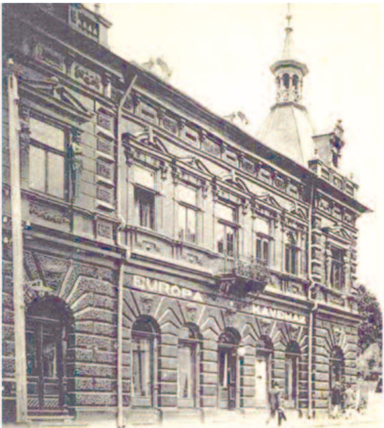
Marosvásárhely az Európa Kávéház 1904

Ady szavaival kezdtem írásomat, és az ő szavaival, pontosabban örök érvényű figyelmeztetésével zárom: „A Múlt egy nagy rejtelem, s a Jövendő is az, de a Múlthoz és a Jövendőhöz gyönyörű jogunk van, (... ) az az igaz ember, aki Múltat és Jövendőt egyformán szereti.” (Ady Endre: Életem nyitott könyve, 377. old.)