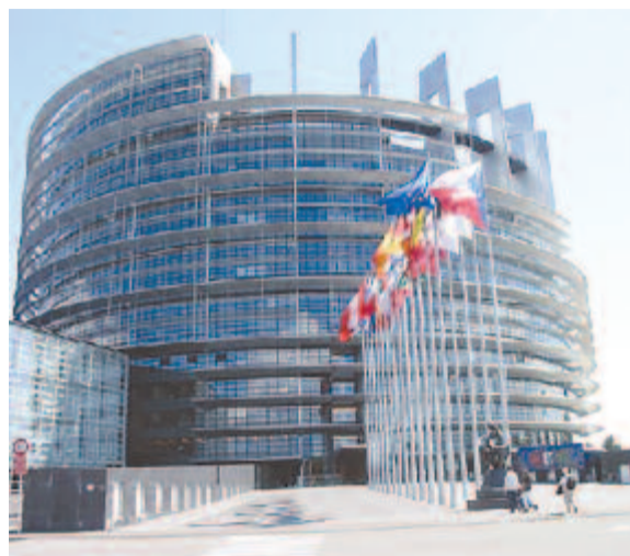
Az EP brüsszeli székhelye

A női jogok alapvető emberi jogok, szögezi le a Parlament, emlékeztetve arra, hogy az uniós intézményeket és a tagállamokat jogszabály kötelezi ezen jogok fenntartására és védelmére. A képviselők rámutatnak, hogy egyre több lengyel nőgyógyász lelkiismereti okokra hivatkozva akár a fogamzásgátló gyógyszerek felírását is megtagadja, vagy megakadályozza a nők hozzáférést a szülés előtti szüléshez. Évente több ezer lengyel nő kénytelen külföldre utazni olyan alapvető egészségügyi szolgáltatások igénybe vételéhez, mint a terhességmegszakítás, ezzel pedig további veszélynek teszik ki egészségüket és jólétüket.