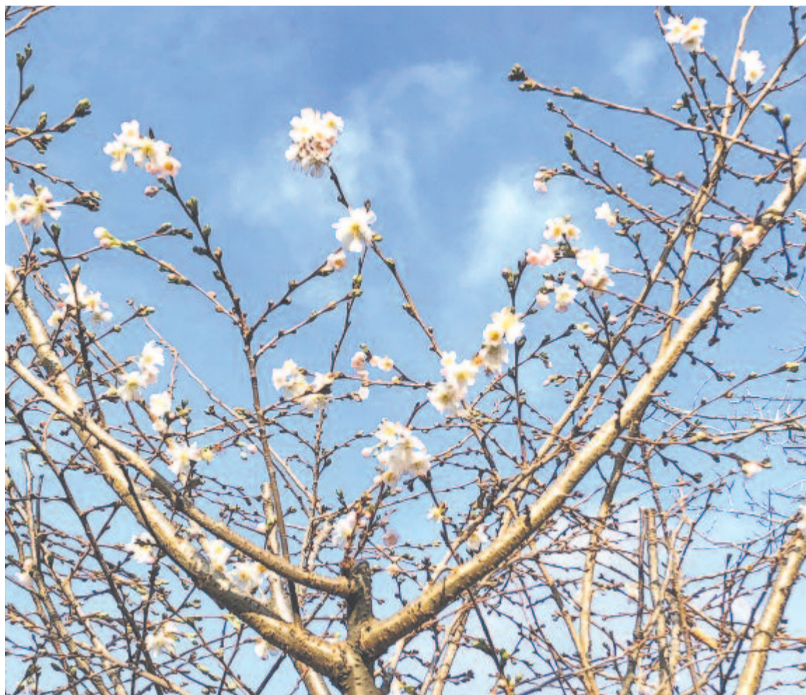
A park virágzásba csalt hormon(túl)kezelt díszcseresznyefája

– ezzel a képpel fejezi be Holdezüstös hársvirágok című versét az 1797-es esztendő