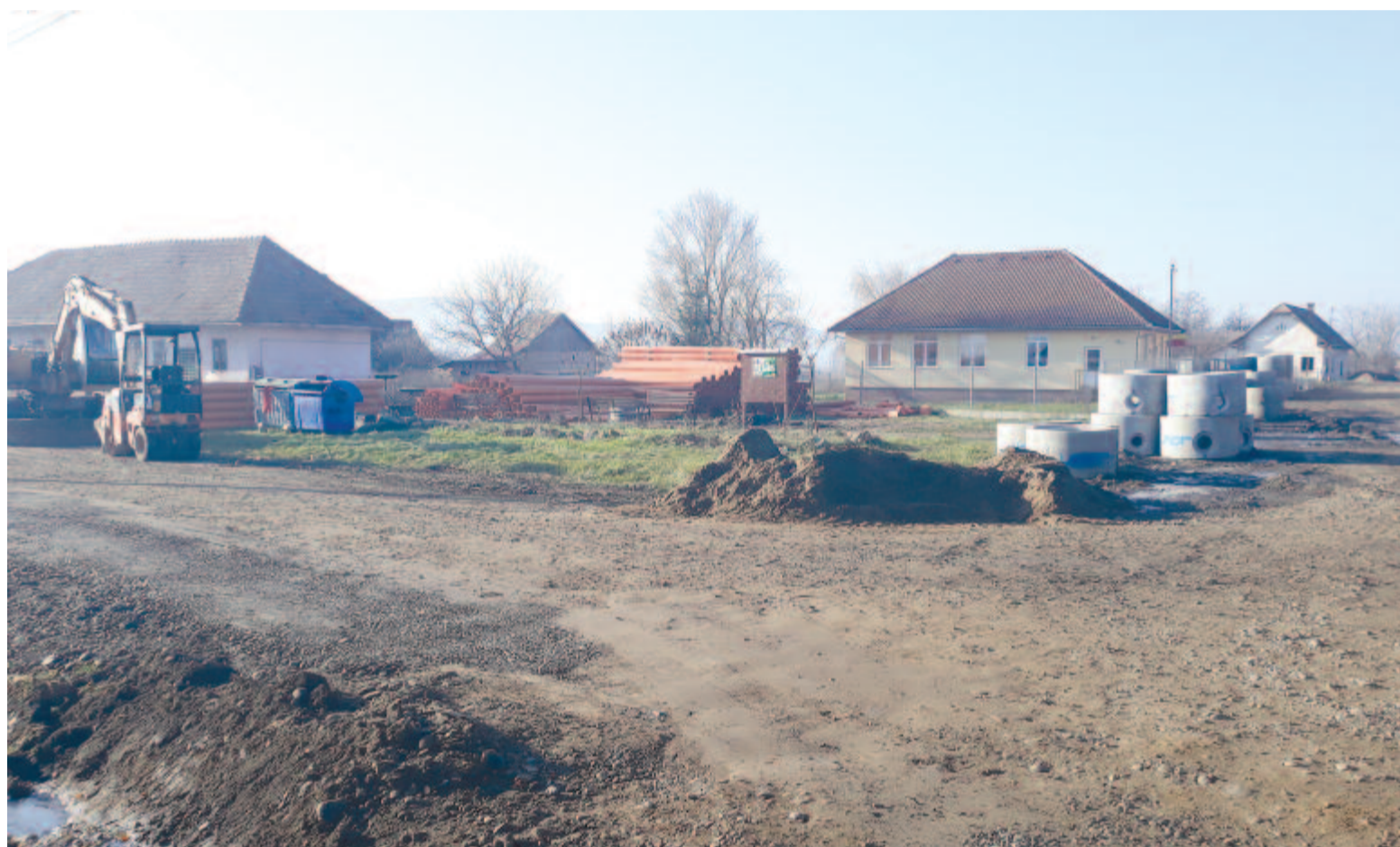
Az egyik legsürgősebb feladat az utcák aszfaltozása volna a csatornázás után