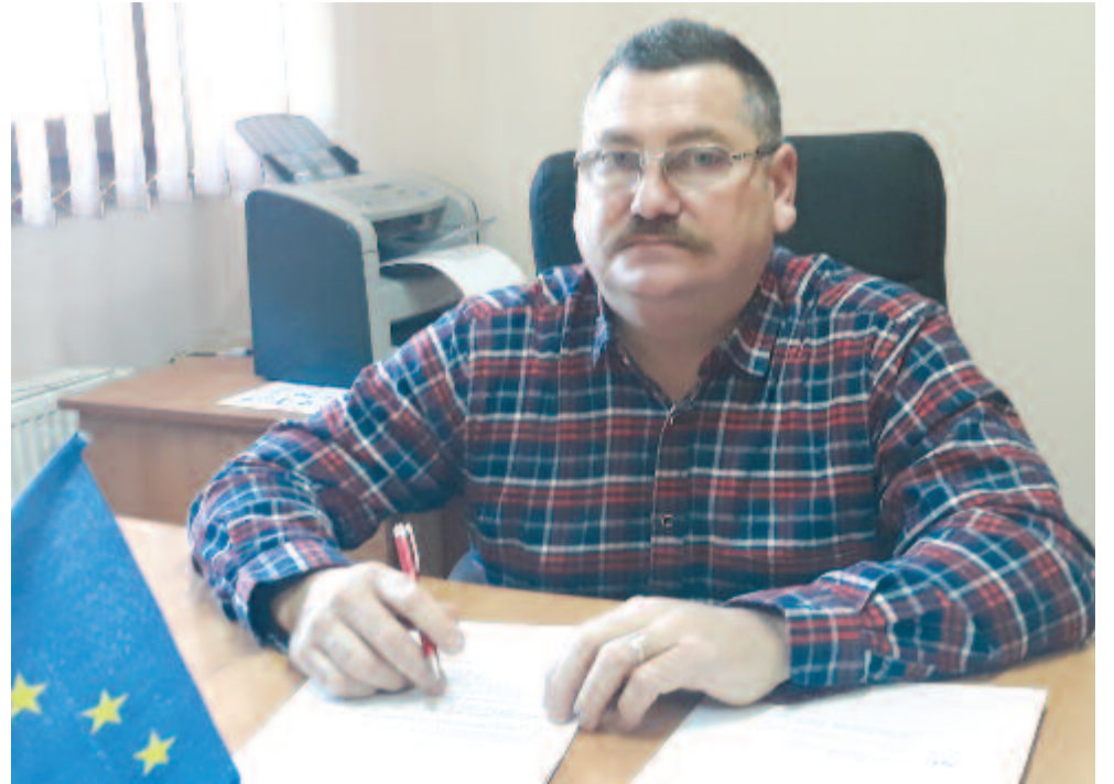
Nyolcévi önkormányzati tapasztalattal vette át a község vezetését

A településekre vezető bekötőutak mind egyike aszfaltozott, de a mellékutcák nyáron porosak, télen sárosak, ez a lakosok egyik fájó pontja, ezért az egyik legsürgősebb feladat a csatornázás után az aszfaltozás lesz.