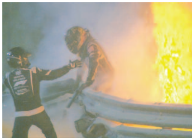
Romain Grosjean ijesztő balesetet szenvedett, de kisebb égési sérülésekkel megúszta a történeteket

Két Forma-1-es futamot is rendeztek az elmúlt két hétvégén Bahreinben: az elsőt az ország nagydíjért versenyeztek a csapatok, a másodikat Szahiri Nagydíjként írták ki.