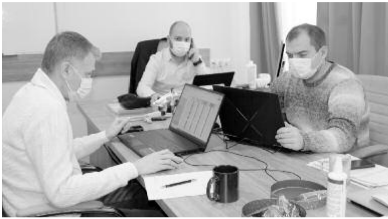
Eredményvárás az RMDSZ Maros megyei szervezetének székházában

– Az a tény, hogy a körülményekhez képest, az országosan alacsony választási részvétel ellenére a Maros megyei magyar közösség szép számban ment el szavazni, igazolja, hogy a választók megértették az összefogás üzenetét és azt is, hogy a szeptemberi önkormányzati siker csak akkor teljesebb lehet, ha Bukarestben is erős parlamenti képvisellel rendelkezik a megye. Ha olyan képviselők és szenátorok jutnak a parlamentbe, akik a Maros megyei ügyeket ismerik és felvállalják a képviseletüket, azért dolgoznak, hogy a megyeszékhely és a megye az elkövetkezendő négy évben fejlődjön. A választási eredmények tükrében az RMDSZ ismét a mérleg nyelve lehet a parlamentben, ami fontos a kormányalakításnál. Az RMDSZ nem kapott megkeresést erre vonatkozóan. Az erdélyi magyar kisebbség szempontjából kulcs-