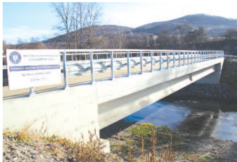
Az új vasbeton híd

Az országos beruházási társasághoz eljuttattuk a tervünket az összes utca aszfaltozására is. Kibéd ugyan egy faluból álló község, de rengeteg – szám szerint 43 – utcája van. Az említett pályázatba belefoglaltuk az összes utcát vízvezető árkokkal, az ingatlanokhoz vezető hidakkal egyetemben. Utóbbiakat a már leaszfaltozott utcákban is kialakítjuk, felújítjuk. Óriási projekt ez is, tízmillió lejnél, avagy kétfélmillió eurónál is többre fog kerülni a beruházás. Eddig a falu utcáinak – ha az úthálózat hosszúságát tekintjük – több mint egyharmadán van aszfalt. Az idén sikerült az egyik utcát önrészből leaszfaltozni, 640 méternyit toldottunk az eddig meglévő aszfaltcsíkhöz, egy előző projekt eredményéhez.