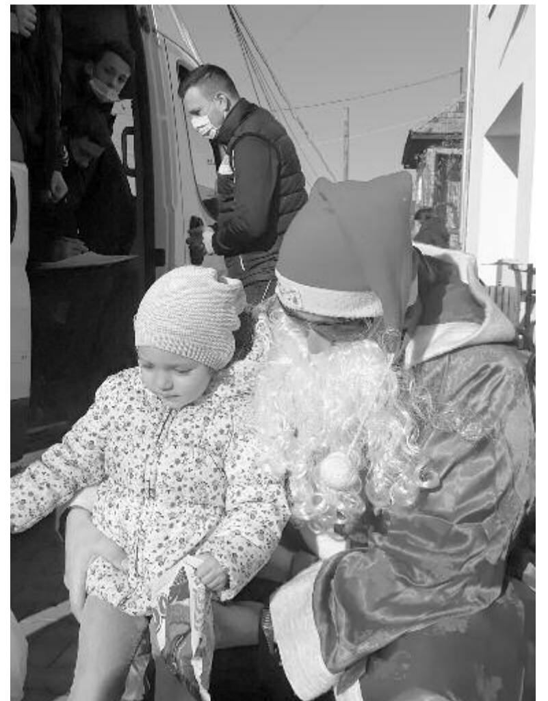
Nyárádszeredában meglepetten, nagy örömmel fogadták a gyerekek a kisbusszal érkező ajándékosztogatót

próbáljuk tenni. Gondolunk rátok, és áldott ünnepeket kívánunk ezekkel a csomagokkal!” – értesítette közösségi oldalán a szervezet a város lakóit, akiket arra kért: aki csomagot talált, egy fényképpel jelezze a szervező fiataloknak, hogy a kis ajándékok oda kerültek, ahová éppen kellett.