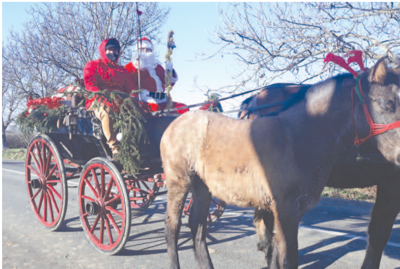
Nemcsak a legkisebbeknek volt meglepetés a Mikulás