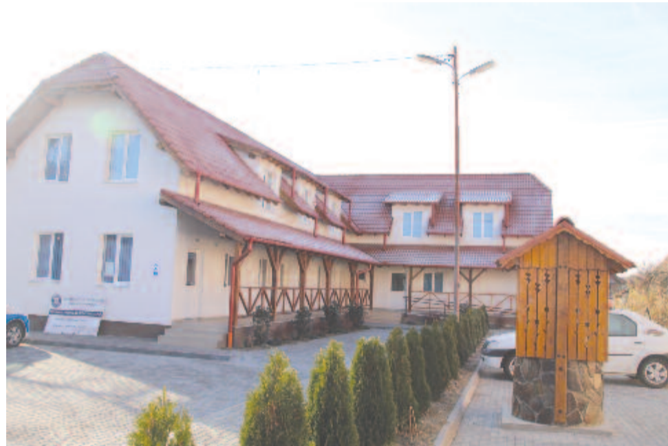
Az orvosi rendelő

Ugyancsak hasonló meggondolásból szeretnénk egy nagy sporttermet is építeni az iskola mellé. Van ugyan egy sportpályánk fedett lelátóval, öltözővel, de az elsősorban focira, bajnokságokra jó, és az iskolától távol esik. Az iskola udvarán adott a lehetőség. Az országos beruházási társasághoz (CNI) benyújtottuk már a teljes dokumentációval ellátott szándéknyilatkozatot és beruházási projektet. Fedett, fűtött, öltözővel, mosdóval ellátott teremről van szó. Elég szép látványtervekből lehet válogatni, már nem a régi fajta vasszerkezetű termekről van szó.