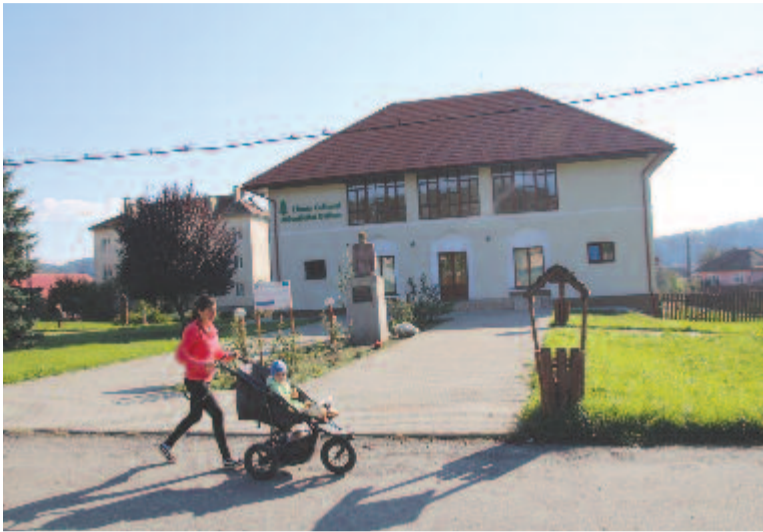
A felújított kultúrotthon

A csatornarendszer kibővítését tartom az egyik legfontosabb dolognak, amit még az aszfaltozás előtt