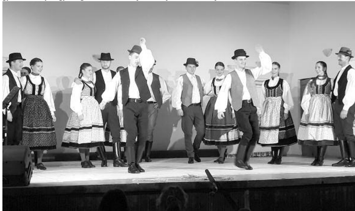
Őszi kultúrtáj címmel számos erdélyi településre vinnének kulturális műsorokat

E gyönyörű úrasztali terítő körül mi, református vártemplomi hívek ne szívünk mellé, hanem szívünk közepébe helyezzük templomunk szépségeit és Isten Igéjének megtartó igazságait.