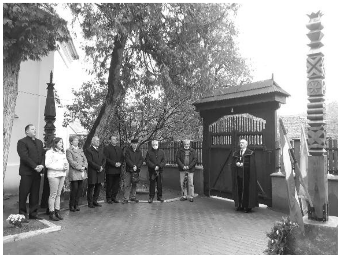
Az önálló százéves időszakra is emlékezett a gyülekezet a kopjafa felállításával