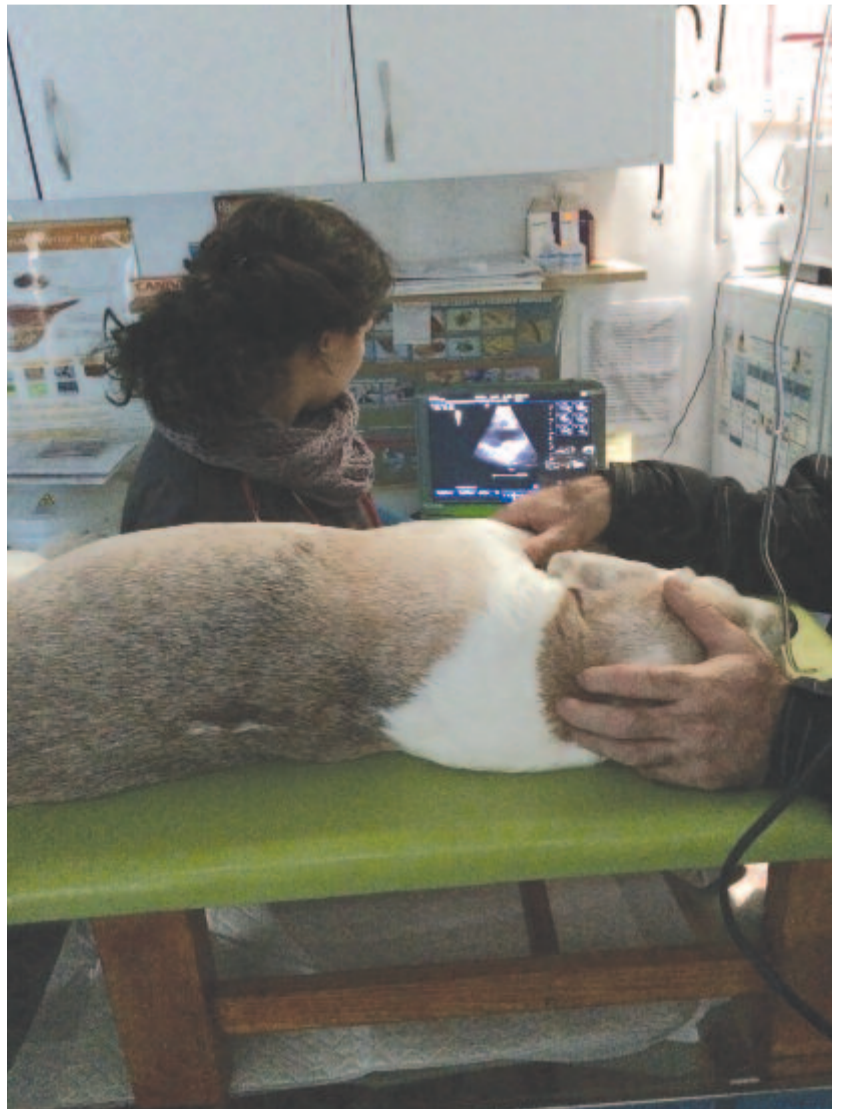
A szív ultrahangos vizsgálata

Az eltérő támadáspontú gyógyszerek javítják a vérkeringést, csökkentik az ödémaképződést a tüdőben és a test egyéb részein, fokozzák a szív összehúzódását, védik a szívet és a vérereket a káros hatásoktól. A szívelégtelenség terápia rendszerint több gyógyszer kombinációját foglalja magába, és minden esetben a kutya élete végéig tart.