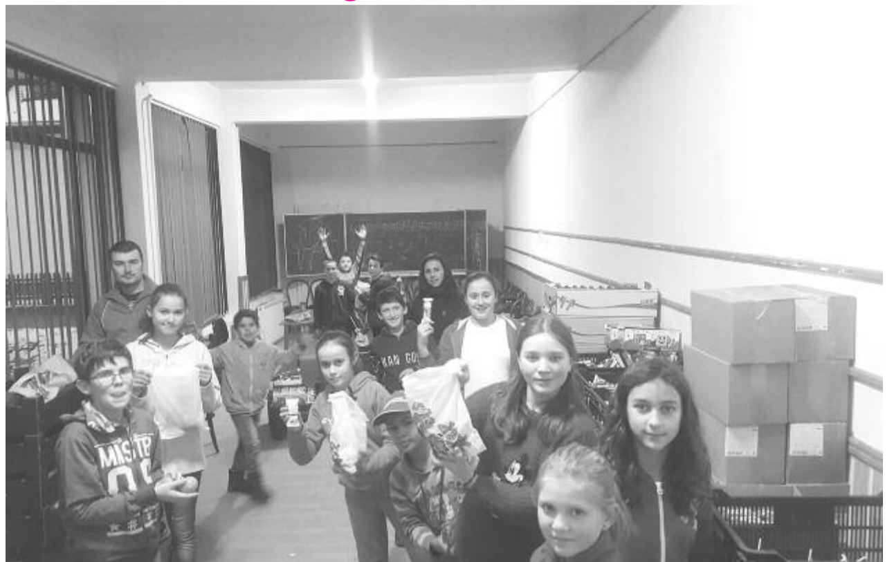
Az elmúlt években is bekapcsolódtak különböző jótékony programokba, ezúttal ők szerveznek adománygyűjtést