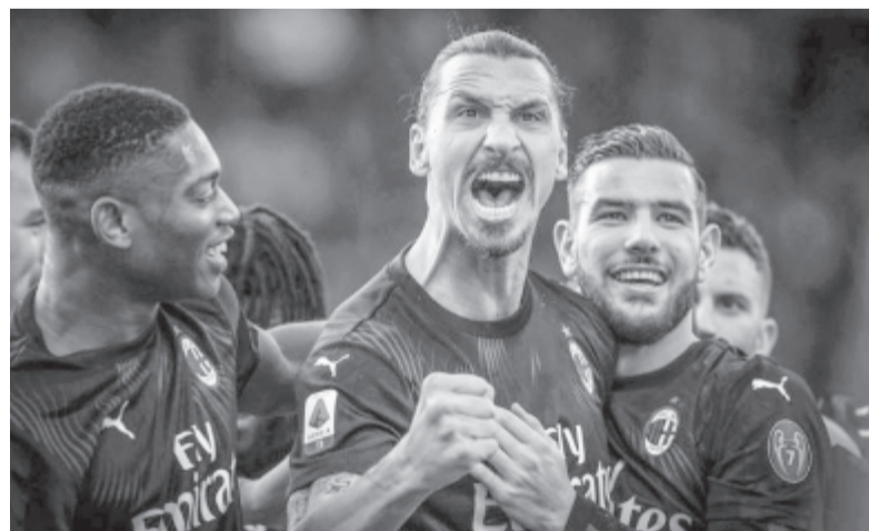
Két-három hétig nem állhat az olasz labdarúgó-bajnokságban listavezető AC Milan rendelkezésére a gárda svéd sztárja, Zlatan Ibrahimovic. A támadó a vasárnapi bajnokin combizom-sérülést szenvedett.

* Angol Premier Liga, 9. forduló: Aston Villa – Brighton & Hove Albion 1-2, Burnley – Crystal Palace 1-0, Fulham – Everton 2-3, Leeds United – Arsenal 0-0, Liverpool – Leicester 3-0, Manchester United – West Bromwich 1-0, Newcastle United – Chelsea 0-2, Sheffield United – West Ham United 0-1, Tottenham – Manchester City 2-0, Wolverhampton – Southampton 1-1. Az élcsoport: 1. Tottenham 20 pont (21-9), 2. Liverpool 20 (21-16), 3. Chelsea 18.