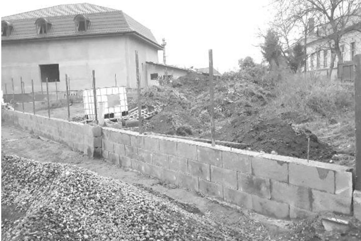
A kerítést építik, idén még a tereprendezés várható