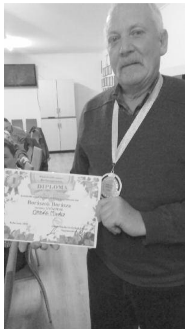
A verseny győztese

A döntőt Balavásáron tartottuk, ahol mindkét borlovagrend részéről az első öt helyezett vett részt. A verseny szabályzata szerint csak küküllőmenti és kizárólag fehérborral, de csak tavalyi vagy annál régebbivel lehetett részt venni. Az előző versenyektől eltérően egyetlen bormintával lehetett benevezni, így mindenki valószínűleg a legjobb borát vitte, ugyanakkor újdonság, hogy a versenyen részt vevők közül mindenkinek kóstolni kellett és bírálni is, így alakult ki a végeredmény. Érdekességként említhetem meg, hogy előfordult olyan eset is, amikor a bíráló nem ismerte fel a saját borának az ízét, ami gyakran