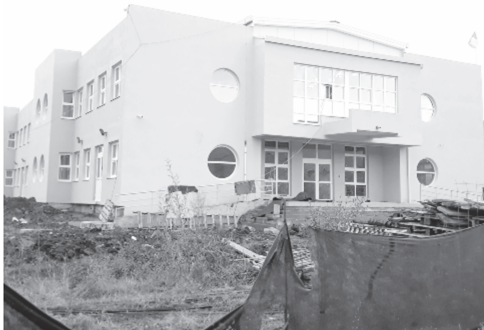
Szováta hamarosan új óvodát adnak át

Infrastrukturális téren zajlanak a megkezdett beruházások, az utcák járőfelületének korszerűsítése, ugyanakkor óriási tervek is dolgoznak, az elmaradt és tönkrement víz- és szennyvízhálózat kiépítését, korszerűsítését tervezik, remélik, hogy erre is támogatást nyernek. Átadás előtti munkák is vannak, például az óvoda. Sok beruházást illetően a szerződés kötésre várnak a városban és a fürdőtelepen, folyik a versenytárgyalás az amfiteátrum építójének kiválasztására, az Aquapark terve be van nyújtva, de még nem