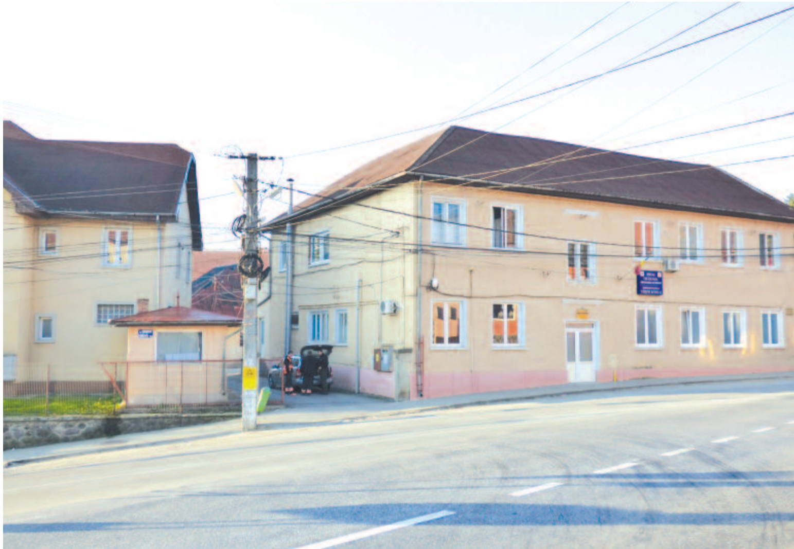
Erdőszentgyörgyön elkezdődik a kórház korszerűsítése, a szolgáltatások fejlesztése