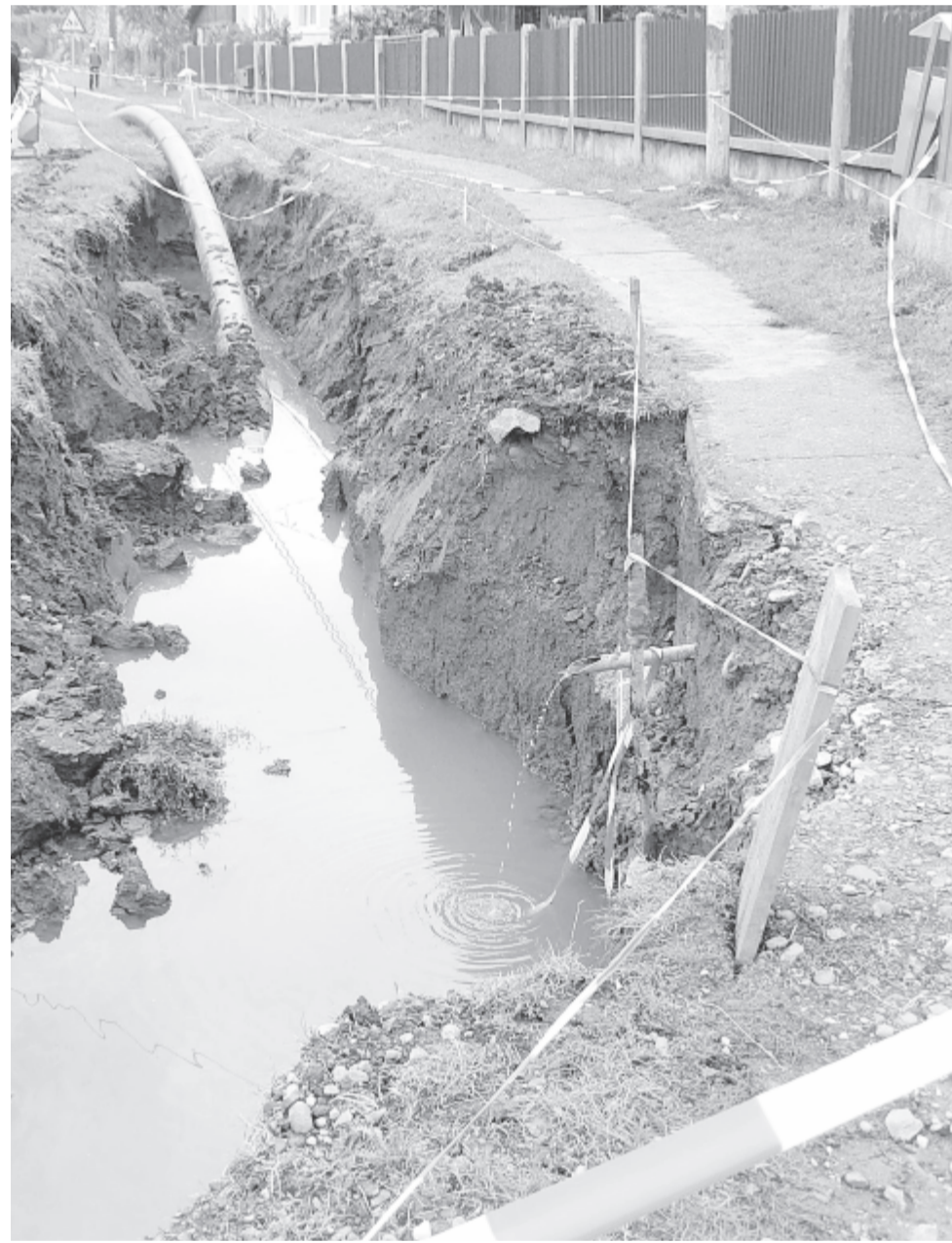
Mezőcsávás: a vezetékes infrastruktúra építésének befejezése a cél

nyert. Jó hír viszont, hogy hamarosan támogatási szerződést kötnek a városközpont rendezésére és az ötszáz fős kulturális központ megépítésére. Ezt már nagyon várja minden helybeli, nagy szükség van rá – sorolta a legnagyobb tervezett és várható beruházásokat a polgármester.