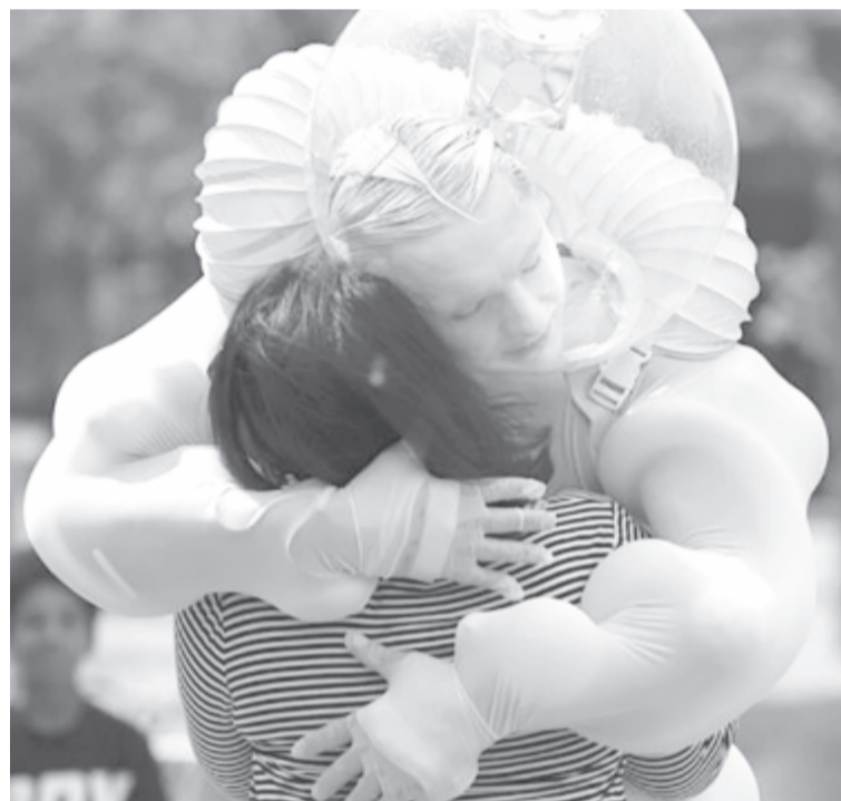
Ölelőcimborák (illusztráció)