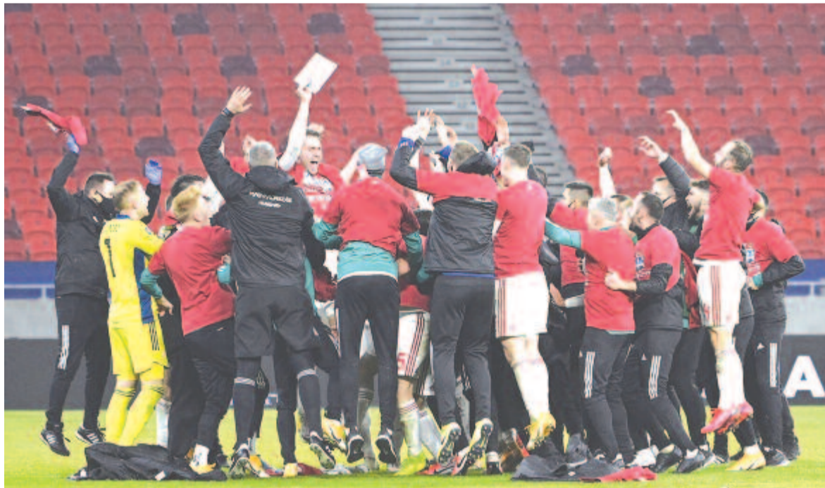
A magyar válogatott játékosai győzelmüket ünneplik a Puskás Aréna üres lelátói előtt