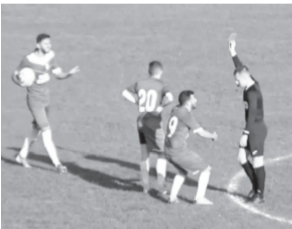
A vajdahunyadi mérkőzésen mindkét csapatból kiállítottak egy-egy játékost.

vezetősége, és az új nem kívánja támogatni a csapatot. Ha a helyzet sürgősen nem oldódik meg, Alsógárd visszaléphet a bajnokságból, írják az ottani lapok.