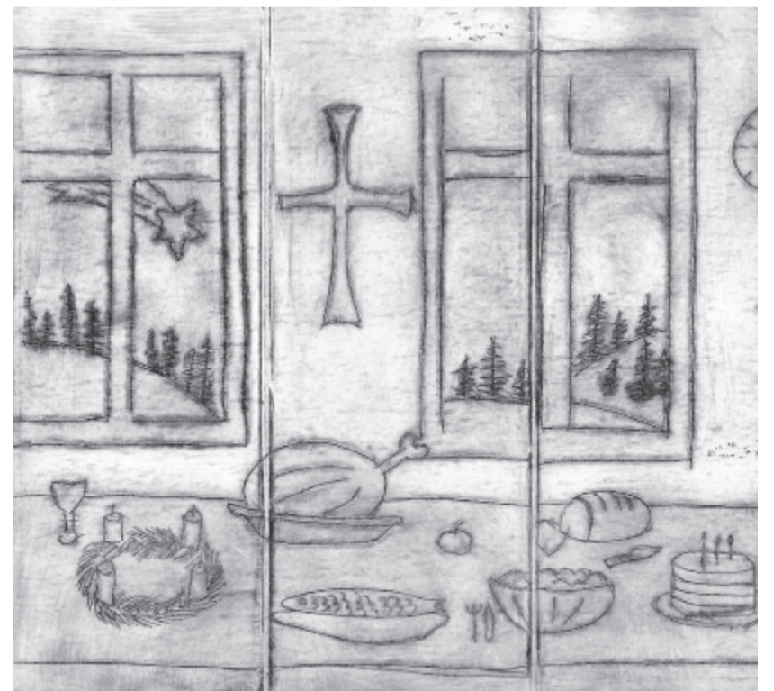
A tavalyi díjazott

https://hagyomanyokhaza.wixsite.com/rajzpalyazat2020