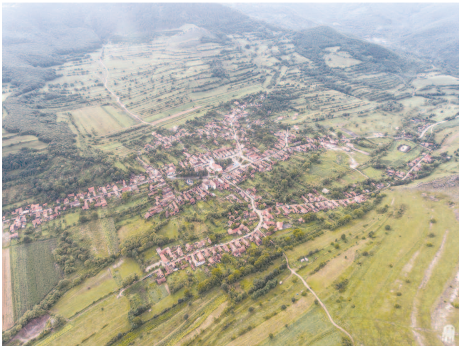
Torockó a magasból

– A turizmus nálunk csak mint szezon-turizmus van jelen, azaz május elejétől október végéig tart a szezon. Idén, a koronavírus-járvány miatt, nagyon megcsappant a turisták száma. Mivel Torockóra rengetegen szoktak jönni Magyarországról, ha az arányokat nézzük, a turisták körülbelül 70%-a, ezek a határzár miatt szinte egyáltalán nem jöhettek az idén. A legjobban azok érezték meg, akiknek akár 500 személy elszállásolására is van kapacitásuk és azok, akik egy nagy busznyi embert is el tudnak látni. Azoknak, akik külföldi