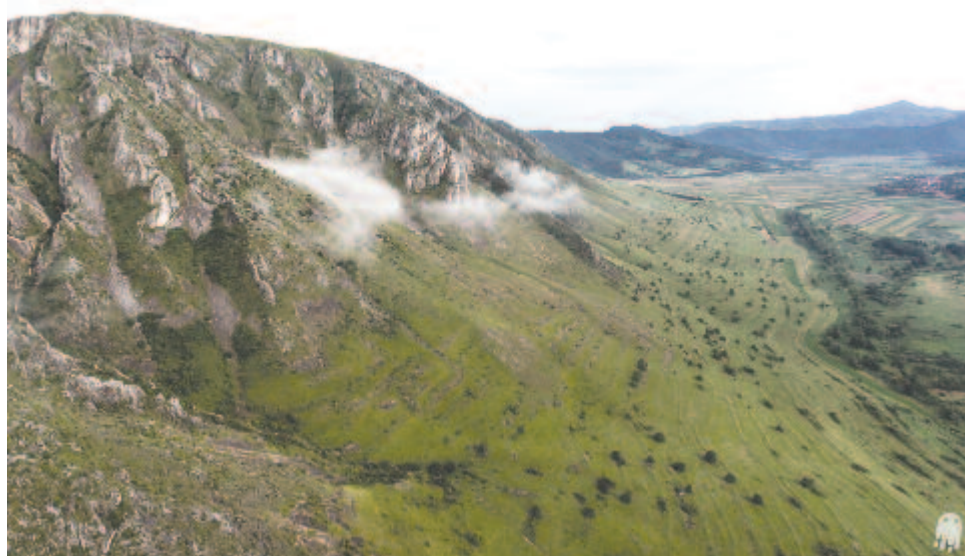
Ahol kétszer kel fel a nap

– Nem kimondottan csak egy rendezvényre gondolunk, amikor a turizmusról beszélünk, de valóban sokan szoktak jönni a fesztiválra. Azonban ezek többsége erdélyi fiatal, ők pedig nem töltenek több napot Torockón, amennyiben itt alszanak, a többségük a sátorábrót választja. Azt hiszem, a torockói turizmus nem köthető rendezvényhez.