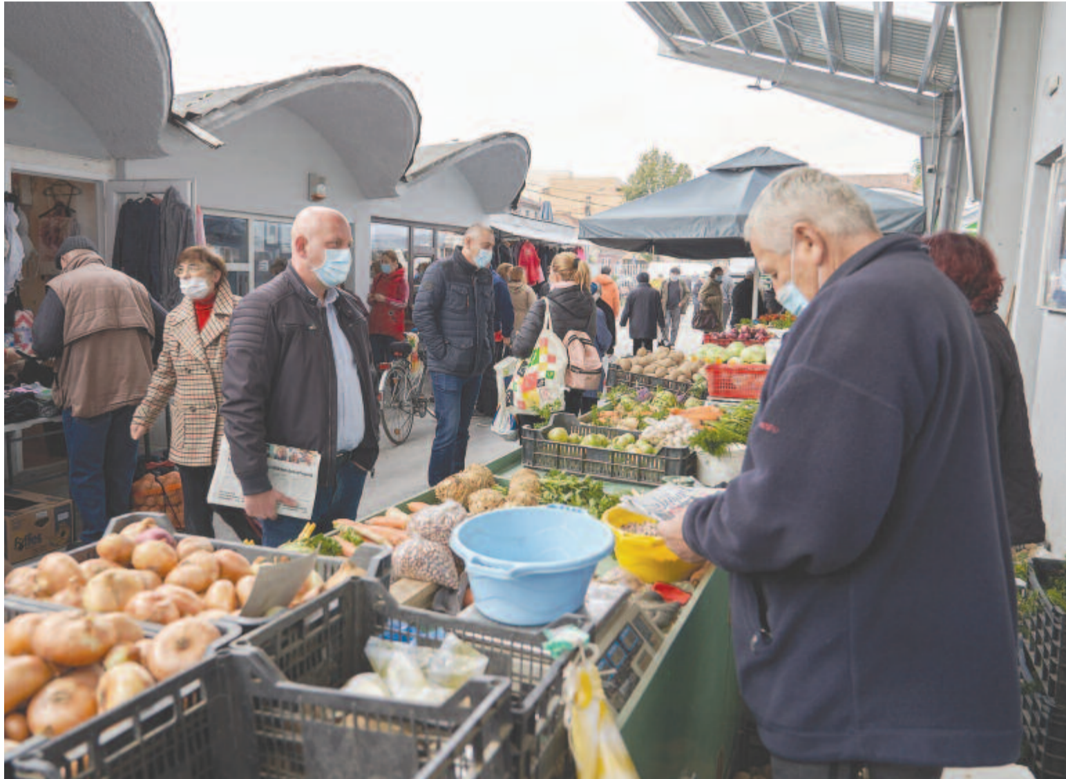
A járványügyi rendeletek betartása mellett a nyitott piacok ezután is működhetnek, ám még mindig kérdés, hogy mi lesz a többi termelő sorsa