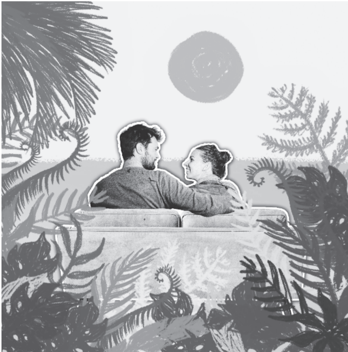
Lőrincz Viola alkotása

– Már alig várom a karácsonyt. Egyáltalán nem bánom, hogy ilyenféle alakul, remélem, így háttérbe szorul a vásárlás az emberekben, és előtérbe kerül mondjuk a család vagy a minőségi idő. Megajándékozhatnánk egymást közös zenehallgatással, készíthetnénk kézzel valamit a szeretteinknek, főzhetnénk egymásnak vagy együtt, meglephetnénk a párunkat egy jó dezzerttel, egy habos fürdővel. Remélem, a születémet lesz alkalmam meglátogatni, mert anélkül nem ünnepek a karácsony, de minden másról szívesen, könnyű szívvel és boldogan mondom le.