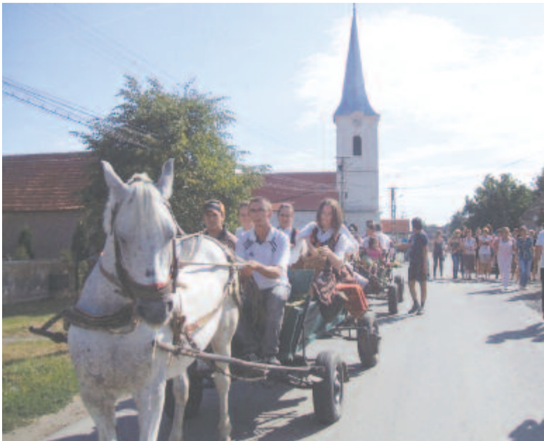
Elindult a menet. Népes közönség kíséri a csőszleányok szekereit (Csittszentiván, 2011)

Az ideai hiányérzetet enyhítendő, vessünk egy pillantást a szüret, szüreti mulatság és a szüreti bál hagyományvilágára és elmúlt évtizedekbeli alakulására a közelebbi erdélyi néprajzi tájaink személyes részvétellel végzett gyűjtés, dokumentálódás és kérdőíves felmérés alapján.