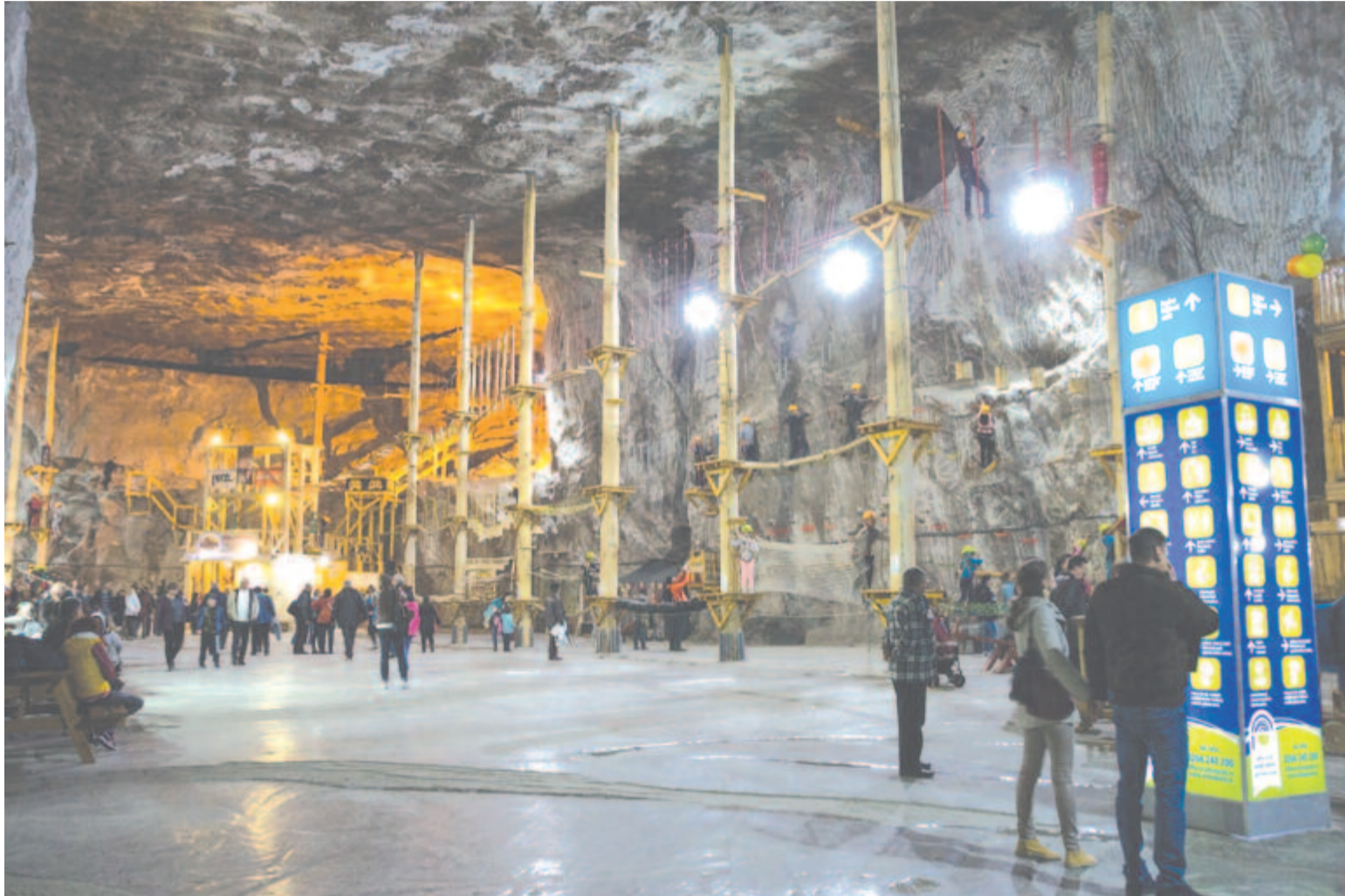
Kalandpark a sóbányában