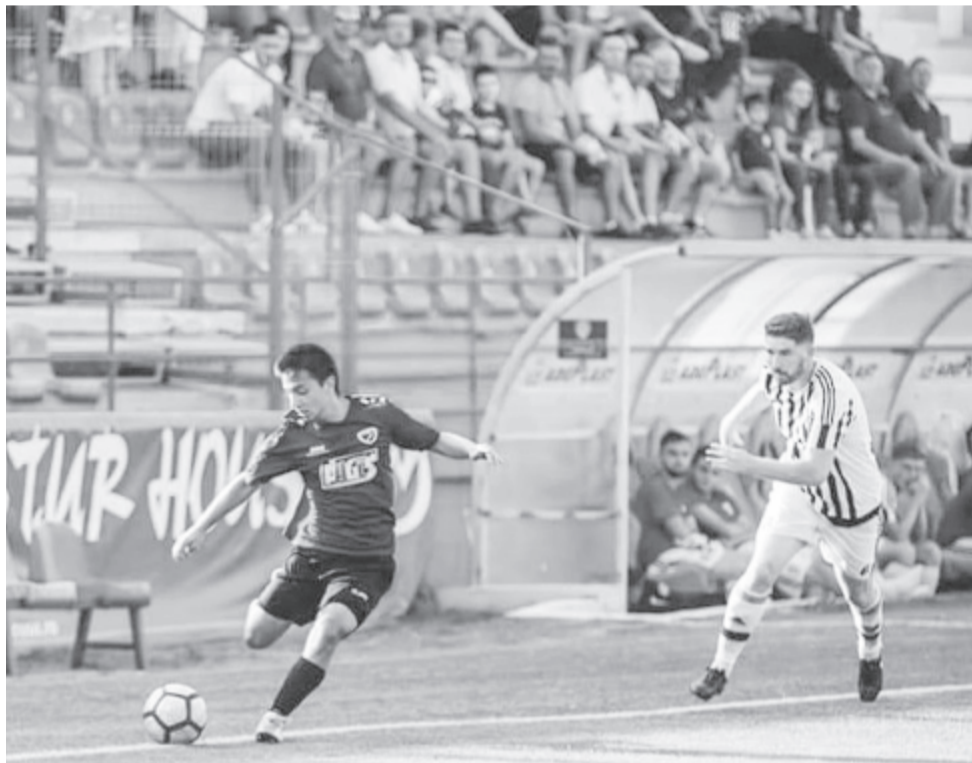
Az MSE játékosaként egy 3. ligás mérkőzésen a Tran-Sil stadionban

– Addig szeretnék focizni, amíg az egészségem megengedi, vagy ameddig a víkendlepi öregfiú-bajnokságba még beférek. Legfontosabb azonban a munkám, amely hivatásom és amelyet maximális odaadással gyakorlok. Nekem nem létezik lehetetlen, és telhetetlen vagyok – ez hajt előre. Amikor nehézségekbe ütközöm, mindig eszembe jut, hogy miért kezdtem el focizni, és hogy mennyit áldoztam a hobbimért, hogy ilyen szintre kerüljek. Tehát, ha elesek, mindig felállok, és még keményebben hajtok előre!