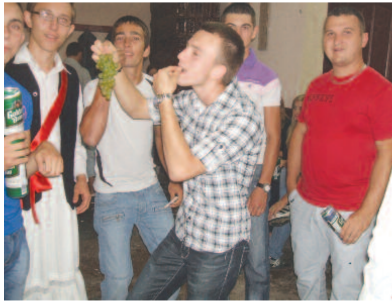
Neki sikerült a szőlőlopás (Csittszentiván, 2011)

mind szentivániak, a délutáni lovas-szekeres felvonulás (nem hiányozhatott ebből a farsangi alakok füstölő szekere sem), bálba hívogatás és utcai tánc, hivatalos nagykorúsítás és közösségi ünnep a templom előtt, a szülők öröme és segítsége, az éjjeli csősztánc és szőlőlopás a feldíszített báli teremben, a szentivániak mellett hetedhet falu fiataljainak közös, szép mulatsága.