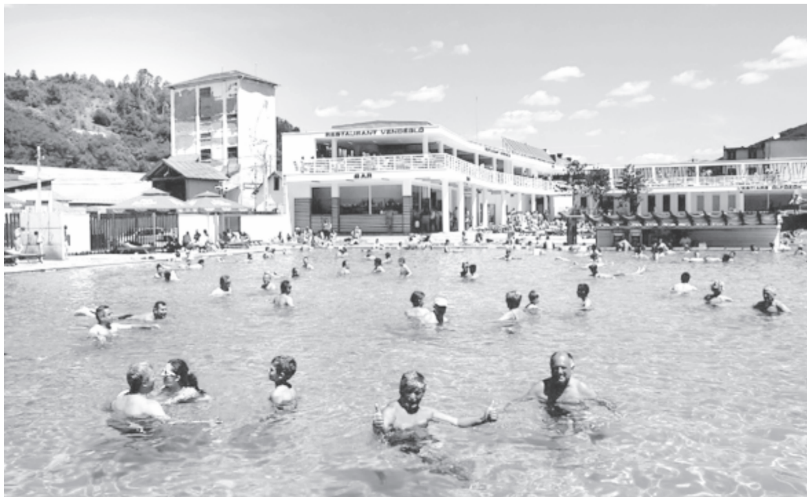
A paradji strand

– Úgy vélem, addig kiegyensúlyozódik valamelyest ez a helyzet, és az emberek valamelyest megtanulnak együtt élni a vírussal, hiszen rá vagyunk erre kényszerülve. Amennyiben pedig ez megtörténik, és nem félünk, nem pánikolunk, hanem tényleg betartjuk azokat a minimális szabályokat, hogy például a kezünket lefertőtlenítyük, odafigyelünk a távolságra, és hordjuk a maszkot, akkor remélhetőleg valamelyest fellendül a forgalom. Természetesen ez függ a politikától is, úgy látom, most a statisztikák is valamilyen szempontból úgy vannak formálva, hogy ne legyen előnyös mindenkinek, de ez csak az én véleményem.