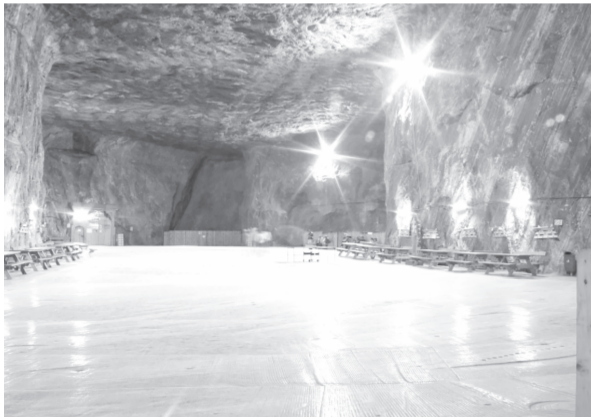
A paradji sóbánya

– Először is a bejáratnál minden látogató testhőmérsékletét megmértük. Az autóbuzson hordani kellett a maszkot mindaddig, ameddig le