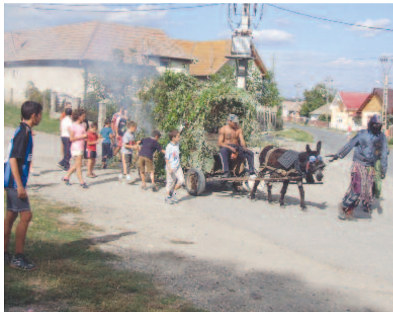
A farsangi alakok titokzatos szekere sem hiányozhatott (Csittszentiván, 2011)

székelységben, Marosszéken például a Felső-Nyárad menti falvakban, Nyáradremetén, Nyáradmagyaróson, Torboszlóban vagy a székely mezősi Panitban. Több tényező hatására az ezredforduló táján megromlott az a szabály, hogy csak a katonalegények lehetnek csőszök, és egy legény csak egyszer lehet csősz, szabadabbá vált a csőszleányok kiválasztása is. A sorkatonaság megszűnésével a