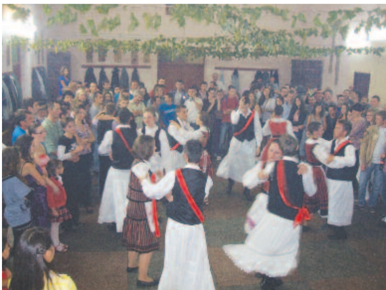
Csősztánc a báli teremben, éjfélkor (Csittszentiván, 2011)

Hasonló hagyománnyal találkozhatunk minden szőlőtermesztő vidékünkön. Kiegészülhetett azzal is, hogy a szüretelőket koszorút készítettek a legszebb szőlőfürtökből, és azzal vonultak a szőlősgazda házához. A szüret szokásrendje és ünnepe a szőlőhegyi és otthoni munka után is folytatódott még aznap vagy a szüreti hét végén a fiatalok (és bárki) táncos mulatságával. A szü-