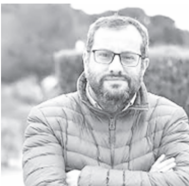
Ibán García del Blanco

Az Ibán García del Blanco (S&D, Spanyolország) által benyújtott jogalkotási kezdeményezés új szabályok megalkotására kéri fel az Európai Bizottságot annak érdekében, hogy a mesterséges intelligenciára, a robotikára és az egyéb kapcsolódó technológiákra (például szoftverekre, algoritmusokra és adatokra) épülő megoldások fej-