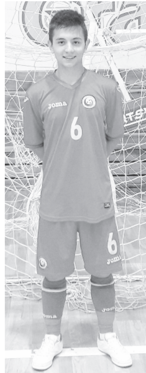
A román ifjúsági futsalválogatott mezében

– Igaz. Mindez a szüleimnek és a családomnak köszönhetően volt lehetséges, hiszen ők mindig mindenben támogatnak: anyai nagyapám volt az, akinek köszönhetően labdázni kezdtem, aztán a futballal párhuzamosan a tanulást sem hanyagoltam el édesanyámnak köszönhetően, ugyanakkor édesapám a legnagyobb drukkerem, akivel a mérkőzéseken egy általunk ismert füttyjellettel értekezünk. Jelenleg a saját magam ura vagyok, azt teszem, amit szeretek, de ma is eszembe jutnak szüleim tanácsai.