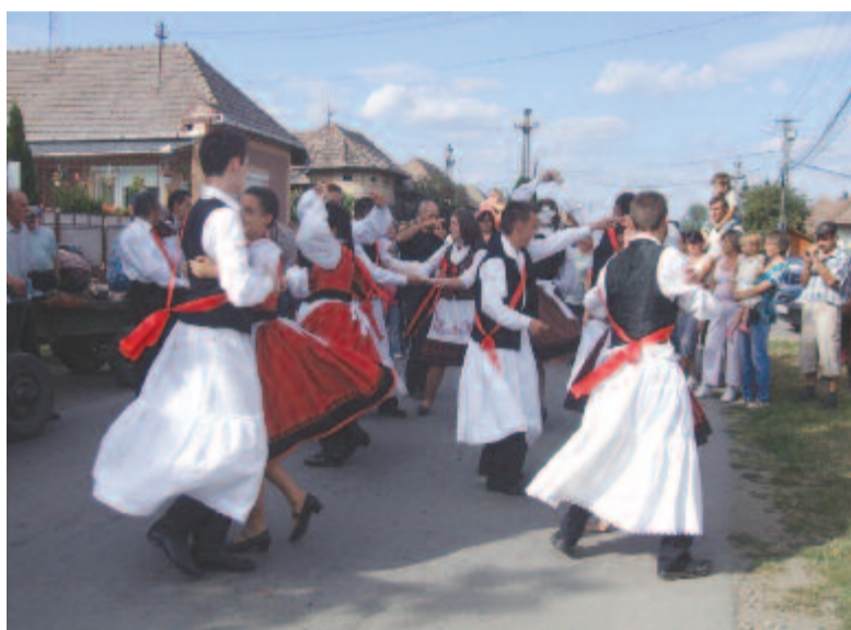
Csőszök hívogató tánca a főutcán (Csittszentiván, 2011)

Ilyen Marosvásárhely szomszédságában Csittszentiván. A 2011-es esztendő szüreti napján minden együtt volt: 6 pár 18 éves csőszlegény és leány, amint mondták, baráti társaság, jó táncosok, nem is