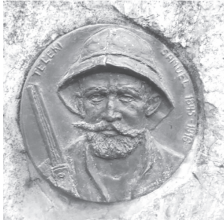
A róla elnevezett érem

Az út során háromezer kilométert tettek meg Afrika ismeretlen részén, gazdag állat-, növény- és néprajzi