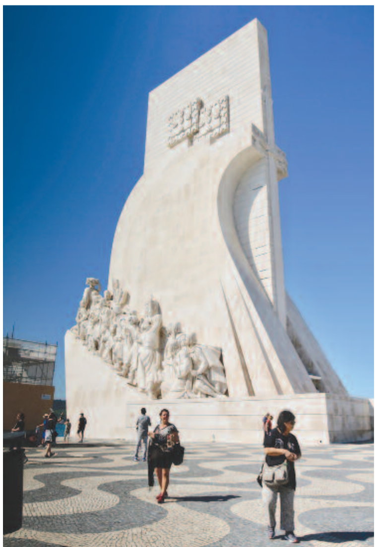
A Felfedezők emlékműve