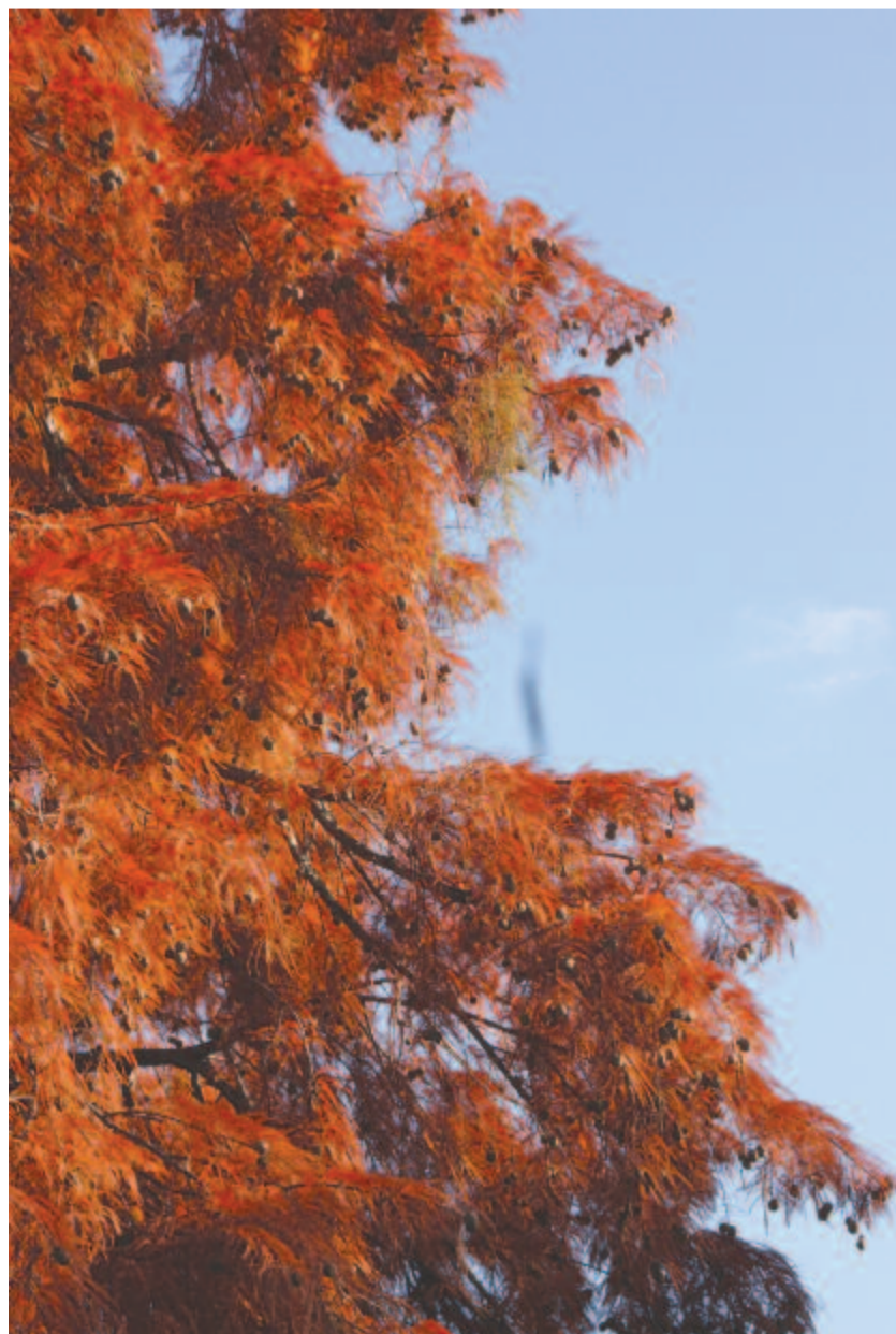
Lehajtja rőtaranynak fejét

„Némely álló Tsillagok, a' mellyek Tsudálatos vagy változó Tsillagoknak nevezetnek, bizonyos idő szakaszokba, bizonyos változást szenvednek az ő fényekben; úgy hogy most kisebb, majd nagyobb fényel tündökölnék; néha egy ideig egészen-is eltűnnek. .... Illyen van három a' Hattyúban; egy a' Tzethal nyakán, a' melly 11 Hónapok alatt, harmadik nagyságú Tsillagból egészen elenyészik egy ideig” – írja az 1804-