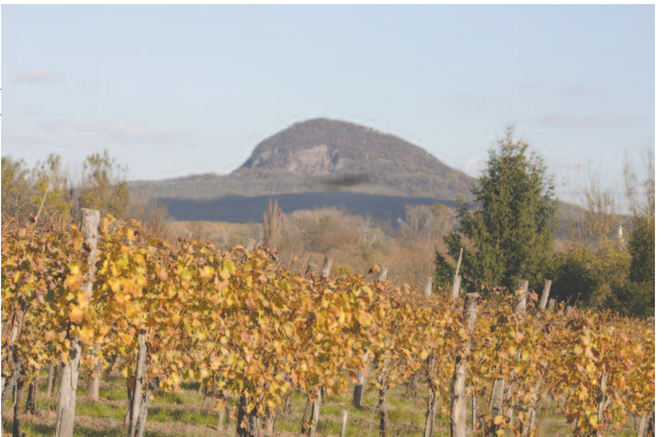
Sárgul a hegy

ben Komáromban megjelent A föld matematikai leírása a világ alkotmányával együtt című művében a Szatmáron 1764. október 9-én született Katona Mihály református lelkész, nemzetközi elismertségű földrajztudós, a kort foglalkoztató csillagászati kérdések legjelentősebb magyar szakértője.