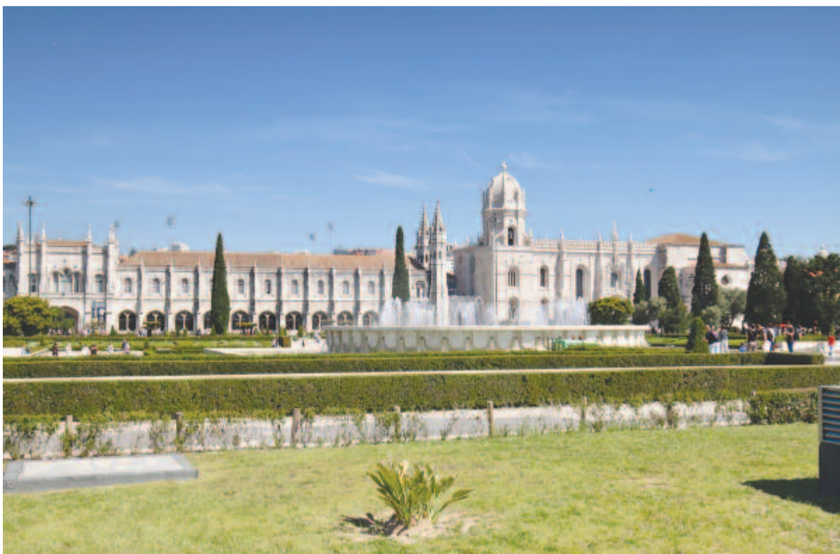
A Szt. Jeromos-kolostor