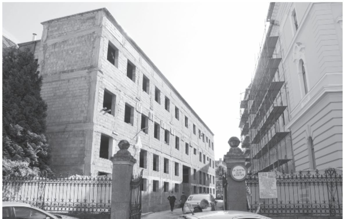
Késnek a bíróság épületének bővítési munkálataival