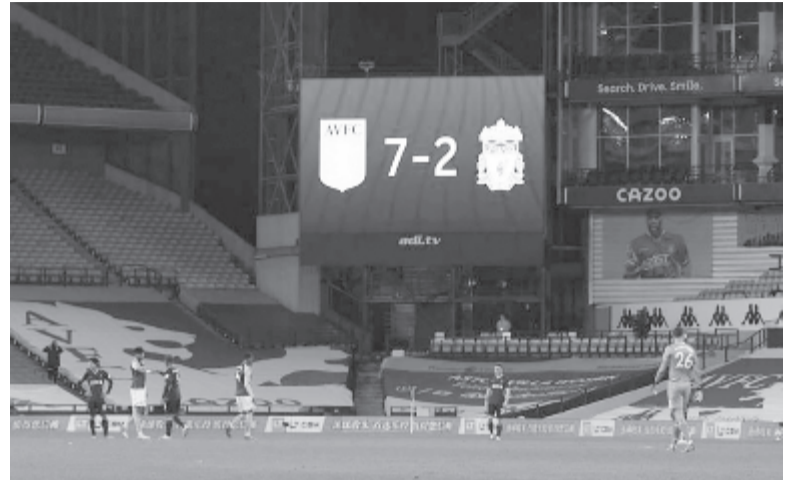
Kép az albumba: hihetetlen Aston Villa-siker a Liverpool ellen. Ehhez fogható diadal csak a Tottenhamé, amely otthonában alázta meg a Manchester Unitedet.

Angol Premier Liga, 4. forduló: Arsenal – Sheffield United 2-1, Aston Villa – Liverpool 7-2, Chelsea – Crystal Palace 4-0, Everton – Brighton & Hove Albion 4-2, Leeds United – Manchester City 1-1, Leicester – West Ham United 0-3, Manchester United – Tottenham 1-6, Newcastle United – Burnley 3-1, Southampton – West Bromwich 2-0, Wolverhampton – Fulham 1-0. Az élcsoport: 1. Everton 12 pont, 2. Aston Villa 9 (11-2), 3. Leicester 9 (12-7).