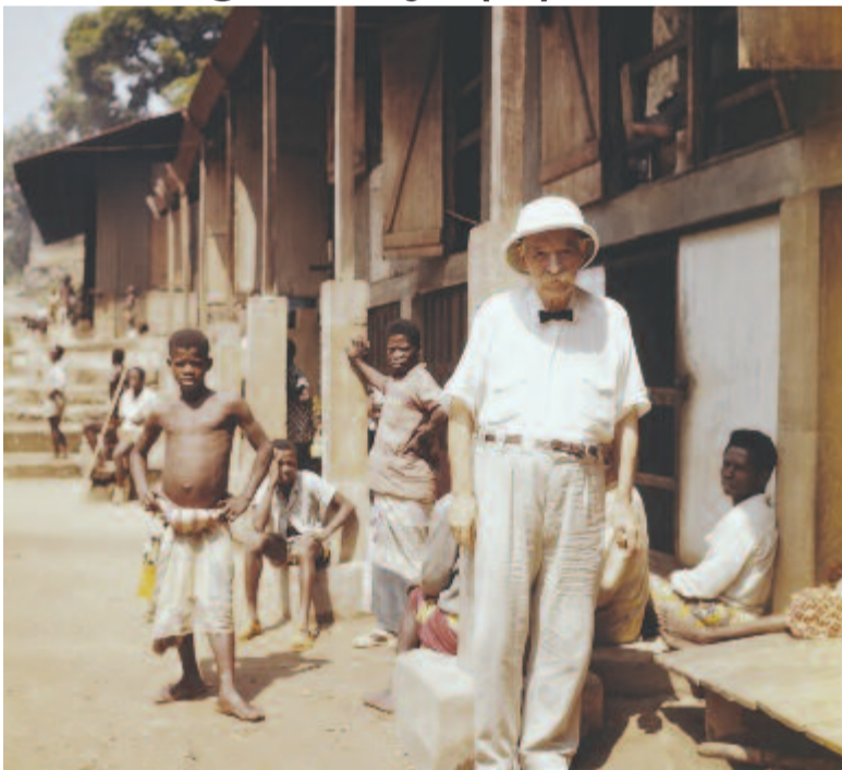
A doktor és betegei

Bár otthon is gyógyított, Albert Schweitzer nem feledte az afrikai bennszülöttek tekintetét. Ez az emlék nemhogy kopott volna, hanem mind erősebben és erősebben szólította: vissza kell térnie Afrikába. 1924 februárjában ismét hajóra szállt. A hajón azonnal gyanút keltett, mert négyzsáknyi megválaszolatlan levelet vitt magával, melyet a tengeren szándékozott válaszra méltatni. Az egyik tengerész „meg volt róla győződve, hogy bankjegyeket rejtegetek leveleim között. Ezért aztán másfél óra hosz-