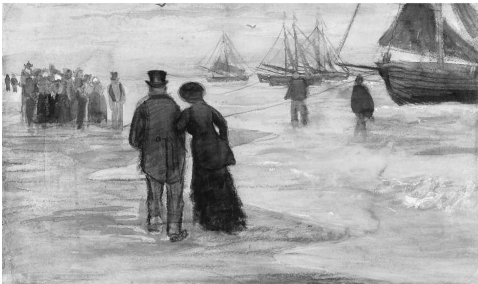
Vincent van Gogh: Scheveningen partján