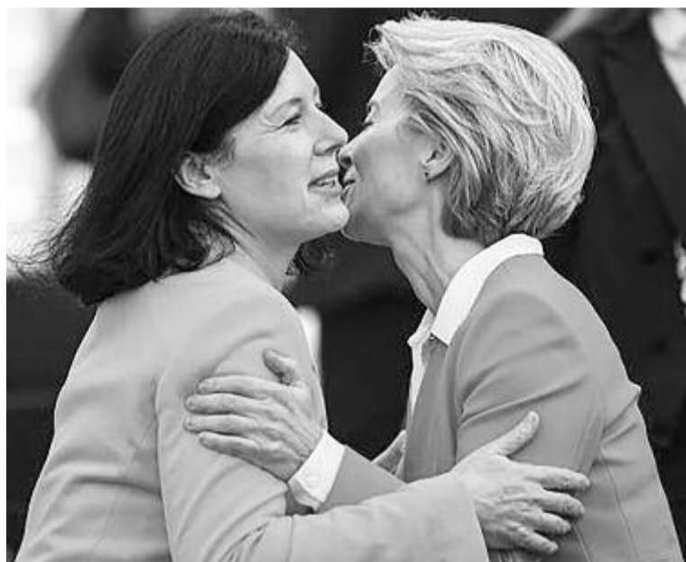
Jourová Von der Leyen teljes bizalmát élvez

A fájdalom gyepője kiesett a keziből, s érezte, hogy nyomorékká vált, mint akinek egyik lábát levágták. Az asszony pedig csak nézte, nézte sokáig, rájövén, hogy ilyen szármalasan nem tudta már gyűlölni a fiút. Tovább éltek hát ketten csendben, mint anyja az apjával, s ősanái ősapáival. Mert a körték és almák és a szilva nyüvesen hull a fákról.