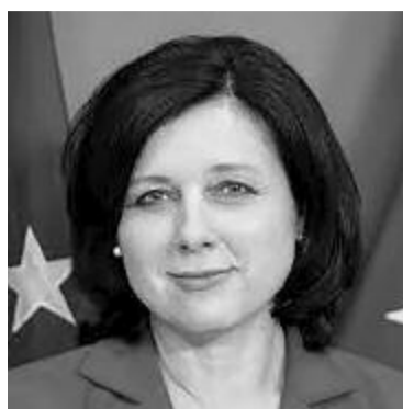
Vera Jourová tőségét Vera Jourová bizottsági alelnök és Magyarország között.

Hozzátette: e kijelentések ellenléte a Bizottság Lisszaboni Szerződésben deklarált semleges és objektív intézményi szerepével; a nyilatkozat semmibe veszi a lojális együttműködés alapelvét, és kizárja az értelmes párbeszéd lehe-