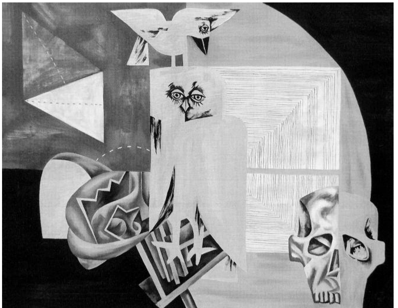
Sipos László: Elmúlás

114 éve született a költő, újságíró, lapszerkesztő.