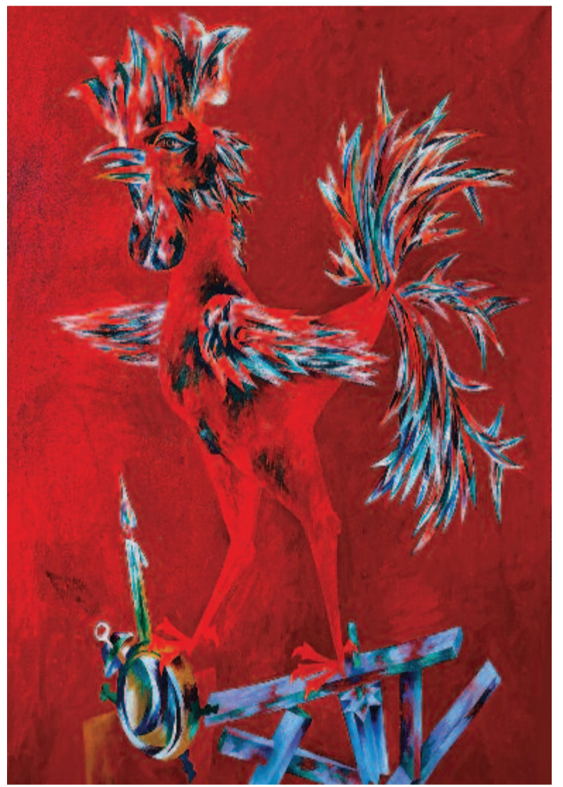
Sipos László: Tisztelet az 1956-os forradalom hőseinek