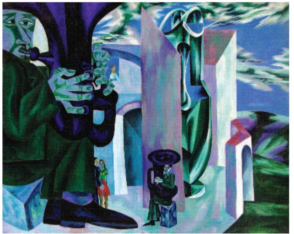
Sipos László: Trombitások városában

Jelen kiállítás egy szűkebb válogatást nyújt az alkotó egyben tartott és jól átlátható életművéből, kiragadva a legfontosabb témákat és a fő műveknek számító alkotásokat. Ugyanakkor bemutat néhány fiatalkori munkát is, amelyek az újdonság erejével hatnak, és betekintést enged a festő munkamódszerébe. A kiállítás főbb tematikai egységei: a vallási és népművészeti ihletésű fő művek, a zenével kapcsolatos alkotások, valamint az erdélyi és egyetemes magyar kultúra nagy alakjai előtt tisztelgő festmények – írják az alkotóról és tárlatáról a szervezők. A kiállítás kurátorai: Szebeni Zsuzsanna (Magyar Kulturális Intézet, Sepsiszentgyörgy) és Bordás Beáta (Kolozsvári Művészeti Múzeum). (Knb.)