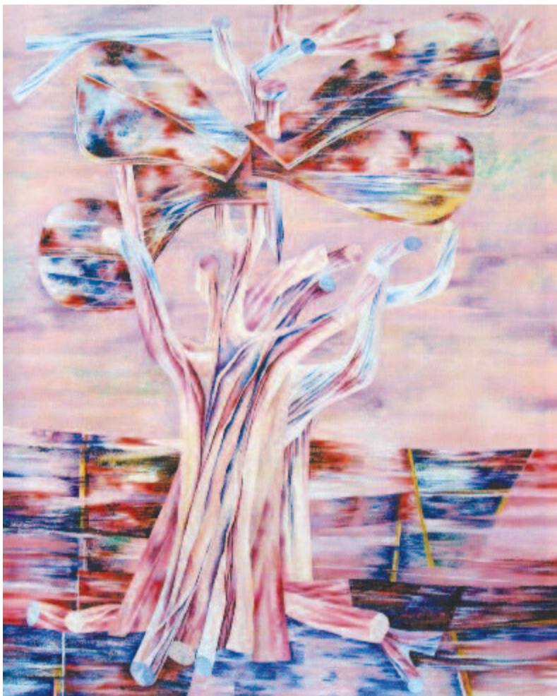
Sipos László: Vasfa üveghegyen