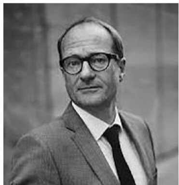
Ben Weyts flamand oktatási miniszter

Több millió szülő ismerkedett meg idén kényszerűségből az otthonoktatással Európában. Közülük sokan folytatnák ezt a rugalmas tanulási módszert. Szakemberek szerint azonban a gyerekek az iskolában kapják a legjobb oktatást.