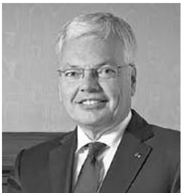
Didier Reynders biztos

A felszólalók kiemelték, hogy a nem uniós polgároknak megfelelő ellenőrzés és átláthatóság nélkül uniós állampolgárságot adó rendszerek káros hatásai más tagállamokban is jelentkeznek, ezzel