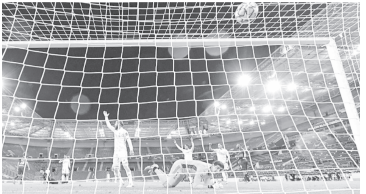
A Real Madrid kétfólos hátrányt kellett ledolgozzon a hajrában

A D csoportban a Liverpool kényelmesen verte a vendég Midtjylland együttesét, míg az Atalanta nagyon megszenvedett az Ajaxszal. A hollandok a szünetre kétfólos előnybe kerültek, de a fordulás után az olaszok összeszedték magukat, és Duván Zapata hat perc alatt szerzett két góljával döntetlenre mentették a találkozót.