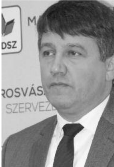
dr. Vass Levente

– Az elmúlt négy évben a szenátusban és a képviselőházban folytatott egészségügyi szakbizottsági munka során hét olyan törvényt írtam, amelyek egy valós problémának a pontos megoldására vonatkoznak. Nagy elégtétel, hogy valamennyi átment mindkét ház egészségügyi bizottságán és plénumán is.