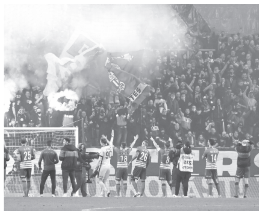
Ferencvárosi játékosok és szurkolók

A sportvezető megjegyezte, szerdán, a Dinamo Kijev ellen sem feltett kézzel megy ki a pályára az együttes, amely az ukránokat is meglepheti úgy, mint ahogyan tette azt a Barcelonával a mérkőzés egyes szakaszaiban.