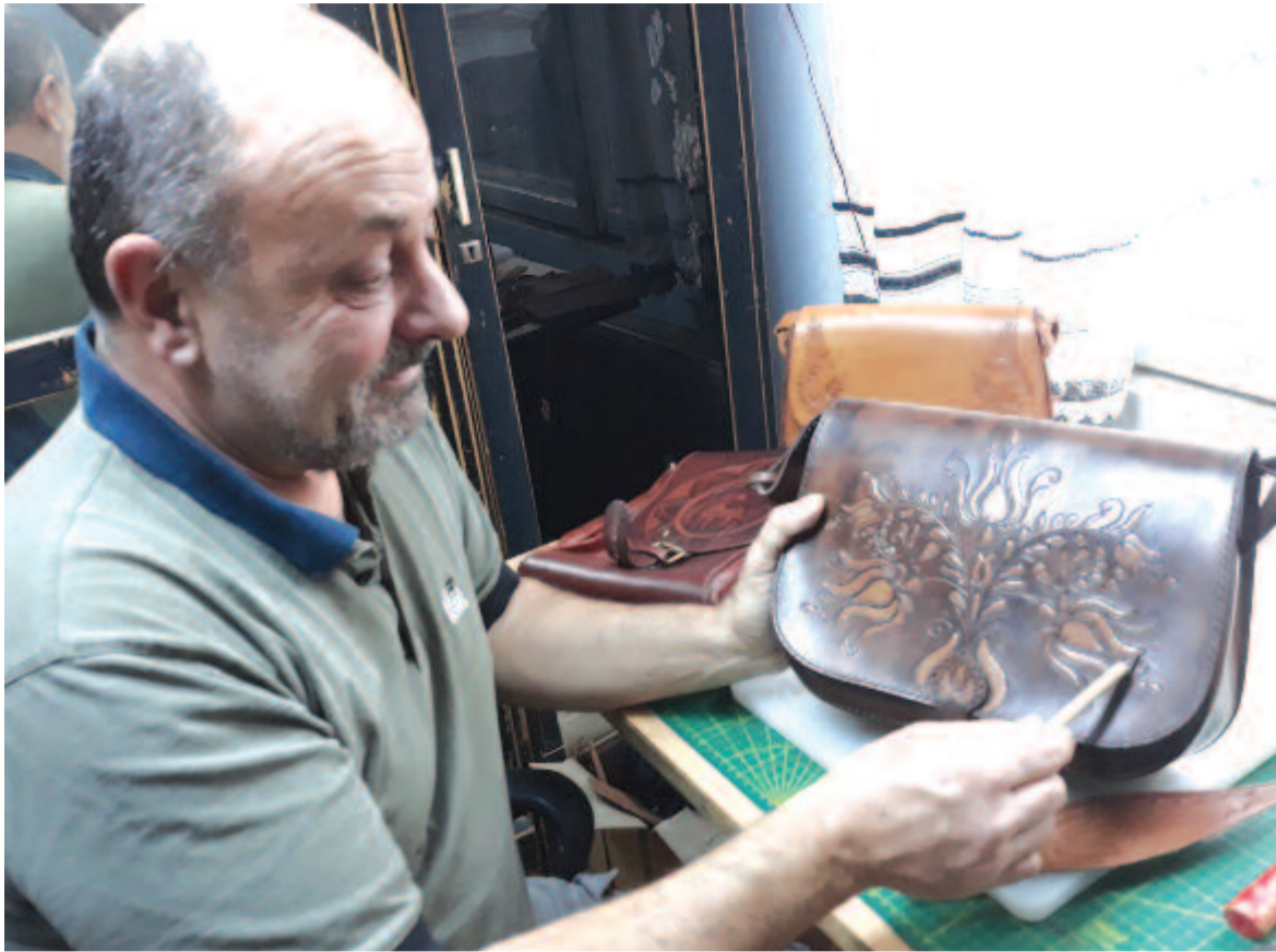
Egyedi mintákat kalapál a kemény bőrfelületre, de a vásárló elképzeléseit is formába önti