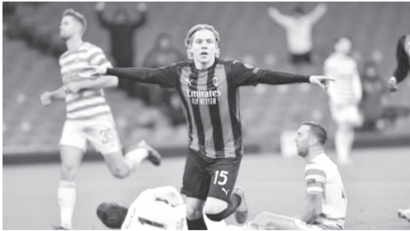
A milánói gárda június közepe óta veretlen, ezúttal Glasgow-ban győzött