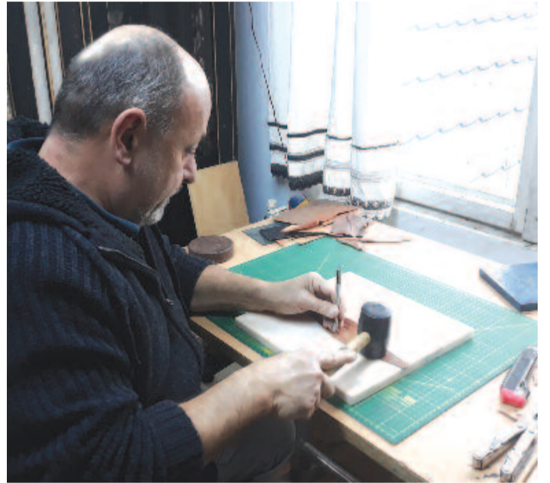
Minden bőrdarabot kézzel munkál meg

A családban mindenki kézműveskedik Teljesen kézműves, de akár éppen művészcsaládnak is nevezhetjük Németéket, és méltán: felesége ugyanis művészeti középiskolában tanult, nagyon szeret rajzolni, éveken ezelőtt üveg- és porcelántárgyak festésébe kezdett, ma pedig egyre inkább az ökoprint felé fordul, azaz selyemsálakat növényi alapanyagokkal mintáz, fest, ebben talált kibontakozási lehetőséget. Lányuk nemrég kezdte a főiskolát, ő is nagyon szeret rajzolni, akár az édesanyja; még éveken ezelőtt égetett gyurma ékszerkészítésében talált önmagára.