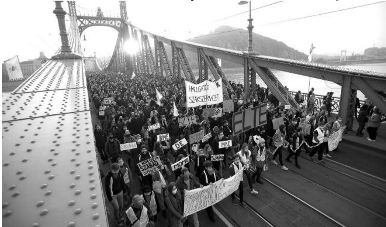
A Mindannyiunk szabadsága – megemlékezés 56-ról címmel rendezett demonstráció résztvevői vonulnak a Szabadság hídon 2020. október 23-án, az 1956-os forradalom és szabadságharc kitérésének 64. évfordulóján. A tüntetést a Színház- és Filmművészeti Egyetem (SZFE) hallgatói szervezték.

A felsőoktatás autonómiájáért, a szellemi szabadságért tartottak vonulós megemlékezést a Színház- és Filmművészeti Egyetem (SZFE) hallgatóinak szervezésében pénteken Budapesten, az 1956-os forradalom és szabadságharc évfordulóján.