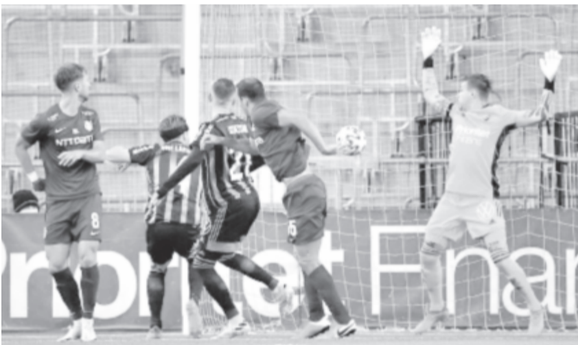
A kolozsvári csapat az előző körben a svéd Djurgardent búcsúztatta.

Kilenc év után fordulhat elő ismét, hogy a Kolozsvári CFR két egymást követő évadban is felkerül valamely európai kupasorozat főtáblájára: a román bajnoknak ehhez a finn KuPS csapatát kellene legyőznie ma 18.30 órai kezdettel az Európa-liga-selejtező rájátszásában. Tavaly a CFR továbbjutott a csoportkörből a második számú kontinentális kupasorozatban, a tizenhatodikként pedig úgy esett ki, hogy nem kapott ki a később kupagyőztes Sevillától (1-1 és 0-0 volt a két mérkőzés eredménye). A kolozsvári csapat a Bajnokok Ligája-selejtezőből került át az Európa-ligába, miután hazai pályán tizenegyespárbajban alulmaradt a Dinamo Zágrábal szemben. A csütörtök esti továbbjutás 5 millió eurós bevételt jelentene a klubnak. A mérkőzés televíziós közvetítéséről szerdán délután még nem volt információ.