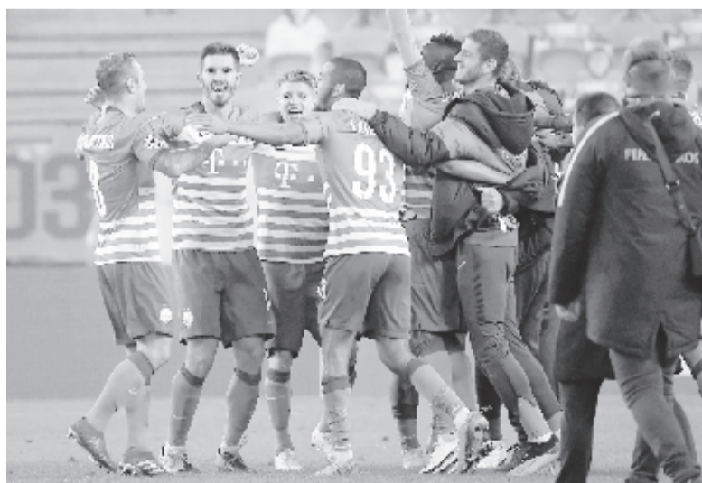
Ferencvárosi játékosok ünnepelnek a Molde elleni zárt kapus mérkőzés után.

Molde: Linde – Pedersen, Gregersen, Ellingsen, Haugen – Hussain (81. Omojuanfo), Aursnes – E. Hestad, Eikrem, Knudtzon (64. Brynhildsen) – James.