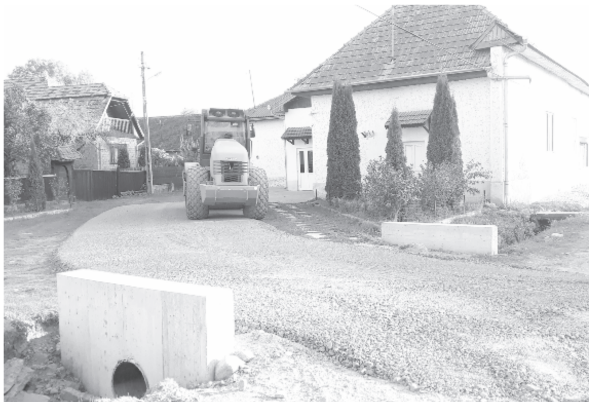
Első lépésben az átvezetők és a mellékhidak épültek meg, ezután következik az út alapozása