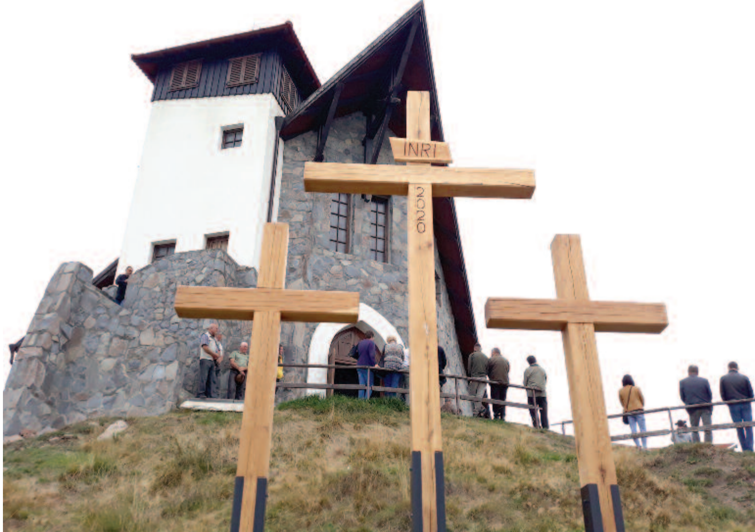
A megye magyarságának összefogásából épült a kápolna és a keresztút