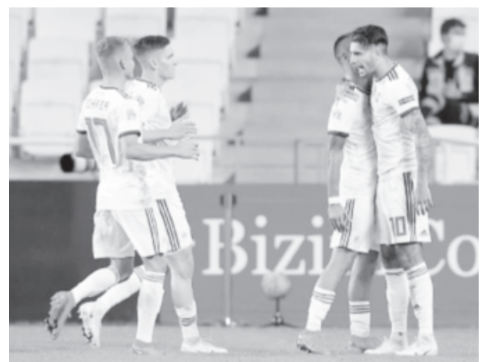
Magyarország 1984 után nyert ismét Törökországban.

A Románia kispadján bemutatkozó Mirel Rădoi viszont elrontotta a rajtot a csoport legszerényebb csapatának tartott Észak-Írország ellen. Hiába dolgozott ki a csapat több helyzetet, mint – költői túlzással – a legutóbbi két szövetségi kapitány mandátuma alatt összesen, csak egyet tudott értékesíteni. Aztán, miután emberfölénybe került a csapat, elpárolgott az összpontosítás maradéka is, és az északiek az egyetlen veszélyes támadásukat góllá váltották. A legrosszabbkor, amikor már nem maradt idő az újításra. Románia ma 21.45 órától játssza második találkozóját, Klagenfurtban Ausztria vendége lesz (Pro TV).