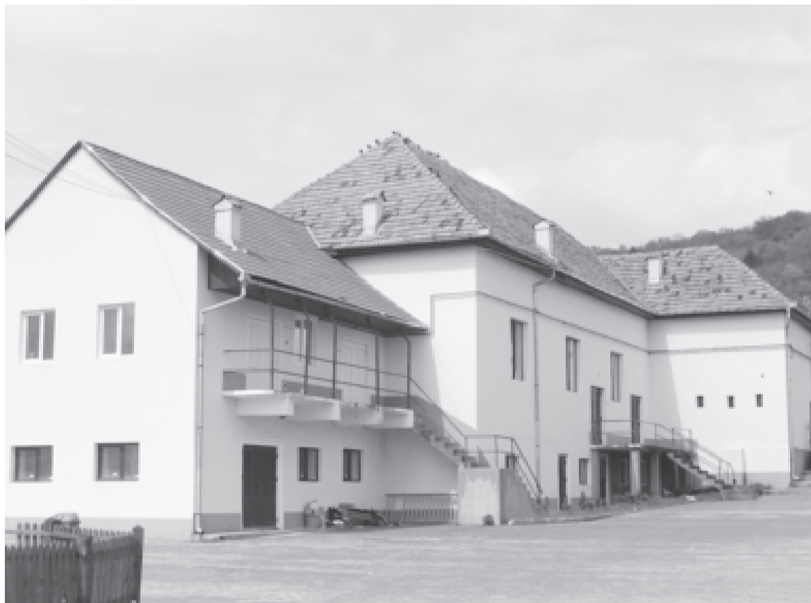
A balavásári kultúrotthon javítása egyike a jelenleg futó beruházásoknak

Tudja, hogy honnan indult, és meddig jutott el a három mandátum alatt, és megvan az az elégtétele, ami meg is illel ennyi idő múltával. Mindig van helye a többnek, a jobbnak, sohasem lehet hátradólni, sok dolog elő van készítve, amelyeket a következő községvezetőnek kell majd továbbvinni, és azokhoz újakat tenni. Ugyanis indul a következő hétéves európai pénzügyi és támogatási ciklus, élni kell a lehetőséggel, és további pályázati kérelmeket benyújtani.