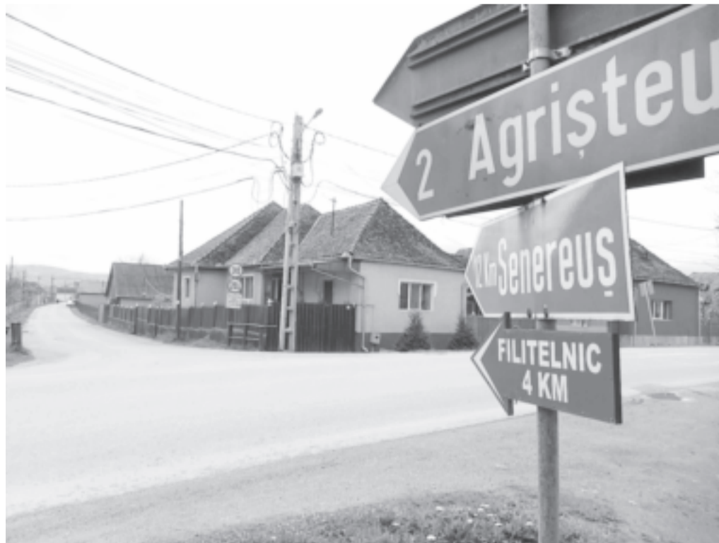
A középületek rendbetétele, a községi utak korszerűsítése volt az elmúlt időszak feladata