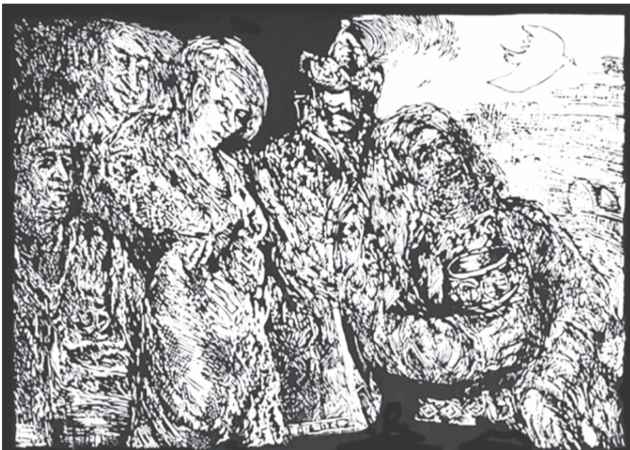
Szepessy Béla Faludy-illusztrációja

*110 éve, 1910. szeptember 22-én született a költő. Elhunyt 2006. szeptember 1-jén.