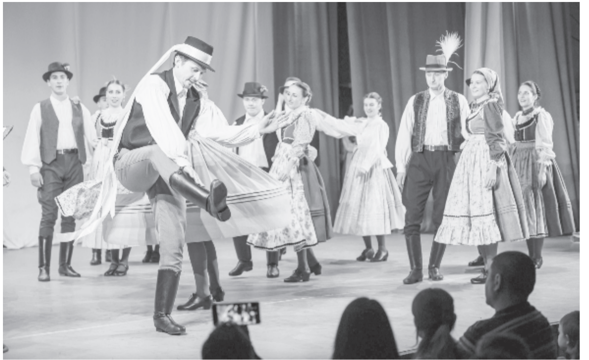
Négy hónapi kényszerszünet után augusztusban állhatott ismét színpadra az együttes

A turné utolsó napjaiban értesültek arról, hogy szeptember elsejétől Romániában is engedmények következnek, és akár beltéri rendezvények is szervezhetőek ötven százalékos helykapacitással. Mivel csak szeptember 6-án derült ki, hogy milyen feltételeknek kell eleget tenni, már csak a hónap második felére sikerült előadásokat