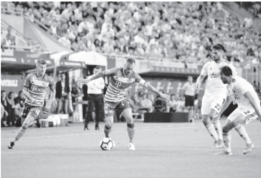
Tavaly is összekerült a két csapat, a továbbjutás Budapesten dőlt el – most is így lesz.

„Ismét egy nagyon erős ellenfelet kaptunk, ahogyan azt az előző körökben tapasztalhattuk, de vállaljuk a kihívást, és ennek is azzal a céllal megyünk neki, hogy kiverjük a Dinamót, és bejussunk a playoffba. Annak nagyon örülünk, hogy hazai pályán játszhatunk, ez mindenféleképpen jó. A csapat a Celtic ellen már megmutatta, hogy ilyen erősségű ellenfelekkel szem-