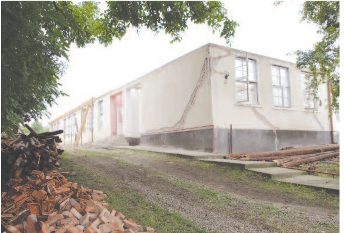
Teljesen felújítják a csittszentiváni iskolát

Minden faluban az igények szerint korszerű sportlétesítményeket hozunk létre. Csittszentivánon például egy 22 hektáros területet adtunk át a megyei tanácsnak, ahová a motorsportokat kedvelőknek európai színvonalú központot terveznek. De célunk a Maros-parton egy vízisportkomplexum kialakítása is.