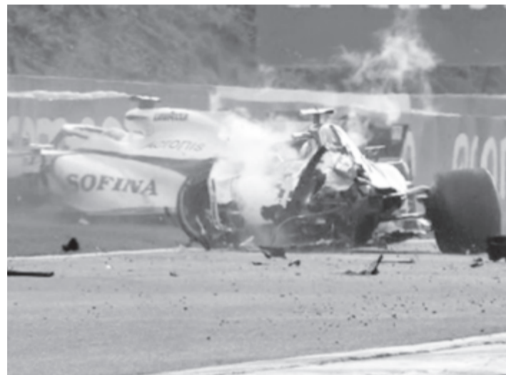
Spában csak Giovinazzi és Russel balesete hozott némi izgalmat a versenybe.

A verseny a hét végén Monzában, az Olasz Nagydíjjal folytatódik.