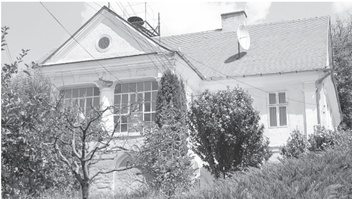
Sürgősen fel kellene újítani az impozáns udvarházat