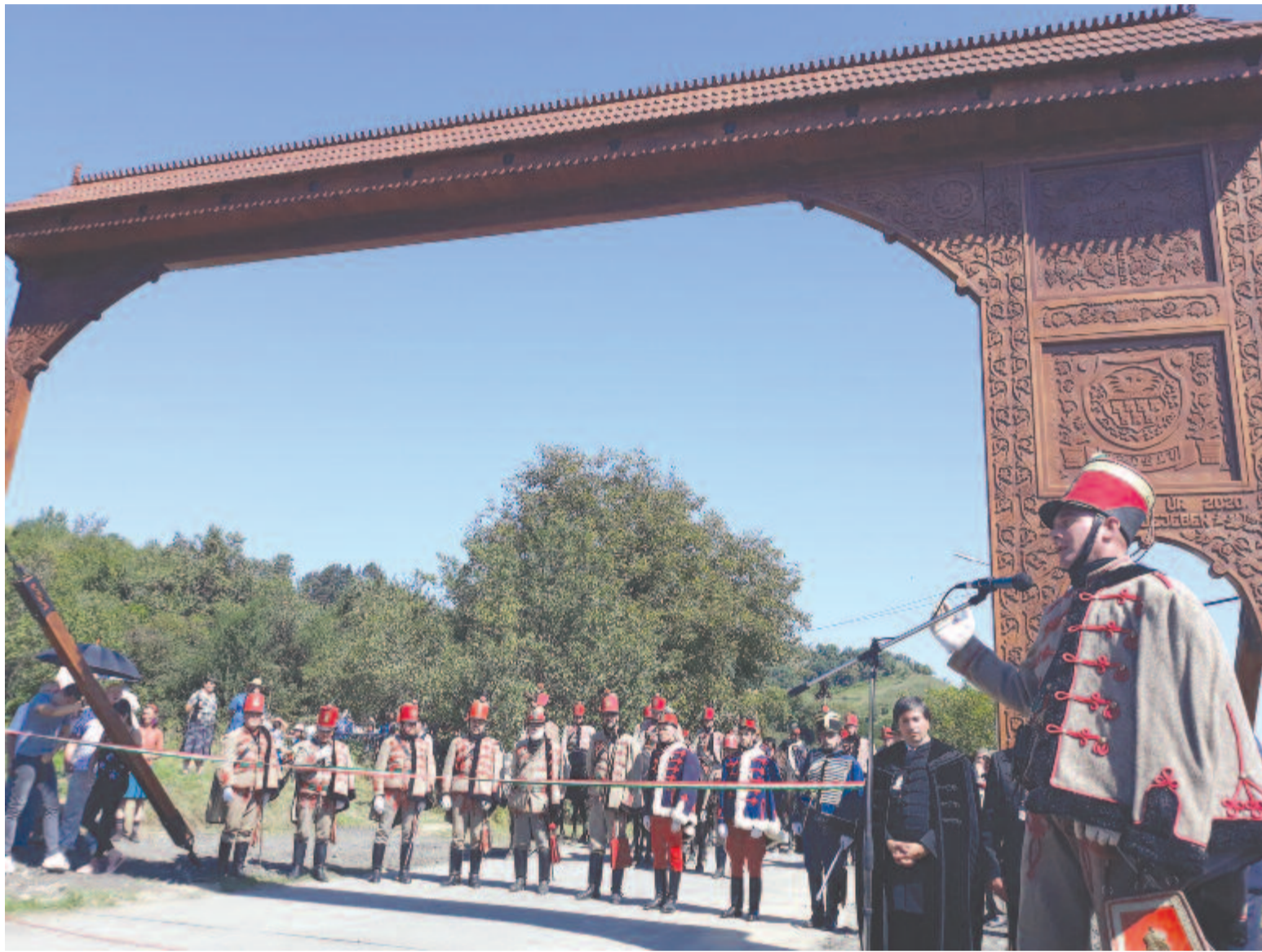
Az összetartozás, megmaradás jelképeként áll a gegesi falukapu