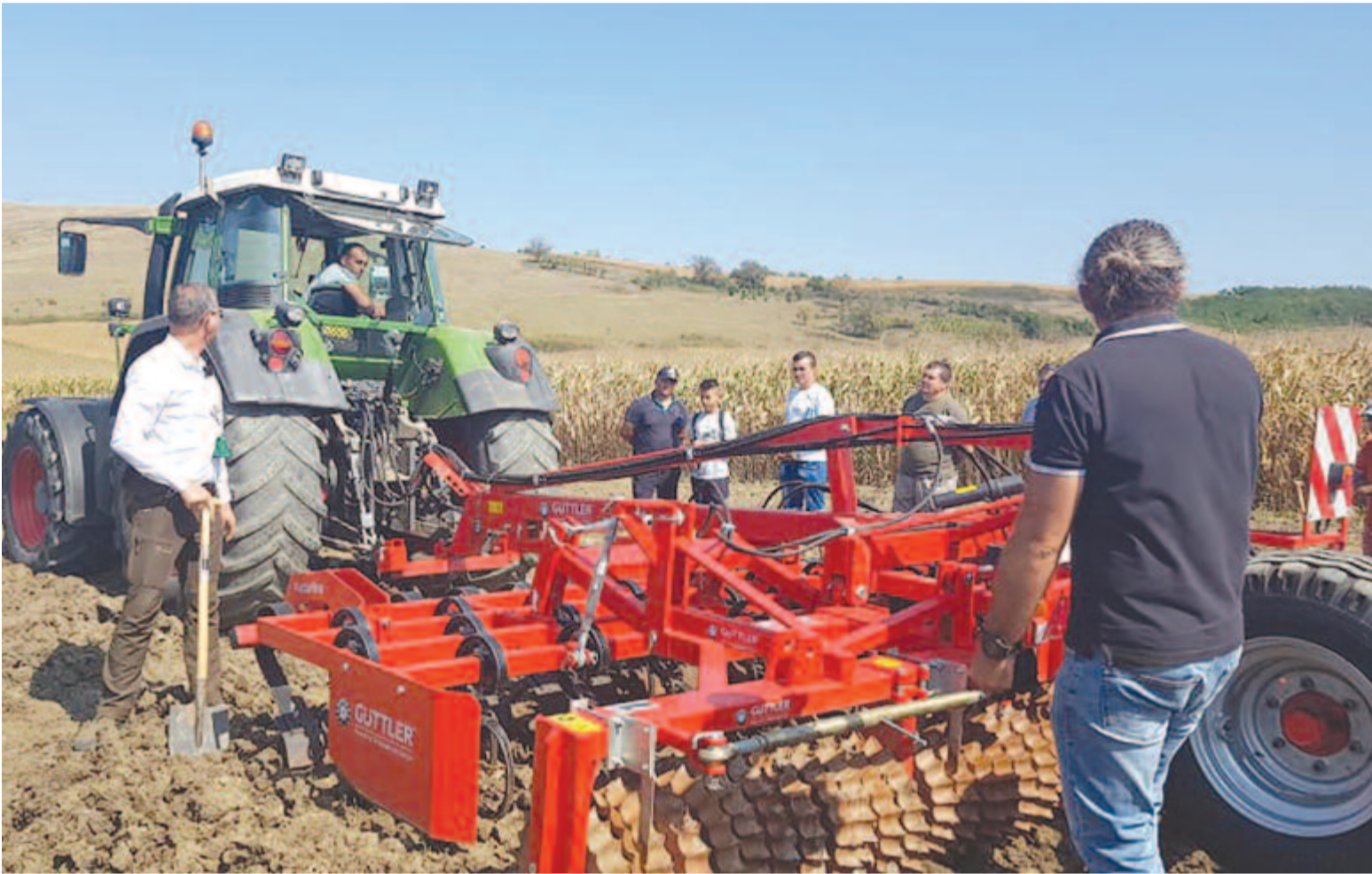
Száznál több megyénkbeli gazda érdeklődött a színvonalas rendezvény iránt