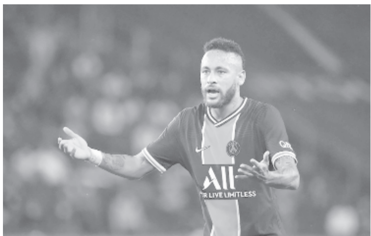
Rosszul sikerült Neymar visszatérése: a koronavírus-fertőzés miatt eddig nem játszó brazil csapata Marseille elleni mérkőzésén piros lapot kapott ütéseért, ráadásul a PSG második bajnoki meccsét is elvesztette. A PSG 0 ponttal a kiesést jelentő 18. helyen áll, a Marseille kettőből két győzelemmel az ötödik.

* Francia Ligue 1, 2. forduló: Angers – Bordeaux 0-2, Brest – Olympique Marseille 2-3, Lens – Paris St. Germain 1-0, Lyon – Dijon 4-1, Metz – AS Monaco 0-1, Nantes – Nimes 2-1, Reims – Lille 0-1, Stade Rennes – Montpellier HSC 2-1, St. Etienne – Lorient 2-0, Strasbourg – Nice 0-2; 3. forduló: Angers – Reims 1-0, Bordeaux – Lyon 0-0, Dijon – Brest 0-2, Lille – Metz 1-0, Lorient – Lens 2-3, AS Monaco – Nantes 2-1, Montpellier HSC – Nice 3-1, Nimes – Stade Rennes 2-4, Paris St. Germain – Olympique Marseille 0-1, St. Etienne – Strasbourg 2-0. Az élcsoporthoz: 1. Stade Rennes 7 pont (7-4), 2. AS Monaco 7 (5-3), 3. Lille 7 (3-1).