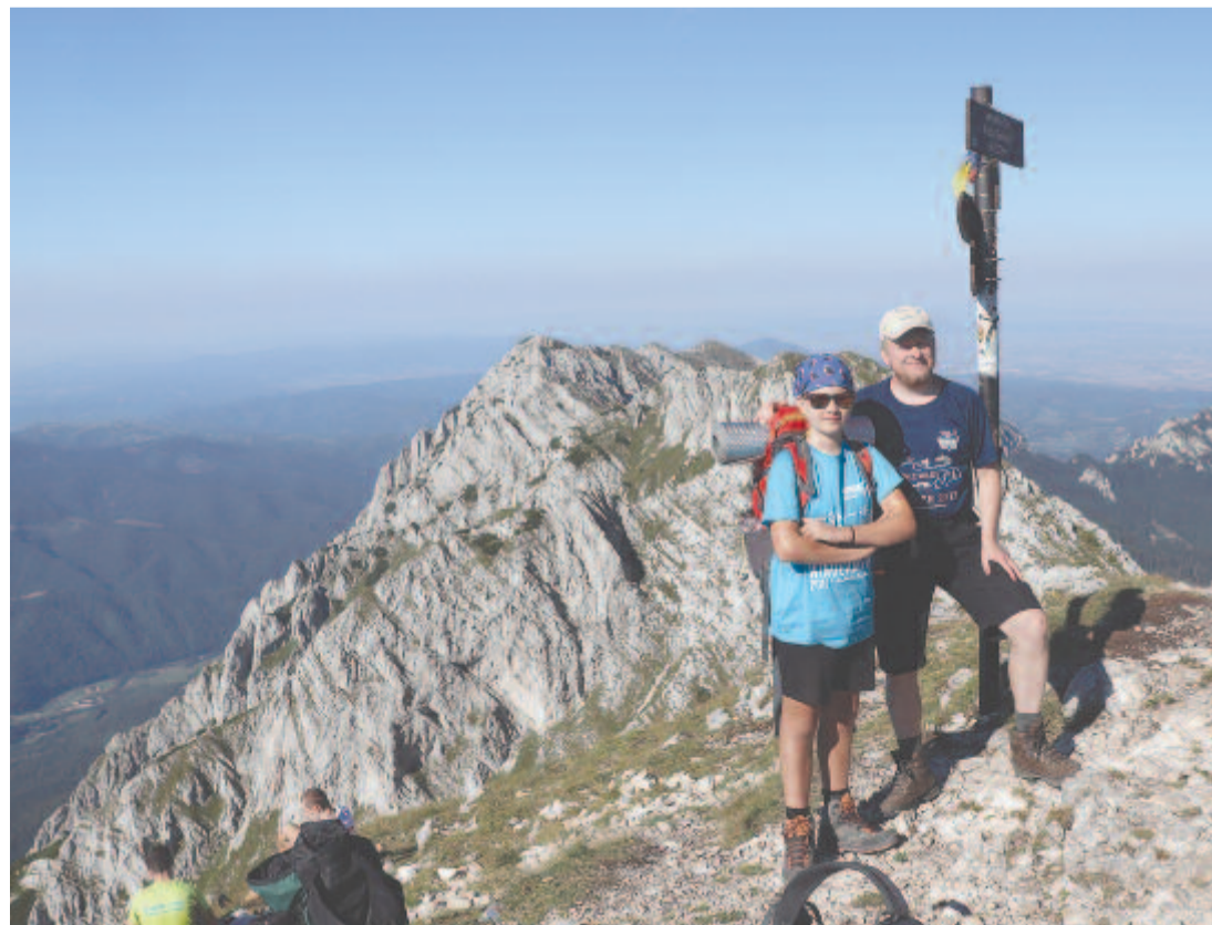
A Királykő tetején, a Pásztor-csúcsra