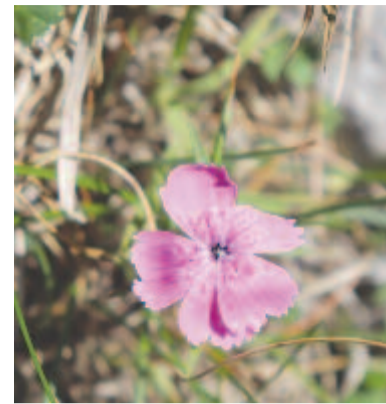
A hegység endemikus faja, a királykői szegfű éjszakázni, ezért szerjük a sátorfánkat, és alsóbb, biztonságosabb régióba ereszkedünk.

De mi még nem akarunk oda jutni, visszavágyunk az egyszeri és megismételhetetlenül csodálatos földi életbe. Tudjuk, mekkora kockázattal jár a pengeéles gerinceken