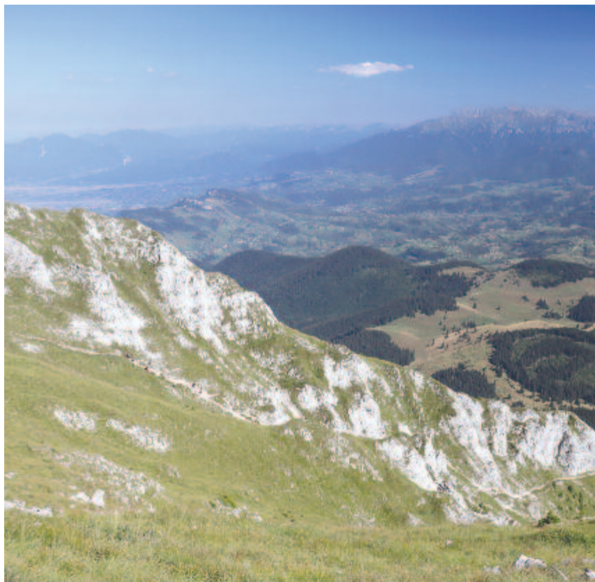
A Törösvári-szoros és a Bucsecs-hegység látványa a Királykő gerincéről