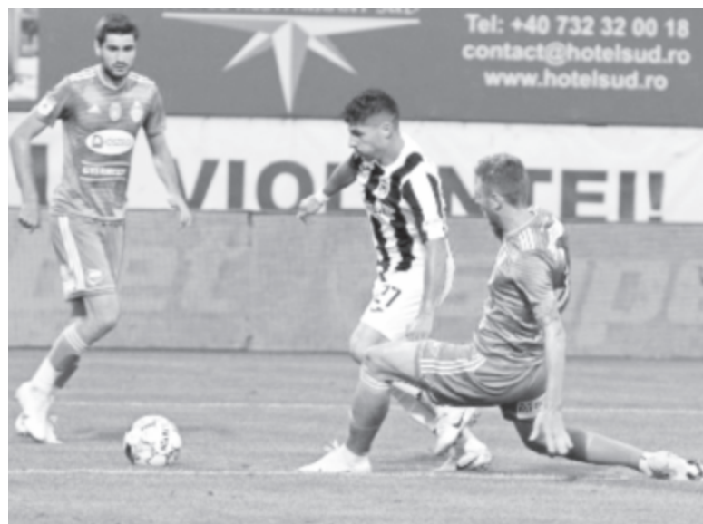
Gyurgyevói vendégszerepléssel folytatódott a háromszékiek nehéz idény eleji meccsorozata

A Sepszi OSK kegyetlenül nehéz idény eleji programja ezzel még nem ért véget. Szombaton újabb erős ellenfél következik: a Konstancai Viitorul fogadják.