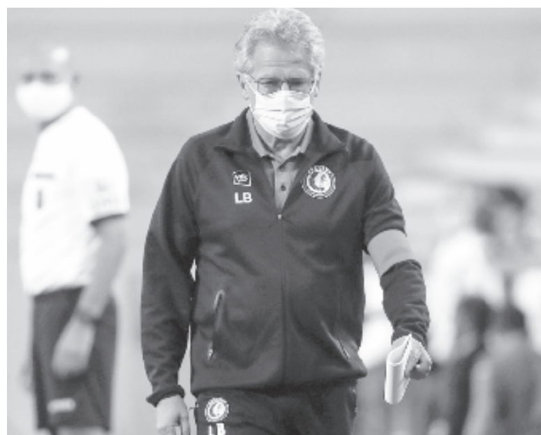
Bölöni három meccsen irányíthatta a belga bajnoki ezüstérmest, menezstették

• Az amerikai Lake Placid helyett a németországi Altenbergben rendezik a februári bob- és szelektónvilágbajnokságot, jelentették be. A nemzetközi sportági szövetség azért változtatott a helyszínen, mert a koronavírus-járvány miatt nem lenne biztosított a zavartalan rendezés az Egyesült Államokban, és az utazási korlátozások is komoly gondot okoznának. A február 5–14-e közötti időpont nem módosult.