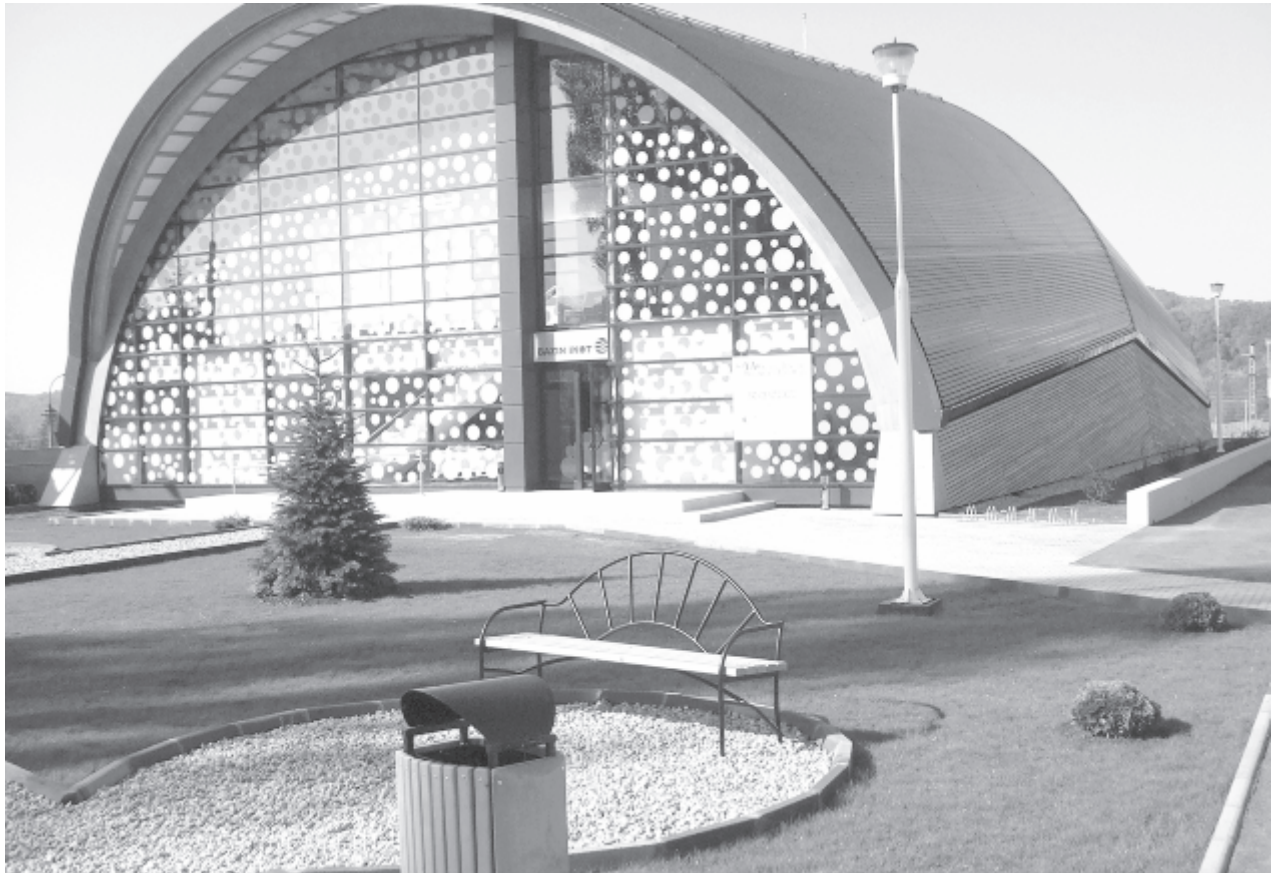
Ilyen lesz majd a tanuszoda – jelenleg az ajánlatokat értékelik ki (látványterv: CNI)