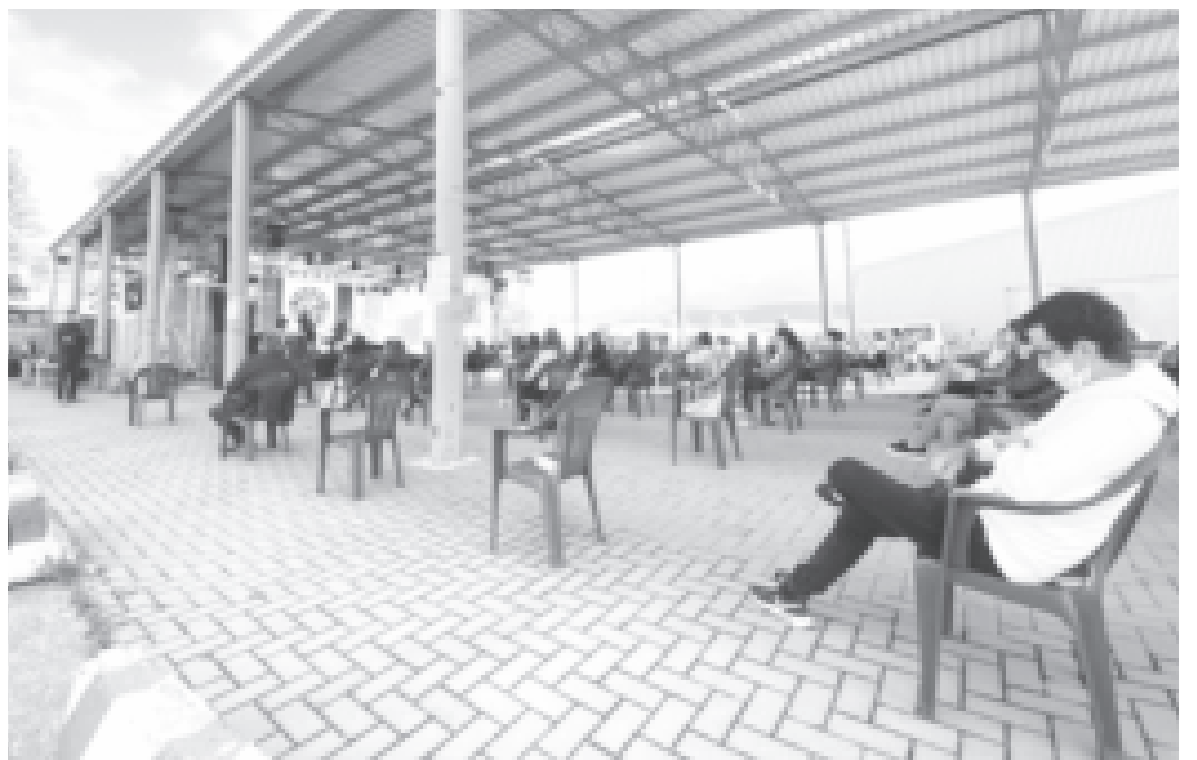
Az ülő közönség

– Nagyon kacifántosan. Az eredeti koncepció az volt, hogy megpróbálunk nagy zenekart, headliner zenekart hozni, egyébként a Kiscsillag lett volna az, de a magyarországi koronavírus-helyzet miatt behúzták a féket. Ekkor próbálkoztunk bohémabb zenekarokkal, amelyeket esetleg nem érdekel annyira a járványhelyzet, de végül senki nem vállalta. Akkor eldöntöttük, hogy nem gond, sőt még jobb is, mert erdélyi zenekarokkal fogunk dolgozni, és így esett a választásunk Koszikára és a No Sugar együttesre.