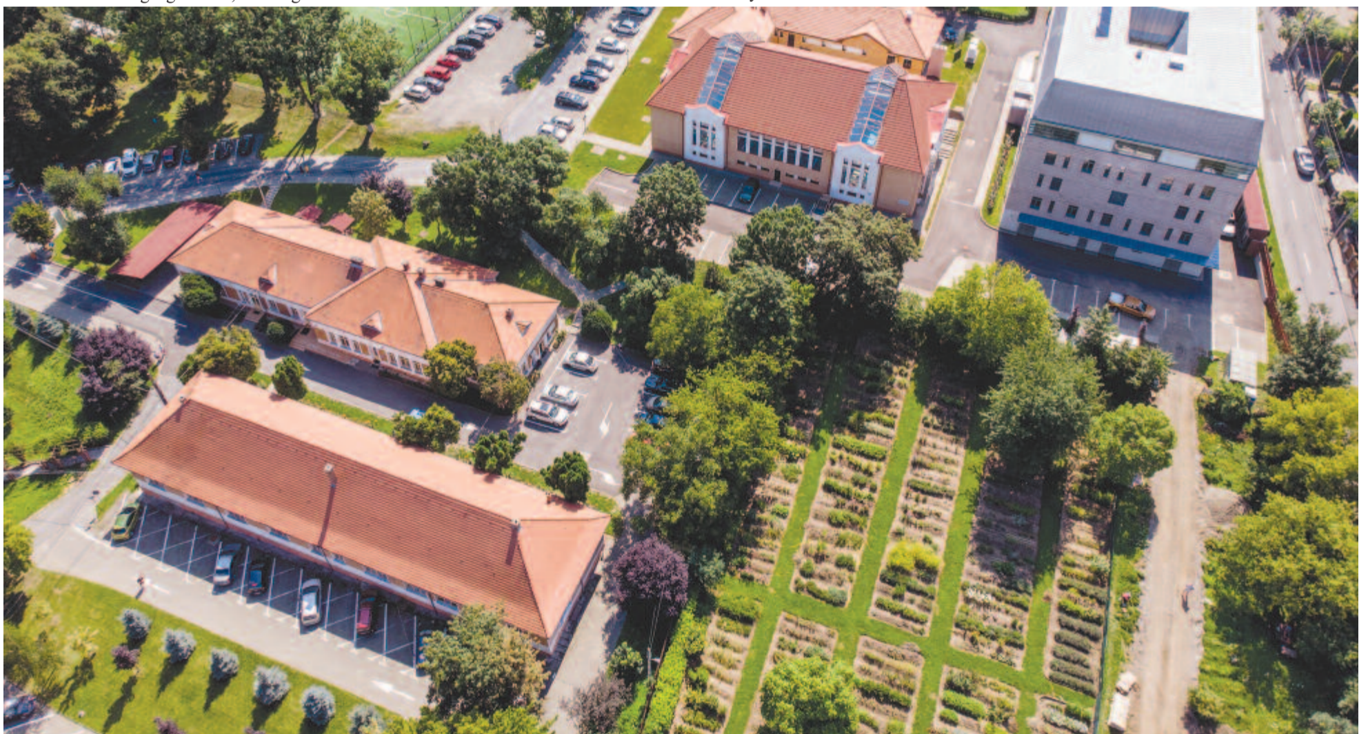
A Kopp Elemér által létesített gyógynövénykert az egyetem udvarán