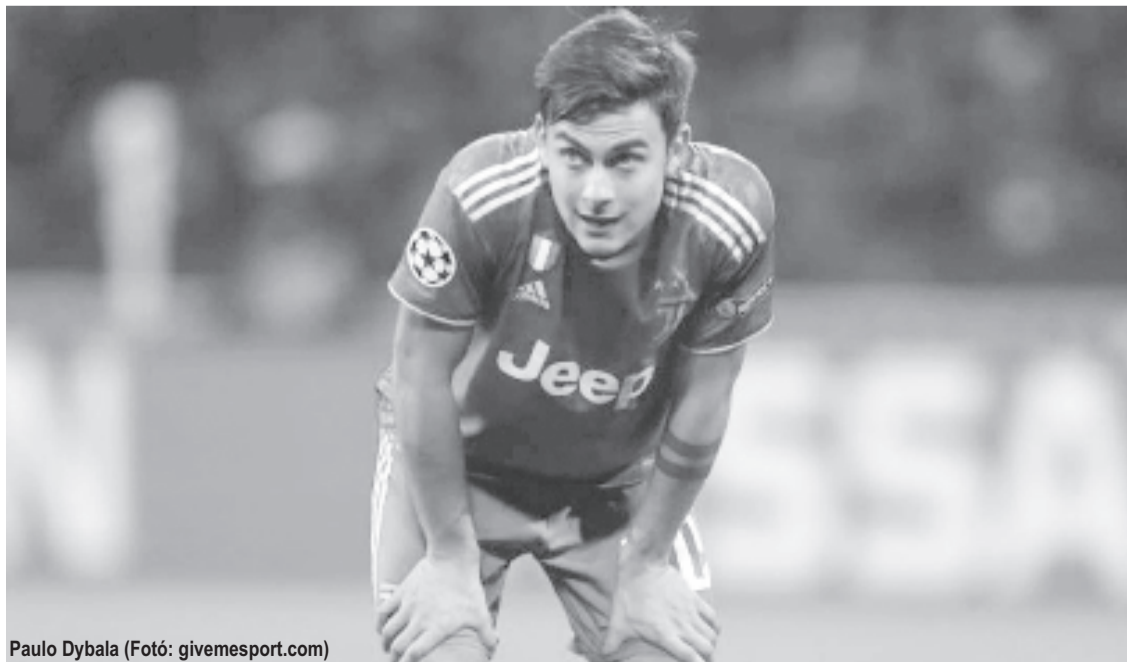
Paulo Dybala

kapus: Wojciech Szczesny (lengyel, Juventus) védő: Stefan De Vrij (holland, Internazionale) középpályás: Alejandro Gómez (argentín, Atalanta) támadó: Ciro Immobile (olasz, Lazio) a legjobb 23 év alatti: Dejan Kulusevski (svéd, Parma) MVP: Paulo Dybala (argentín, Juventus)