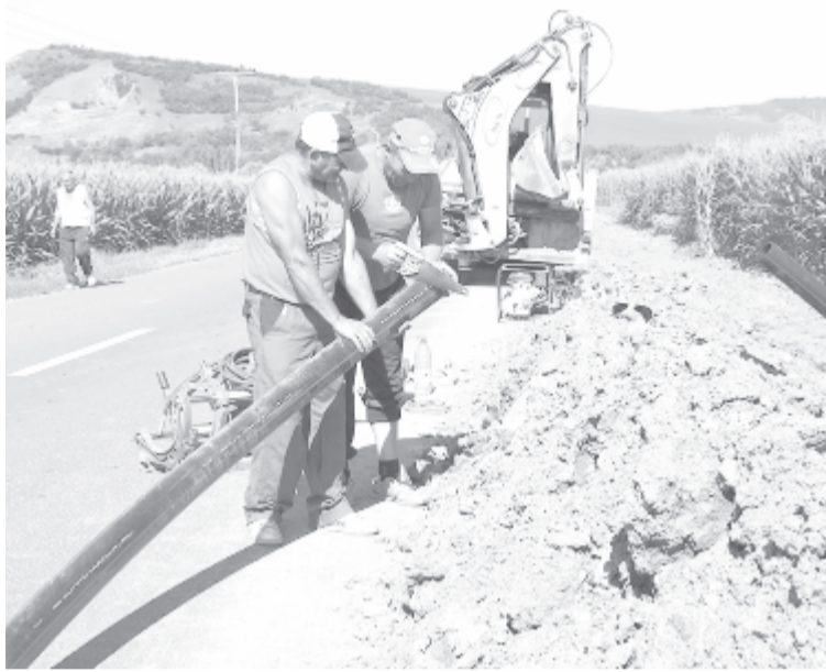
Képünk illusztráció

A munkaszerződés bármilyen módosítását a változtatás bekövetkezése előtti napon a szerződéshez kell csatolni mellékletként. Ez alól kivételt képeznek azok az esetek, amelyekre a Munkatörvénykönyv kitér, vagy a kollektív munkaszerződésbe foglaltak. A munkáltatónak kötelessége a munkahelyen naponta ledolgozott időt nyilván-