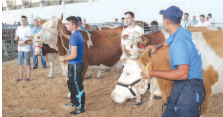
Fiatalkorú farmerek szarvasmarha-kiállításon

taloknak szánt támogatást, farmonként leg több 50.000 euróra lehet pályázni. A 6.1-es támogatási kiírás alapján az összegeket vissza nem térítendő hitelként kapják meg a gazdák. A kérvényeket október 20-ig kell benyújtani az APIA-hoz. Erre 42 millió eurót szánt a szaktárca. Ebből 20 millió eurót elkülönítettek azoknak a fiataloknak, akik külföldről térnének vissza az országba (diaszpóra támogatása). Ezenkívül gyümölcsös létesítésére termelői csoportoknak 1.985.000 eurót szánunk. A feltétel az, hogy ezért leg több 50 hektáros terület megművelését kell vállalják. Az üzleti tervek alapján az összeg 75%-át a szerződéskötés után utalják át, a fennmaradt 25%-ot az üzleti terv megvalósításának függvényében kapják meg a gazdák. Növénytermesztés esetén három, gyümölcsös fenntartására öt évre szóló üzleti tervet kell készíteni. A külföldről visszatérők átvehetik szüleik gazdagságát, ezek működtetésére el kell készíteniük a fejlesztési tervet, amelynek alapján pályázhatnak a támogatásra.