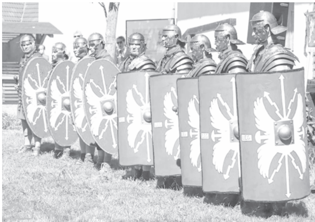
A Milites Marisiensis csapata Mikházán

– Valójában közös a célunk. Azt szeretnénk, hogy akik eljönnek Mikházára, ne csak a show, a látványos műsor miatt látogassanak el oda, hanem olyan kérdésekre is választ kapjanak, hogy miért harcoltak az ókori rómaiak, milyen volt a gondolkodásmódjuk, milyen hús-vér emberek öltöztek egykor egyenruhát? Két évvel ezelőtt a tordai ásátásokon találtunk egy téglát, amelyre valaki 2000 évvel ezelőtt egy „pálcikaembert” rajzolt. Talán egy katona lehetett, aki a castrum építése, bővítése során unalmában a téglavetés után beleverte a kézjegyét az agyagba. Ilyenkor az az izgalmas, ha elgondoljuk, hogy vajon mire gondolt, ki lehetett? Egyszerű ember, olyan, mint mi, akik ugyanígy otthagytuk a kézjegyünket a homokban, a falon. Ezen túlmenően pedig arra is választ kereshetünk, hogy mit jelentett egy idegen helyre áttelepedve az egykori római provinciában élni, mit hagytak ránk a rómaiak? Mert az ideológiai vitákon felül azt biztosan állíthatjuk, hogy a mai európai kultúra alapja az egykori római birodalom, görög-római civilizáció. És a múzeumpedagógiai tevékenység célja is az, hogy emberközelbe hozza a régimúltat, és ebben segítünk mi. A diákokat is arra ösztönözzük, hogy hosszú távon gondolkodjanak e szakmában. Mi az a szellemi, tárgyi örökség, amelyet úgy értékesíthetnek, hogy ezáltal a saját lakóhelyükön, a megyében élők jobban megértsék a múltat, és jövőben gondolkodva dolgozzanak a jelenben?