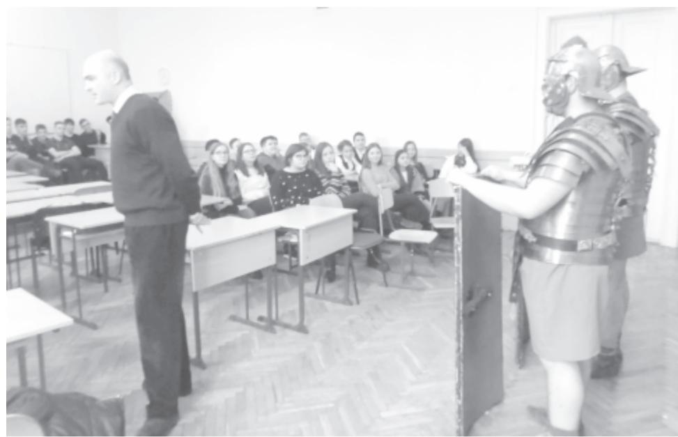
Élő történelemóra a középiskolában

folytatnak ásátásokat. A régészeti pálya is ígéretes, aki diplomát szerez, bekerül a régészek jegyzékébe, és külföldre is eljuthat. Az idén is két diákom az ausztriai Carnuntumban (Európa egyik legjobban rekonstruált római települése) vesznek részt ásátásokon. Más. Az egyik diákom informatikát végzett, majd történelem szakon folytatta tanulmányait. Egy ásátáson talált lelet kapcsán – felhasználva korábbi tudását – 3D-s rekonstrukciót készített, aminek köszönhetően sikerült visszatekintnünk a múltba. Egy másik diáklány az államvizsga-dolgozatát a római katonák étkeztetéséről írta. A leletek és a rendelkezésre álló információ alapján recepteket állított össze, mi több, kiderítette, hogy a castrumokban állomásozó római légiósok napi fogyasztása kalóriában nem sokban tért el a jelenlegi amerikai hadseregben szolgáló katonákétól (míg a rómaiak 3000, az amerikai katonák 3600 kalóriát fogyasztanak). Ezen túlmenően elképzelhető az is, hogy a gasztronómiai ismereteket a turiz-