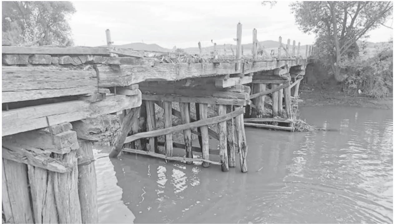
Néhány napja bontják a fahidat, hamarosan már csak emlék lesz