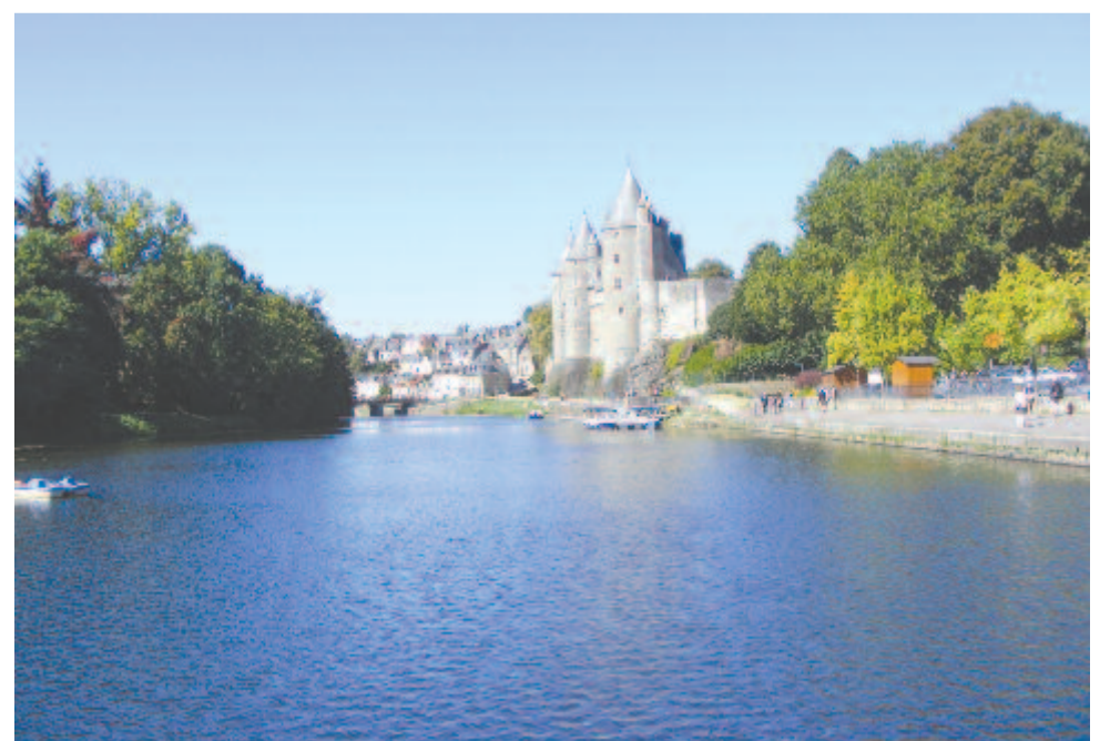
Josselin, a Rohanok kastélya