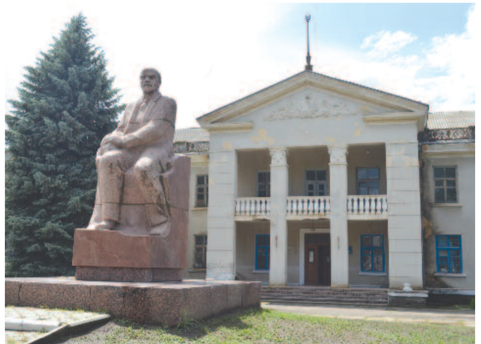
Üldögélő Lenin a községközpont előtt

Mégis. A világhálóról tudom meg, hogy a stuttgarter magyarok Csöbörccsök táncegyüttest működtetnek. Táncegyüttesük több mint három évtizedes múltira tekint vissza, és 1989 óta kizárólag a Kárpát-medence különböző magyarlakta vidékeiről származó, eredeti néptáncokat táncolnak. Vajon mi a névadásuk története? Vajon ők is a legkeletibb csángó település nyomában jártak egykoron?