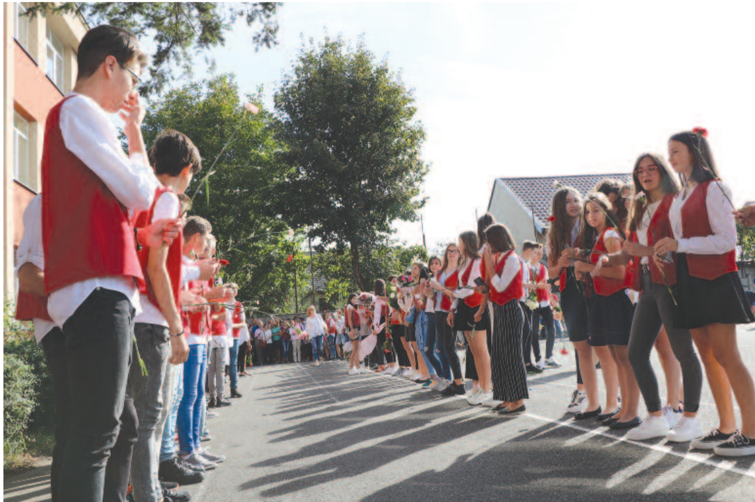
A felvétel a tavalyi tanévnyitón készült