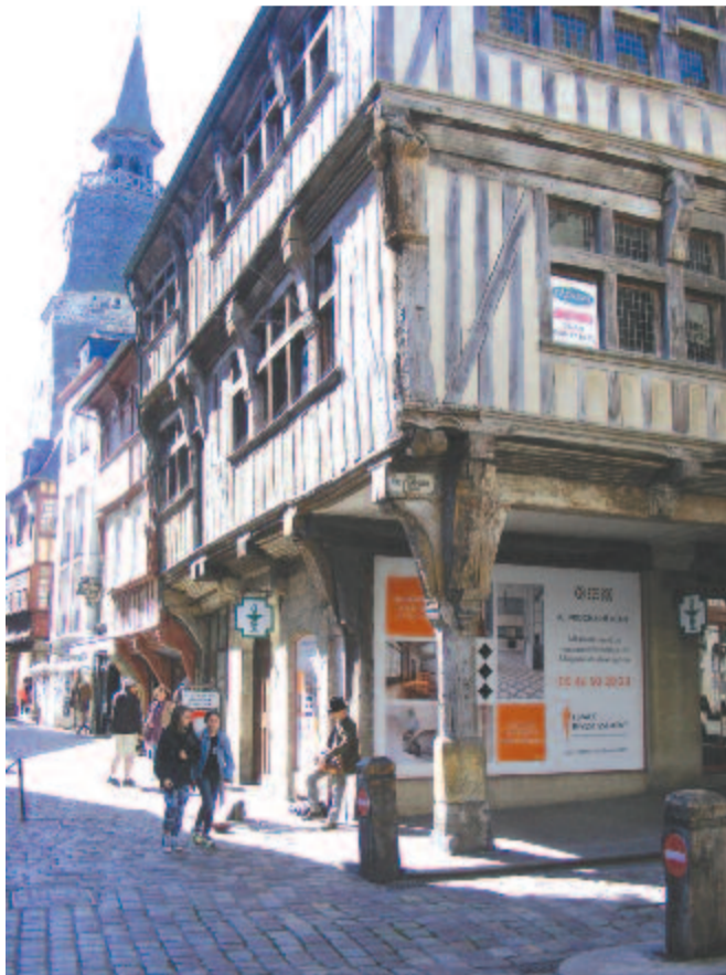
Dinan, öreg faépület, patika és utcai zenész

A Dolent mezőn látható menhir magassága közel tíz méter, vörös gránitból készítették, kb. 100 tonna súlyú, ovális és sima felületű óriáskő (megalit, monolit). A főút közelében, egy piknikmezőnek bekerített területen áll, de szabadon látogatható. A kő mellett rövid leírás is olvasható a történetéről. Egy időben keresztet is helyeztek a tetejére, hogy keresztény emlékek mutasson, valójában nem az,