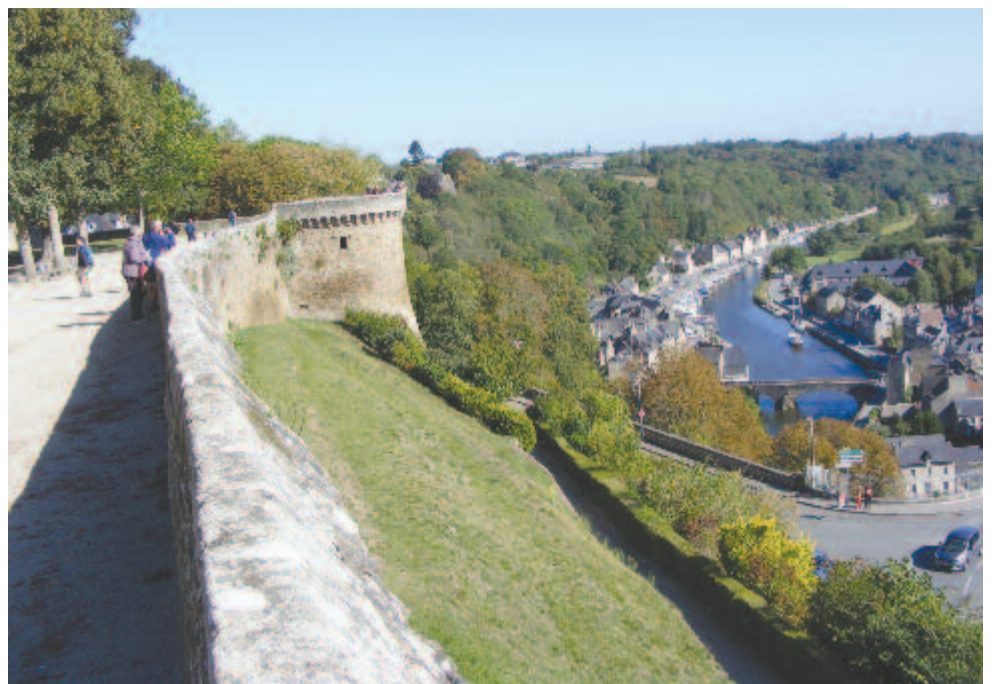
Dinan falai és a kikötő

Dinan történelmi város, Dinard üdülővárosához hasonlóan a Rance folyó bal oldalán, egy breton fjordnak nevezett szűk völgyből kimagasló fennsíkon fekszik. Idegenvezetőnk szerint a város olyan szép és különleges, hogy csak a Disney meséiben van hasonló, a való életben „nincs is”. A legtöbb, festői környezetben épült szép város a modern világban kereskedelmi