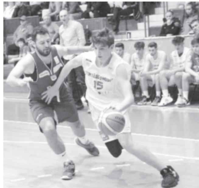
Megtörténhet, hogy sem férfi-, sem női csapata nem lesz a megyeszékhelynek a következő bajnoki évadban

Továbbra is függőben van ugyanakkor a marosvásárhelyi női kosárlabda-csapat helyzete. A Sirius tavaly nyáron, augusztusban jelentette be, hogy sikerült támogatót találni, amelynek köszönhetően indulhatott a bajnokságban. A járvány miatt azonban minden szponzor visszatáncolt, a kényszerhelyzetre hivatkozva. Jelenleg a klubnak nem áll rendelkezésére az a háttér, amely az új idényben való induláshoz szükséges. A támogatók felkutatása nem állt meg, az idő azonban szorít, ha nem kerül hamarosan szponzor, akkor a női kosárlabdáról is le kell mondania marosvásárhelyi sportkedvelő közönségnek.