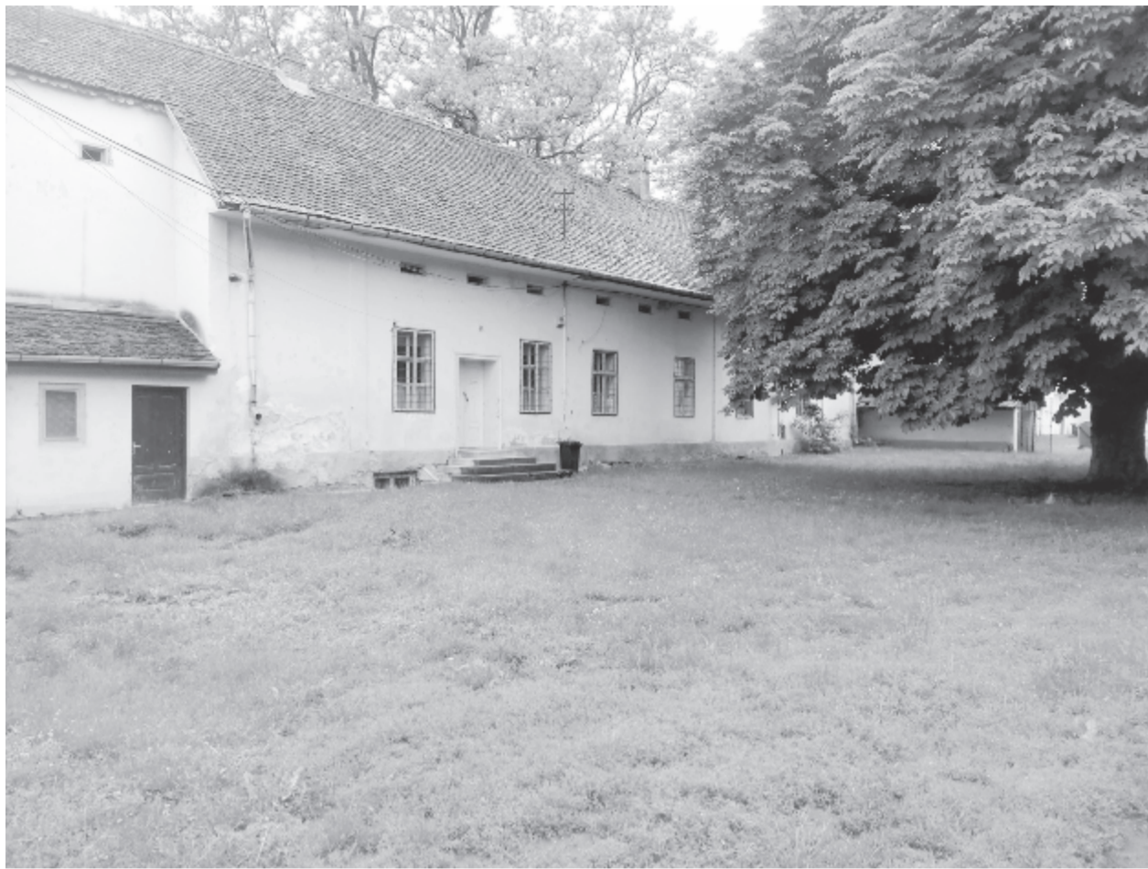
Egyforma arányban osztja meg a közvéleményt az épület jövőjének kérdése