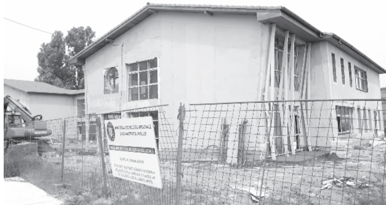
Igyekeznek behozni a lemaradást, hogy szeptemberben átadhassák az épületet

Az elemi iskola volt épülete nagyon leromlott, használhatatlan, közveszélyes, ezért elindították az eljárást a lebontására, folyamatban van az engedélyeztetés. A lebontás után lehetőség nyílna egy másik kész terv megvalósítására. Egy nagyobb szabad helyhez jutnának a faluközpontban, ahol parkolóhelyeket alakítanak ki, hogy a községközpontba érkezők biztonságos helyen hagyhassák járműveiket, amíg az ügyintézés, bevásárlást végzik. Ugyanakkor kibővítik, átalakítják a szomszédos kultúrotthont, hogy olyan szolgáltatásokat vigyenek az épületbe, amelyekre szükség van. Az épület egyik végében hét orvosi rendelőt alakítanak ki az emeleten, lifttel. A kultúrotthon emeletén vendégszobák kapnának helyet, az épület másik végében a vendéglátóipari egység lenne, panziós ellátással a szállóvendégeknek. A kibővített épület és a parkoló között amfiteátrummal, szökőkúttal ellátott zöldövezetet alakítanak ki.