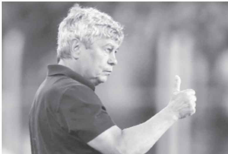
Mircea Lucescu a Sahtar Donyeck edzőjeként a Bajnokok Ligája harmadik selejtezőkörében rendezett, Fenerbahce elleni mérkőzésen, az isztambuli Sukru Saracoglu stadionban, 2015. július 28-án