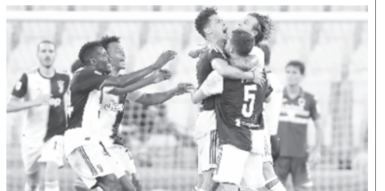
Cristiano Ronaldo gólját ünneplik a Juventus játékosai

A Juventus zsinórban a kilencedik bajnoki címét nyerte, a topligákban egyetlen másik csapatnak sem sikerült hasonló sorozatot végigvinnie. A torinói gárda már dupla annyi elsőséggel rendelkezik, mint az örök rangsorban mögötte második két milánói riválisa, az egyaránt 18 bajnoki címmel büszkélkedő AC Milan és Internazionale.