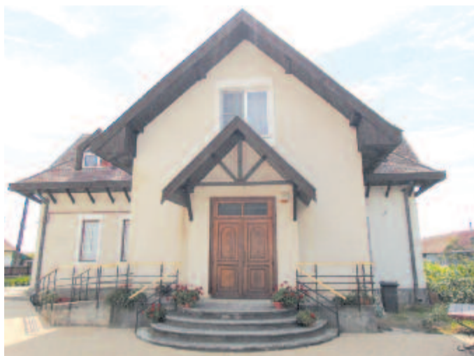
A gyülekezeti ház