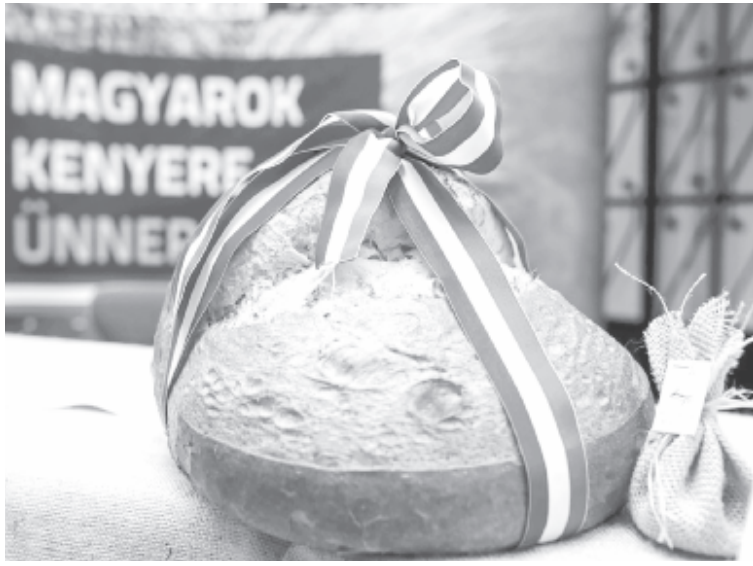
Tíz év alatt az egész Kárpát-medencét megmozgatta a Magyarok Kenyere program