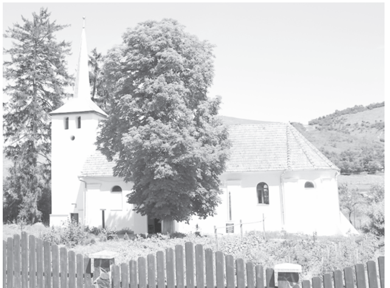
A gerendkeresztúri templom