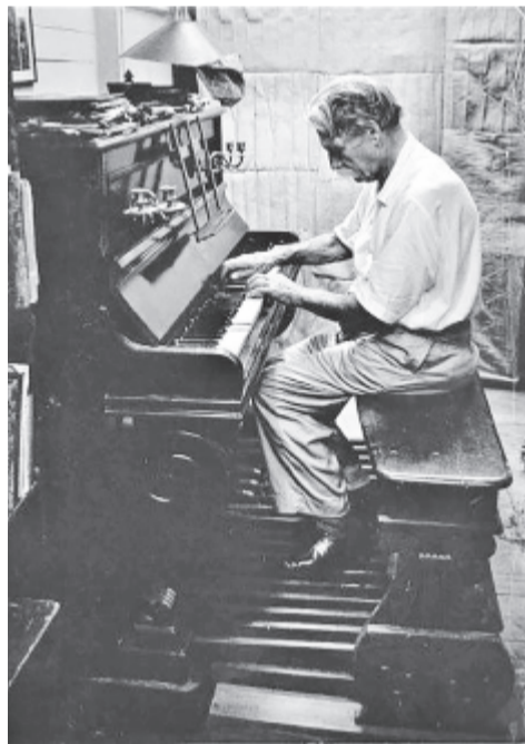
Albert Schweitzer zongorához illesztett orgonapedállal gyakorol

lakon keresztül szól, hogy várjunk, mert egy beteg ember élete fontosabb, mint a mi látogatásunk. Az élet tisztelete elsőrendű! Hogy könnyebb legyen a várakozás, enyhén irtóztva ugyan, de elindulunk szemlélődni a kórház környékén. Azt hittük, hogy egy kórházat betonból, téglából építenek, itt minden fából, deszkából készült – amolyan istállószerű építmények. De mégis felfigyelünk valamire: minden természetközeli. Óriási egzotikus fák árnyékában húzódnak meg ezek az építmények; egyszerűek ugyan, de van valami otthonos varázsuk. Mire visszatérünk a Nagy Fehér Varázló munkahelyére, ő már nincs ott. Valaki megmutatja az irányt, merre lakik. Biztosan megtaláljuk – teszi hozzá.