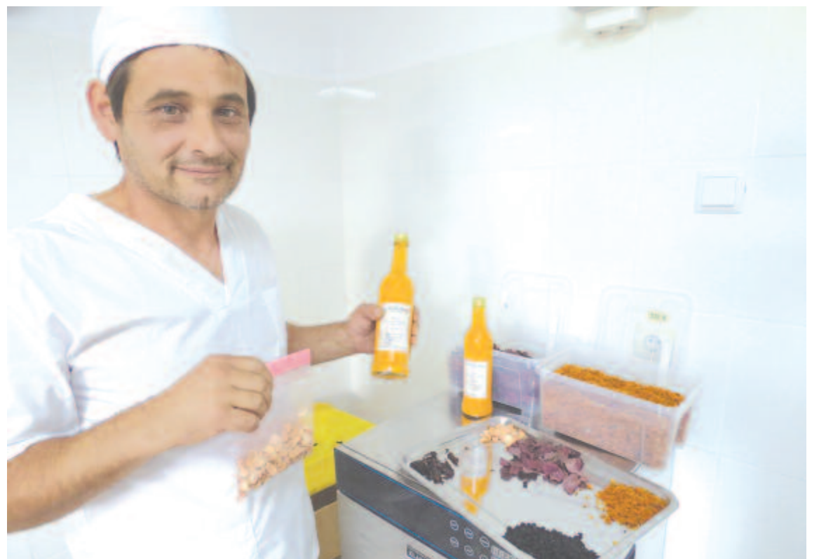
Változnak a fogyasztói kívánalmak, jobban igénylik a helyi terméket

Egyben a termelőnek is változ(tat)nia kell. Saját kisvállalkozását úgy tudta átmenteni ezen az időszakon, hogy több online vásárlási felületre felkerült, onnan kapta a rendelések nagy részét, és eleget tudott tenni a lakásba kényeszerített vagy félelmükben otthon maradt fogyasztók kiszállítási igényeinek is.