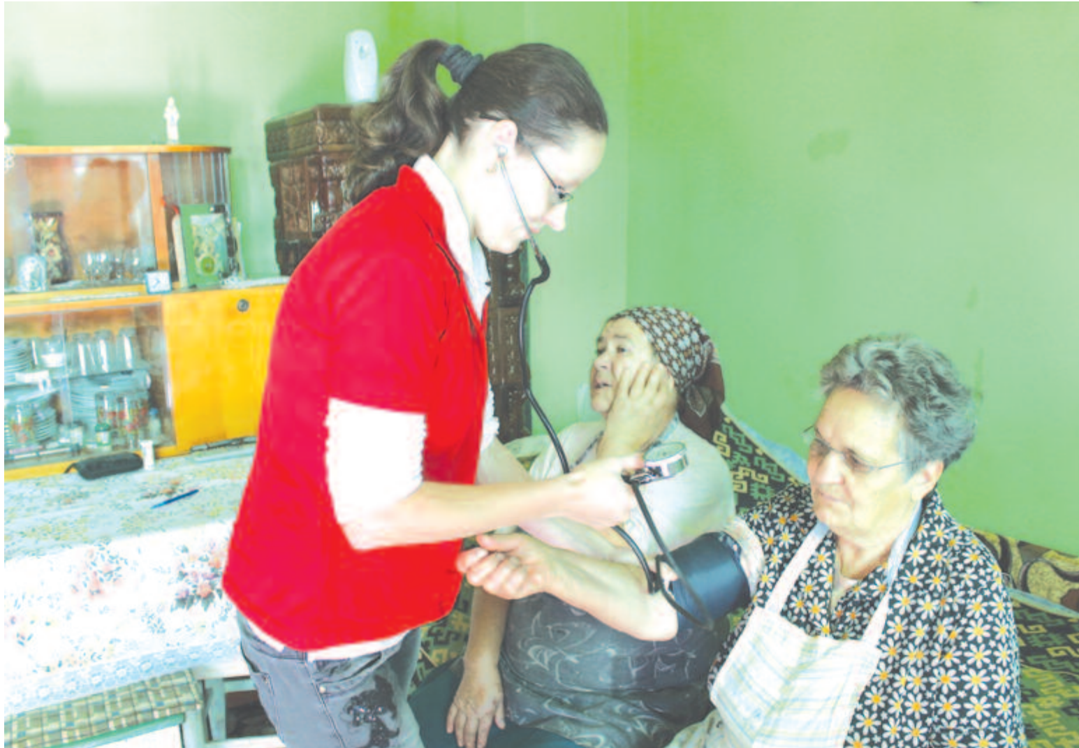
Felvételünk illusztráció