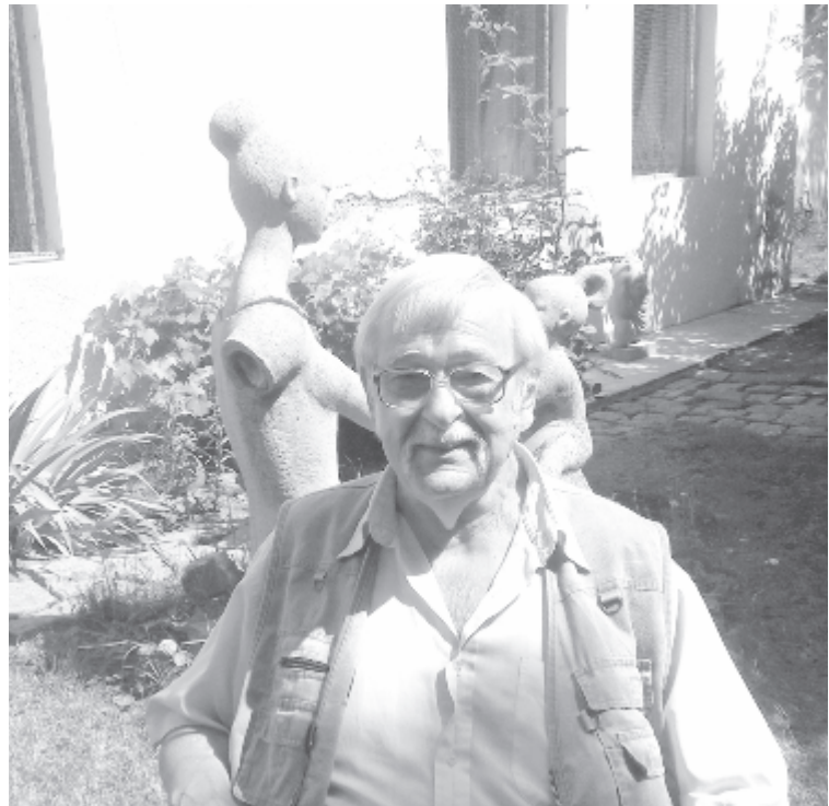
Kolozsvári Puskás Sándor lakása udvarán. Marosvásárhely, 2018.

Történelmi nagyjaink, nemzeti panteonunk kimagasló személyiségeinek megörökítője, a falu karakteres arcainak, alakjainak szeizmográférzékenységgel megmintázója, a plasztikai jelképteremtő „honfoglaló” visszatért az anyaföldre. Legyen békés a pihenése! És időnként idézzük fel művészi, emberi öröksége értékeit, rokonszenves egyénisége emlékeztét!